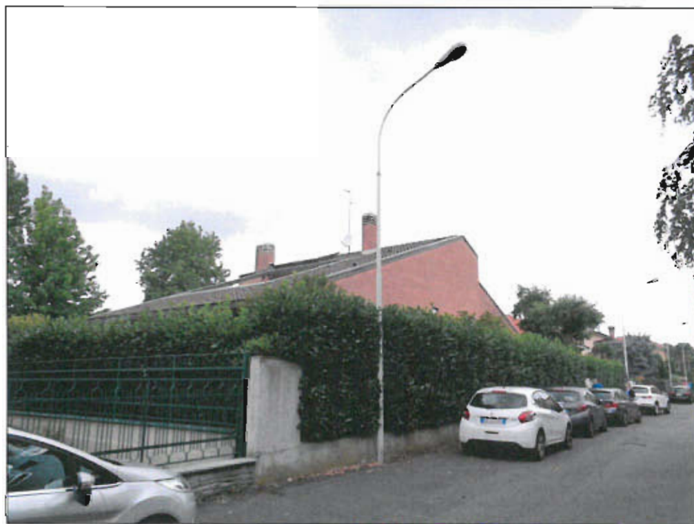
vista fotografica 2)