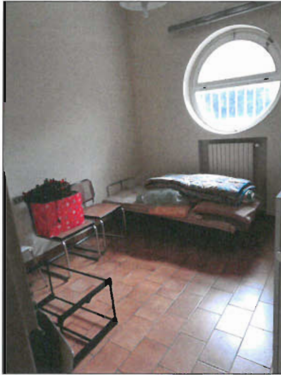
CAMERA PIANO TERRENO - vista fotografica 11)