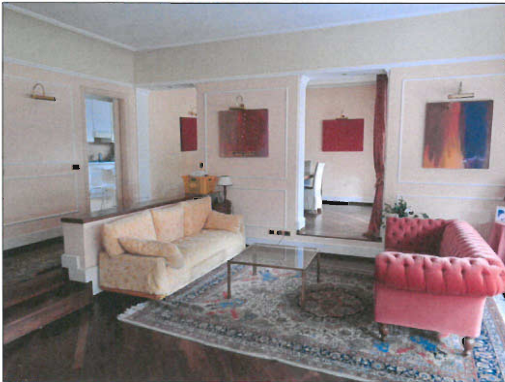
vista fotografica 8)