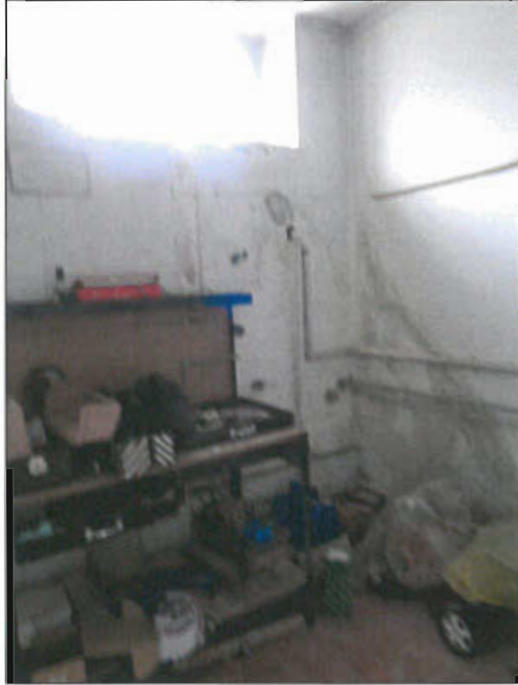
LOCALE RIPOSTIGLIO PIANO SEMINTERRATO - vista fotografica 27)