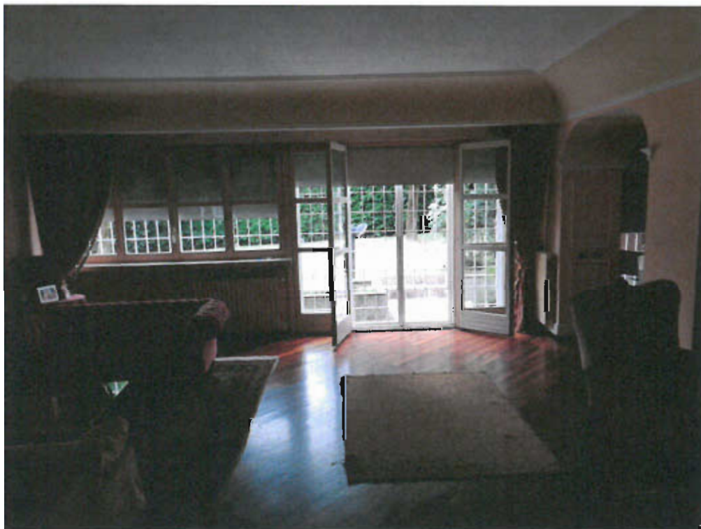
SOGGIORNO - vista fotografica 6)