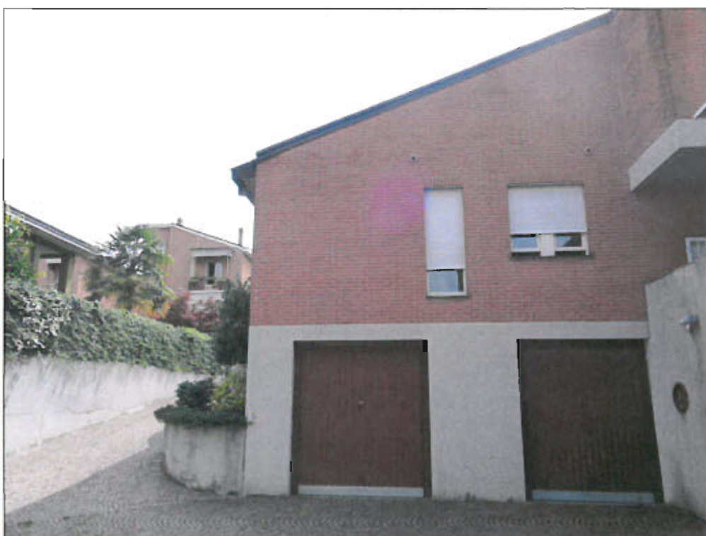
INGRESSO BOX SUB. 702 PROSPETTO OVEST - vista fotografica 24)