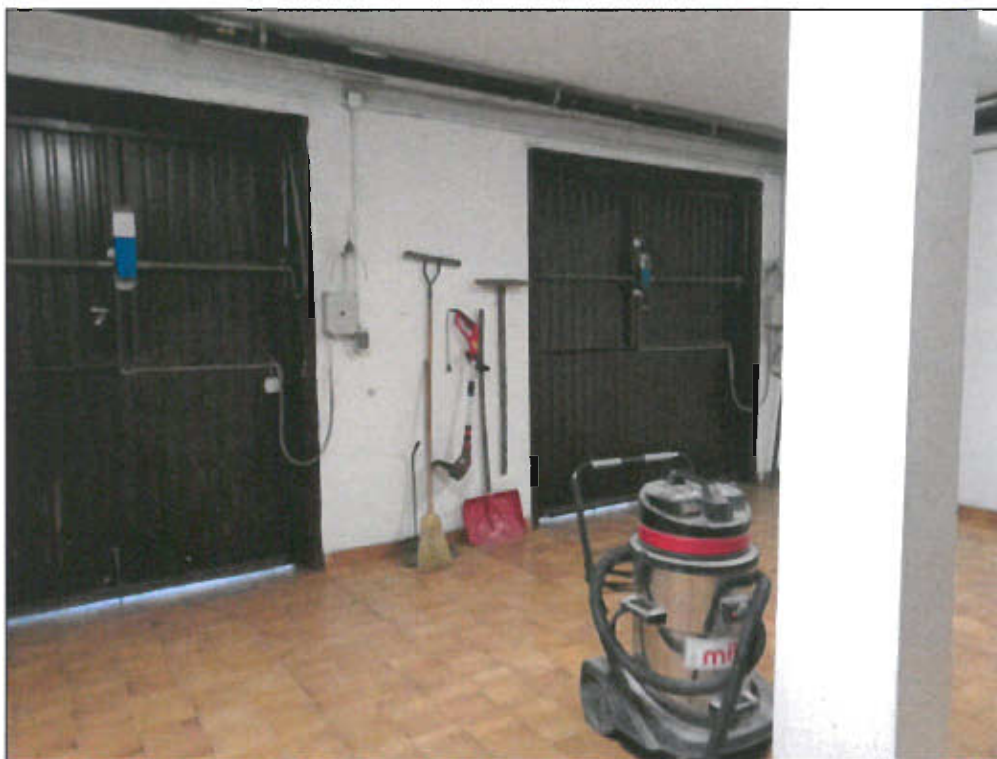
vista fotografica 25)