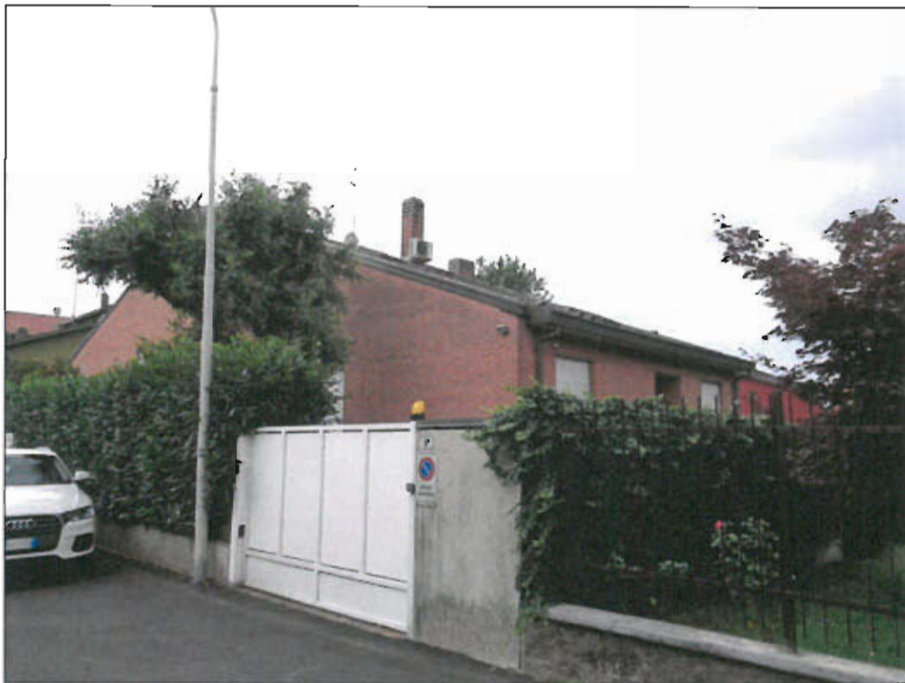
vista fotografica 1)