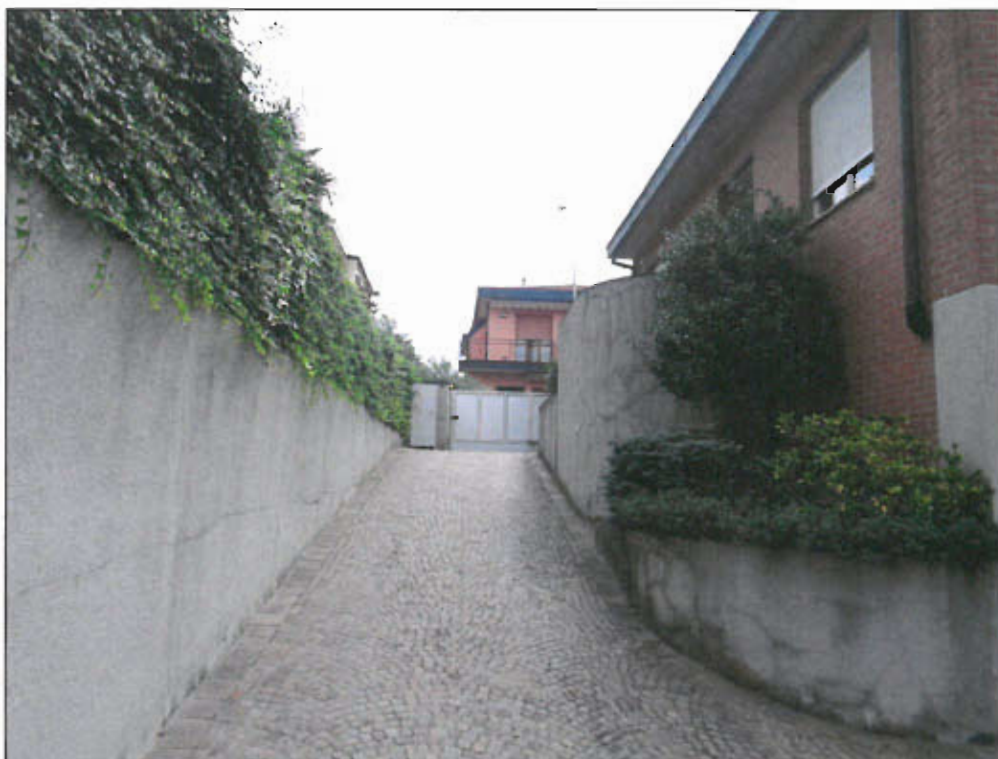
ACCESSO CARRAIO PROSPETTO NORD - vista fotografica 23)