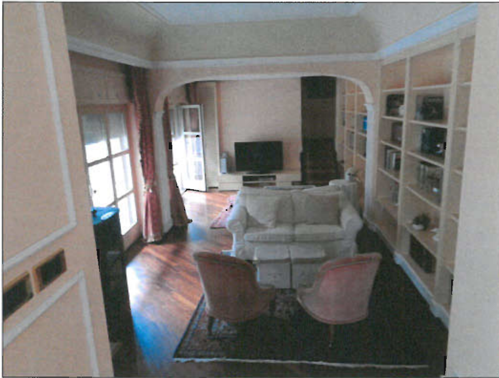
vista fotografica 7)