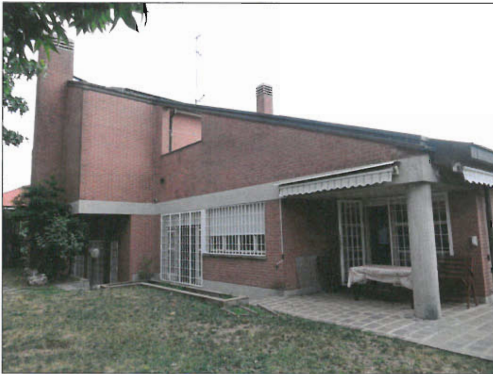
POSPETTO OVEST - vista fotografica 3)