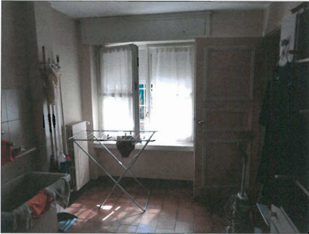
BAGNO PIANO TERRENO - vista fotografica 13)