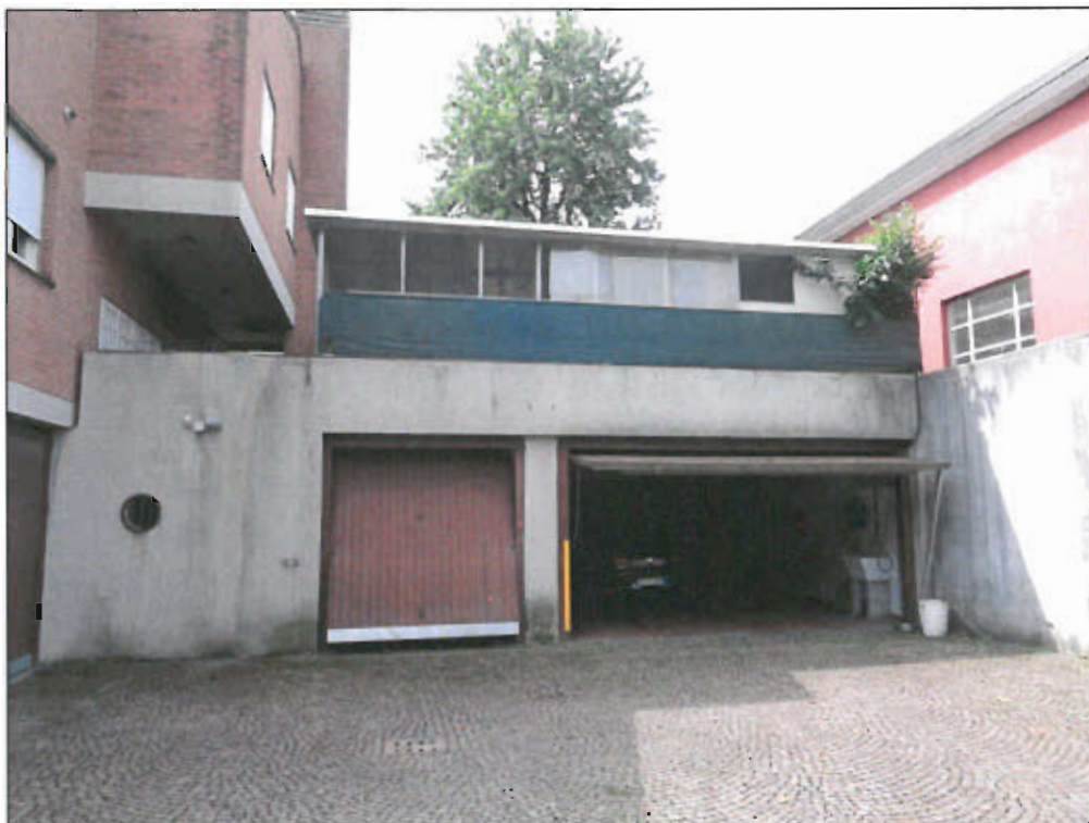
INGRESSO BOX SUB. 4 PROSPETTO NORD - vista fotografica 29)