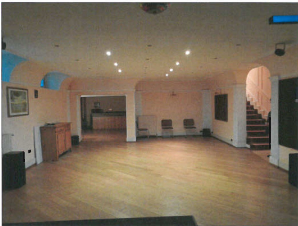
CANTINA E SCALA DI ACCESSO AL PIANO TERRENO - vista fotografica 22)