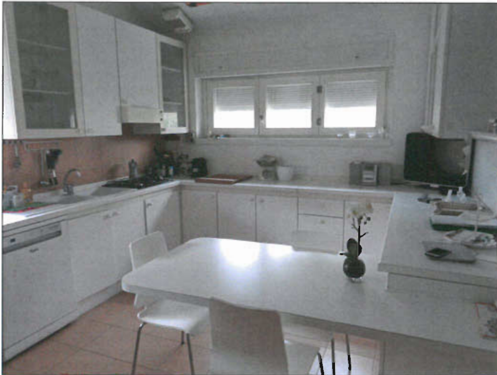
CUCINA - vista fotografica 5)