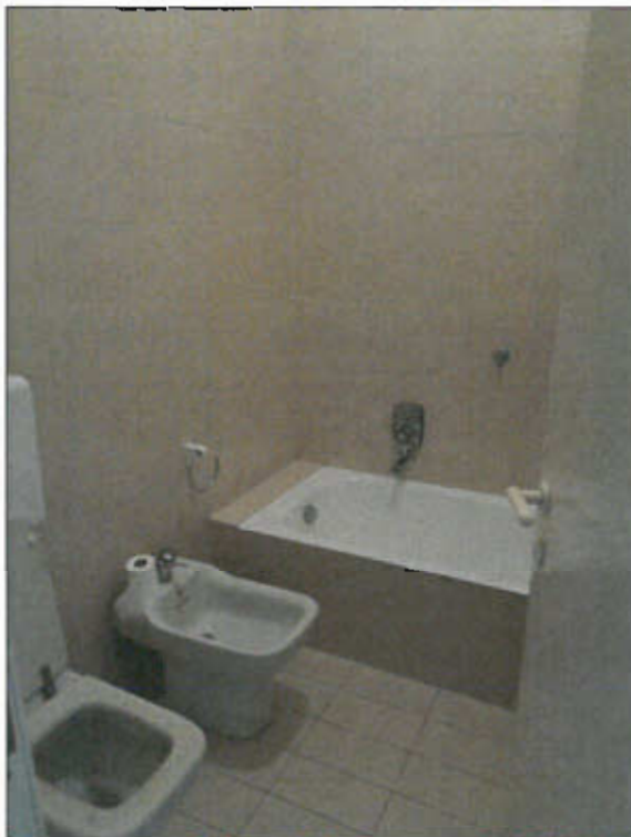
BAGNO PIANO TERRENO - vista fotografica 12)