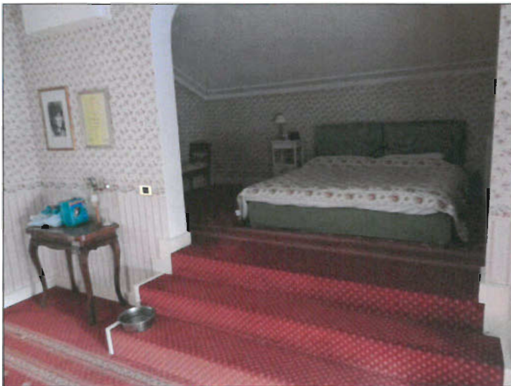
SOLAIO PIANO PRIMO - vista fotografica 16)