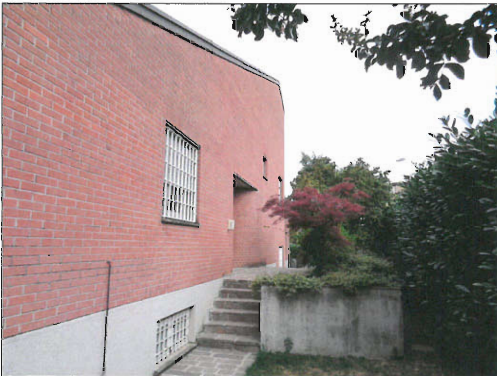
INGRESSO POSPETTO EST - vista fotografica 4)