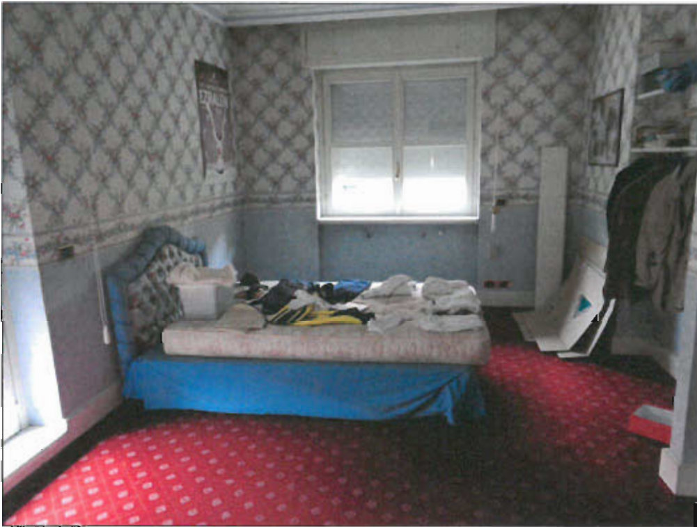
CAMERA PIANO TERRENO - vista fotografica 14)