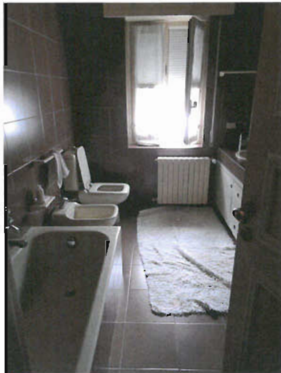
BAGNO PIANO PRIMO - vista fotografica 20)