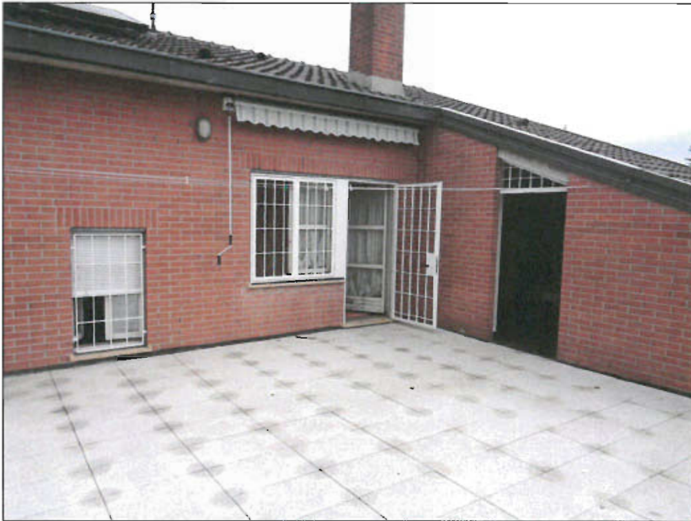
TERRAZZO - vista fotografica 21)