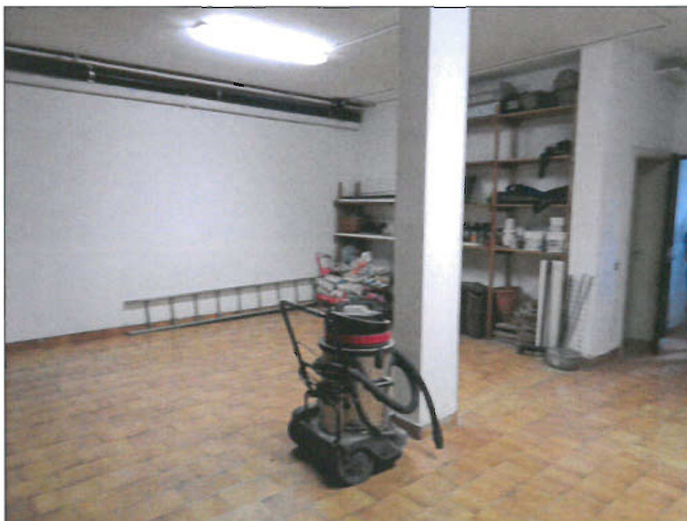
vista fotografica 26)