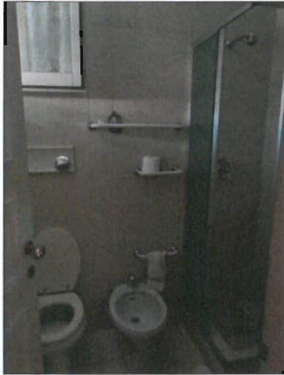
BAGNO PIANO PRIMO - vista fotografica 15)