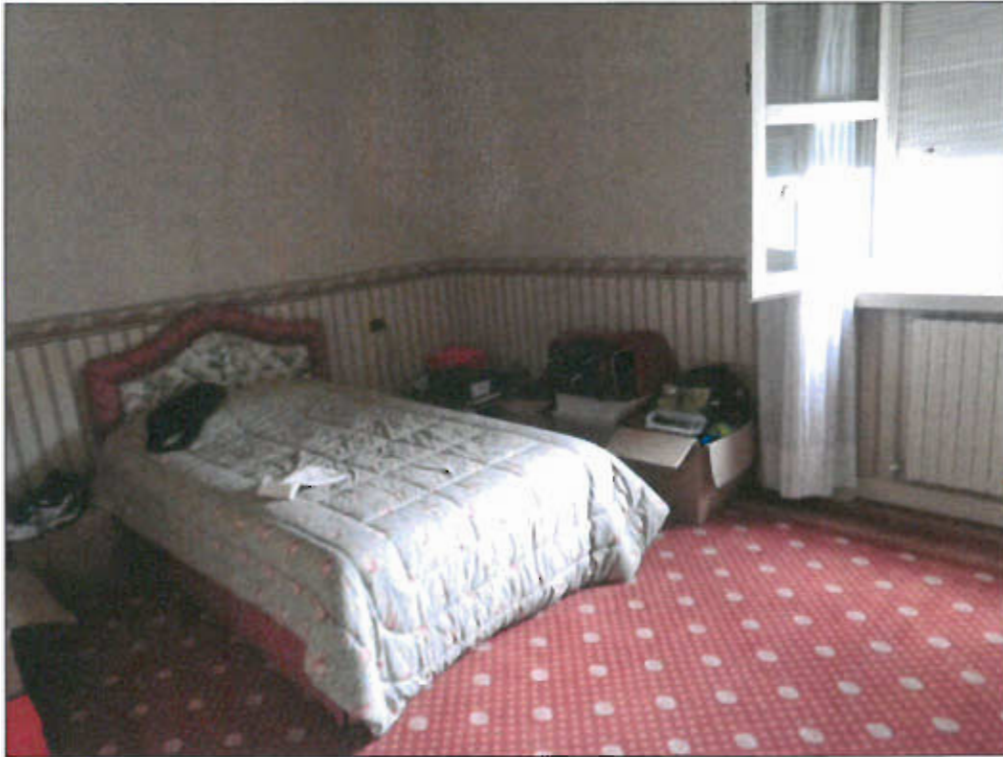
CAMERA PIANO PRIMO - vista fotografica 19)