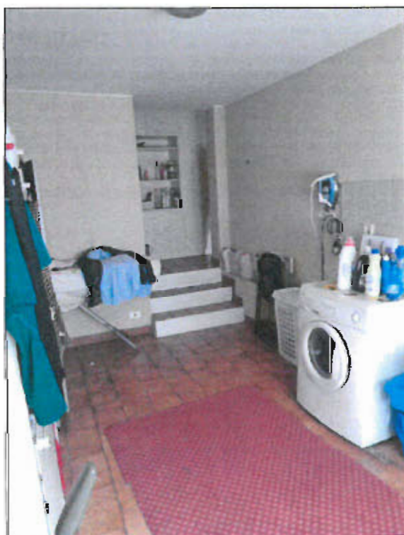
LAVANDERIA PIANO TERRENO - vista fotografica 10)