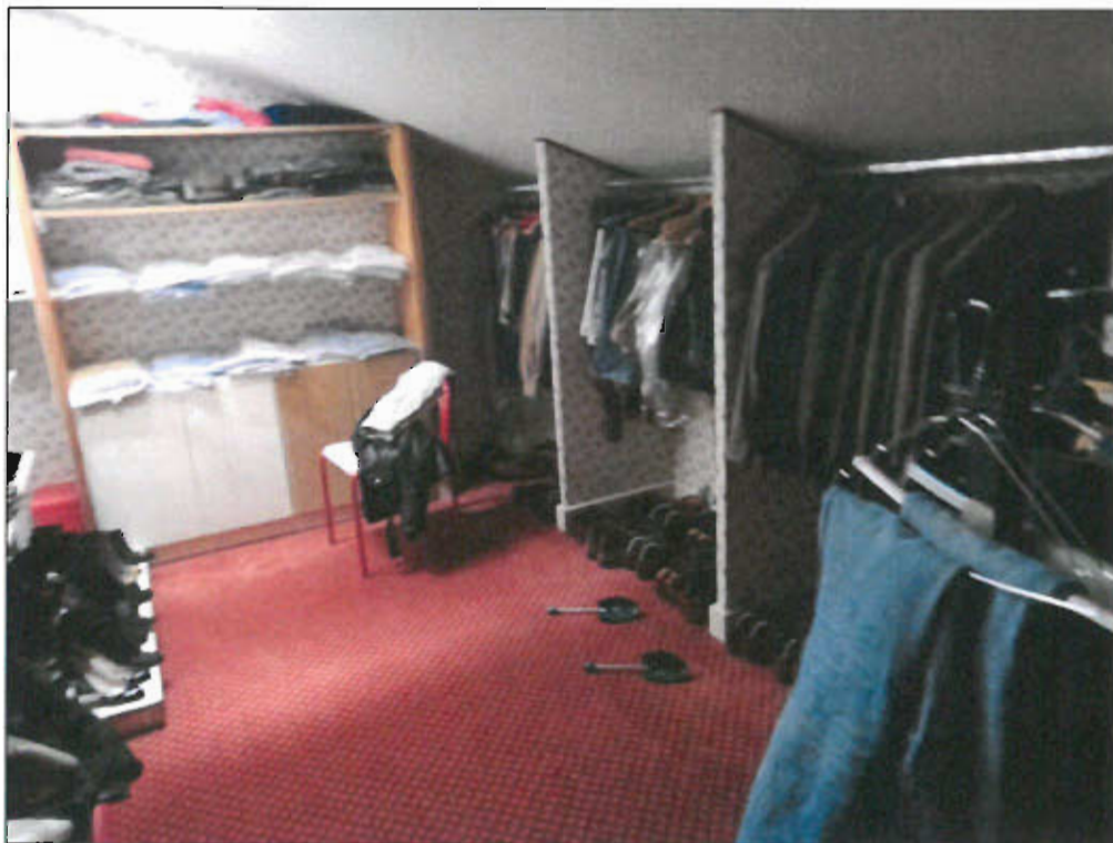
SOLAIO PIANO PRIMO - vista fotografica 17)