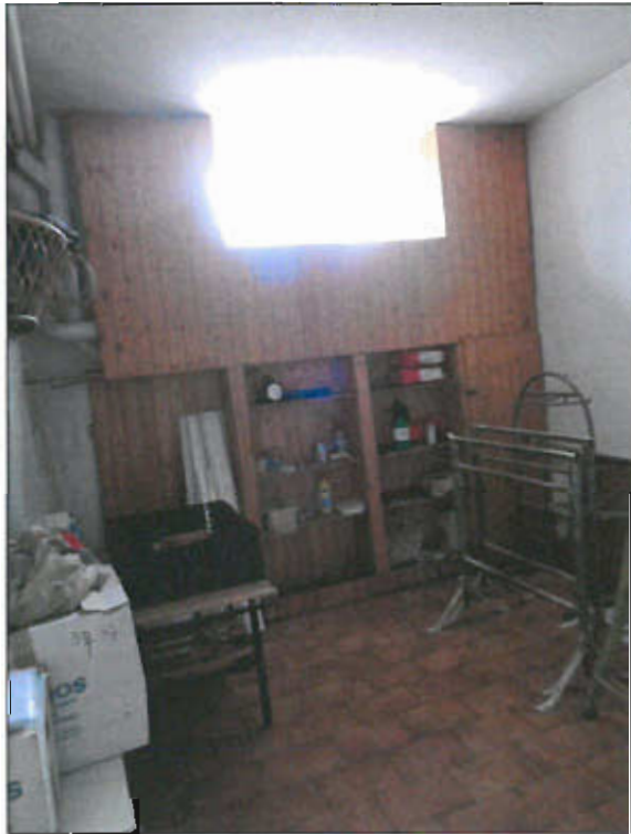
CANTINA PIANO SEMINTERRATO - vista fotografica 28)