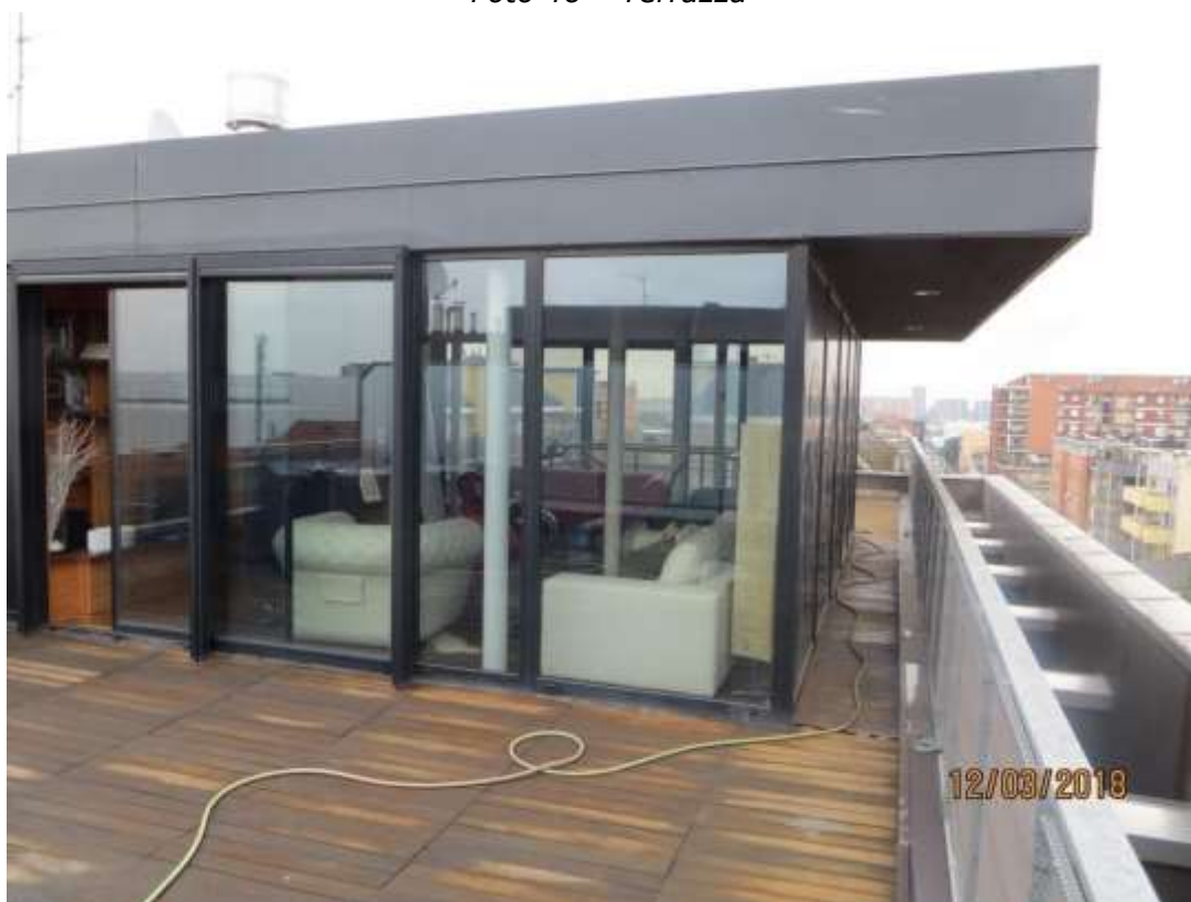
Foto 47 - Terrazza