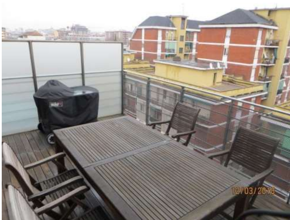
Foto 25 – Terrazzo accessibile dal corridoio e dalla cucina con affaccio su via Fortezza