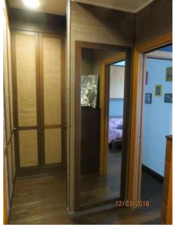
Foto 32 – Accesso al bagno ad uso esclusivo della camera da letto matrimoniale