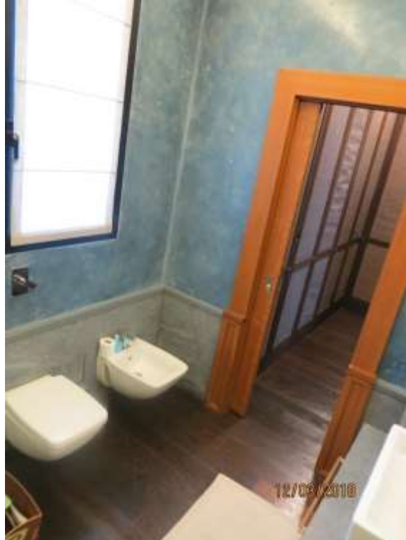
Foto 35 – Vista del terzo bagno (ad uso esclusivo della camera matrimoniale), verso la cabina armadio e il disimpegno