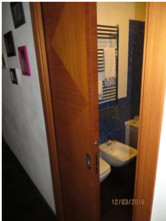
Foto 30 - Accesso al bagno principale