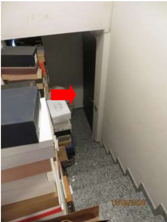
Foto 11/12 - Locale di ingresso all'appartamento con accesso dal vano scala comune