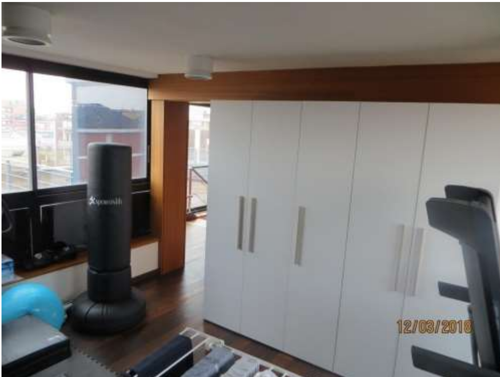
Foto 43 – Vista dal secondo locale S.P.P., verso l'ingresso con accesso al terrazzo