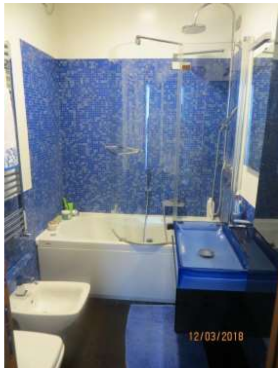
Foto 31 - Bagno principale