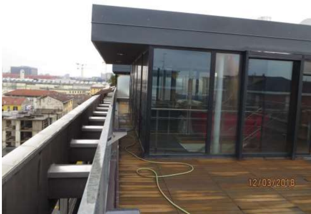
Foto 46 - Terrazza