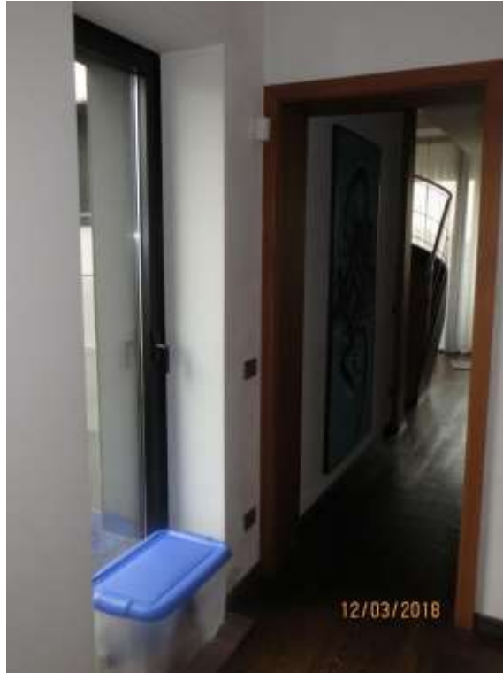
Foto 6 – Ingresso all'appartamento sito al piano 6, con accesso al terrazzo