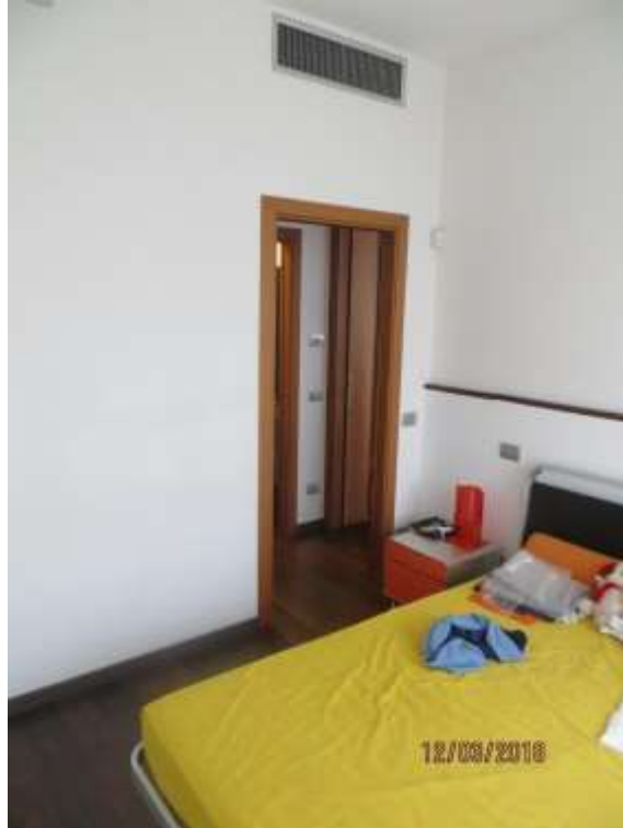
Foto 29 - Vista della camera da letto, verso l'ingresso