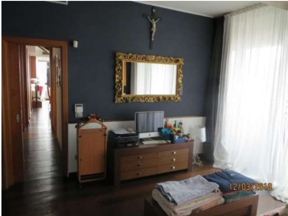
Foto 37 – Vista della camera da letto matrimoniale, verso il disimpegno