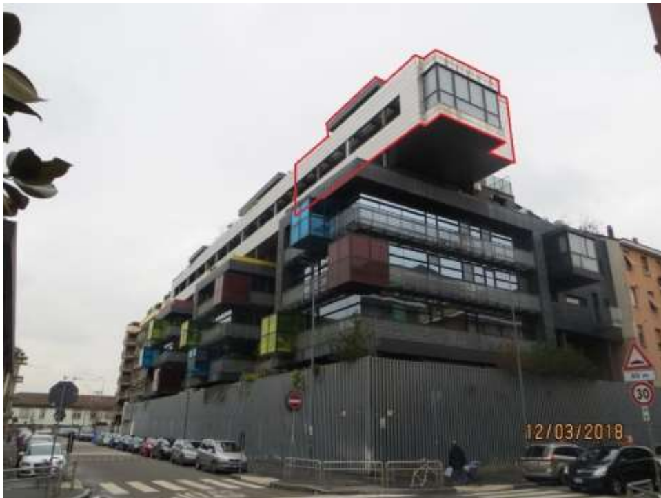
Foto 2 – Vista ed inquadramento, da via Fortezza angolo via Doberdò, dell'unità immobiliare pignorata