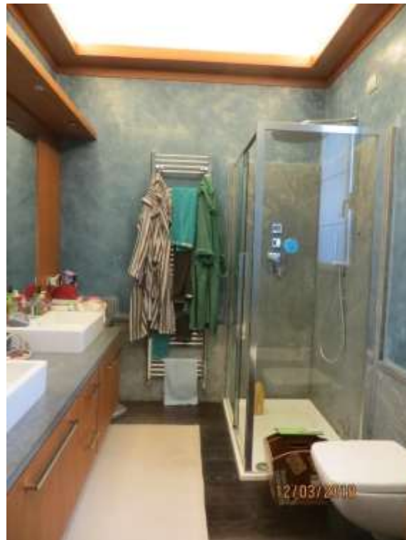
Foto 34 – Bagno ad uso esclusivo della camera da letto matrimoniale