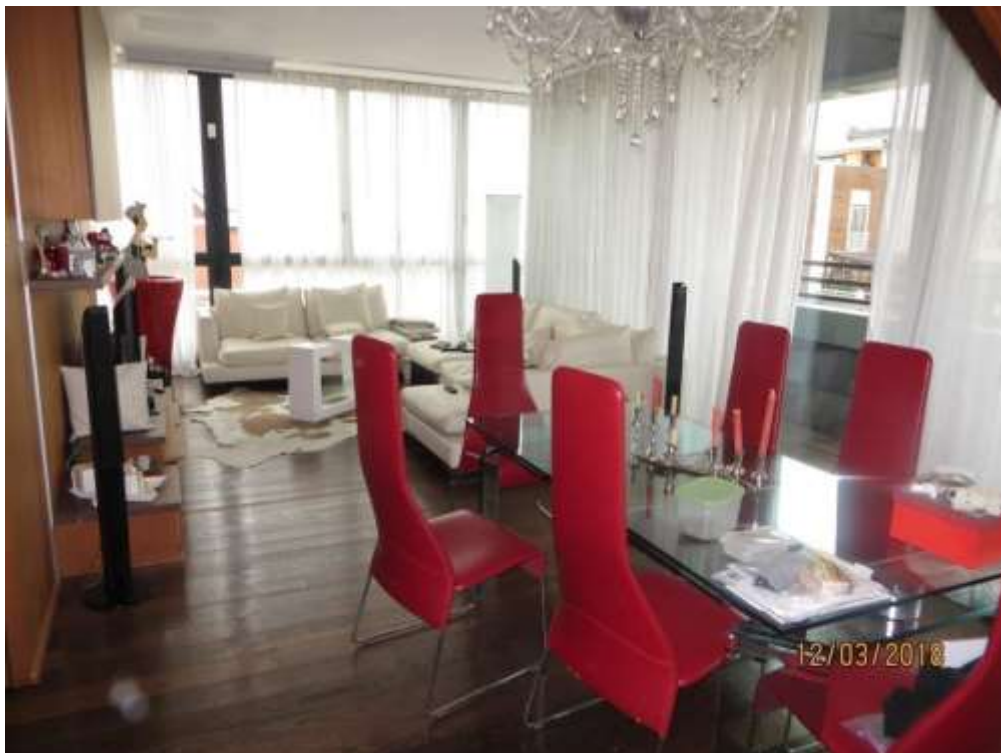
Foto 19 – Soggiorno ad esposizione doppia, con accesso al balcone