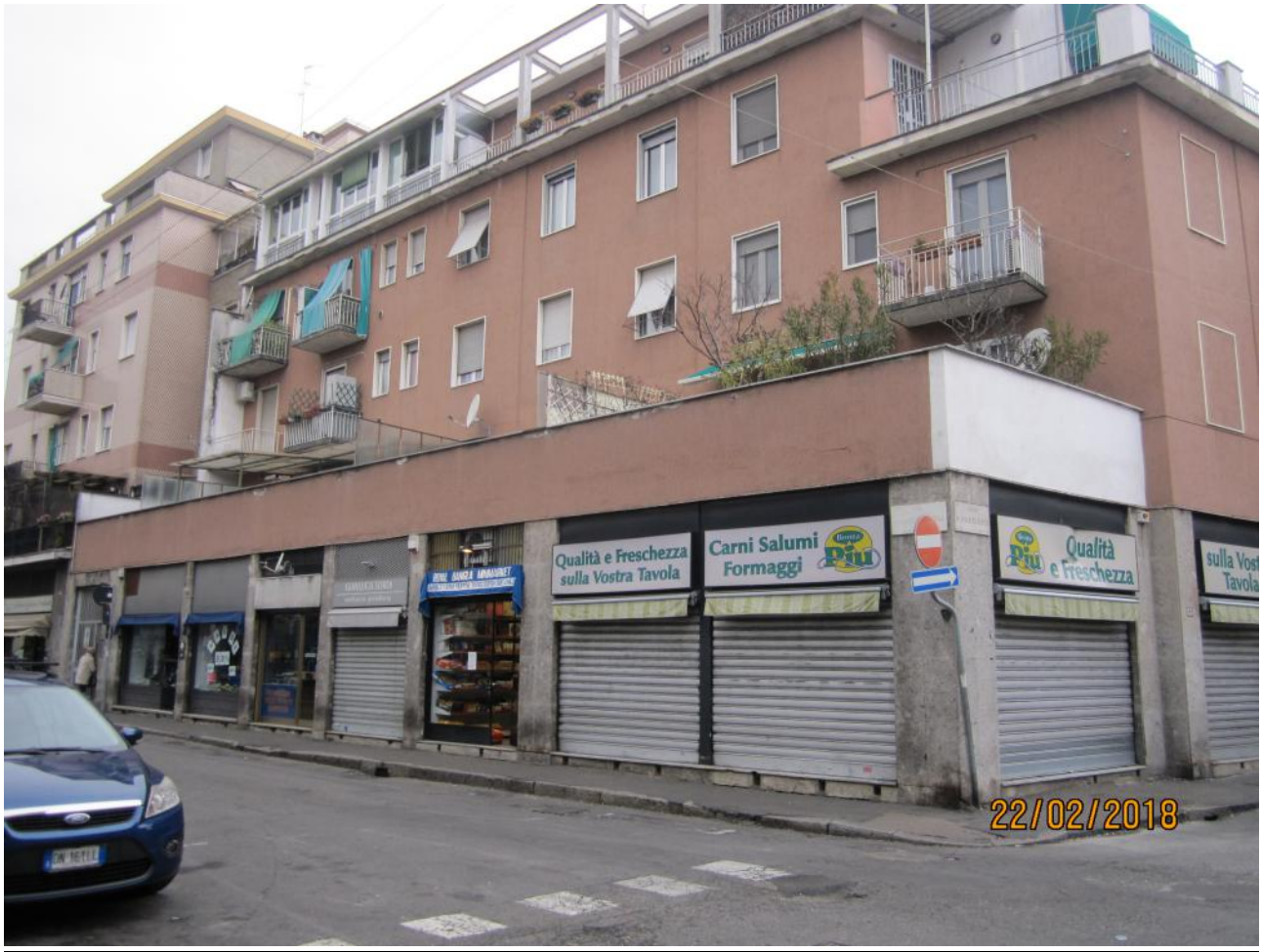
FOTO N. 1 PROSPETTO SU VIA A. FONTANELLI