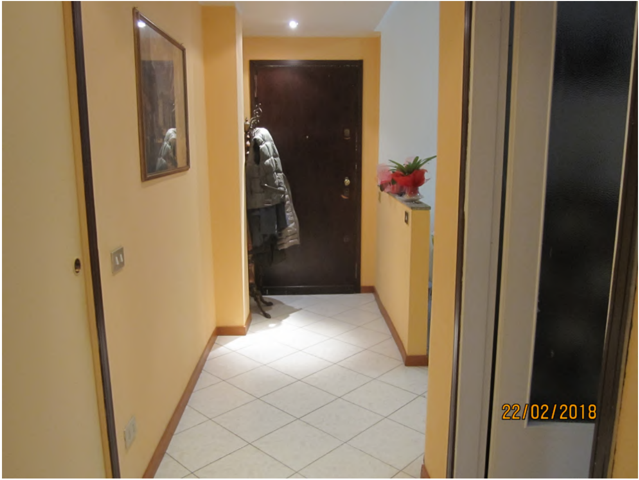
FOTO N. 6 INGRESSO APPARTAMENTO