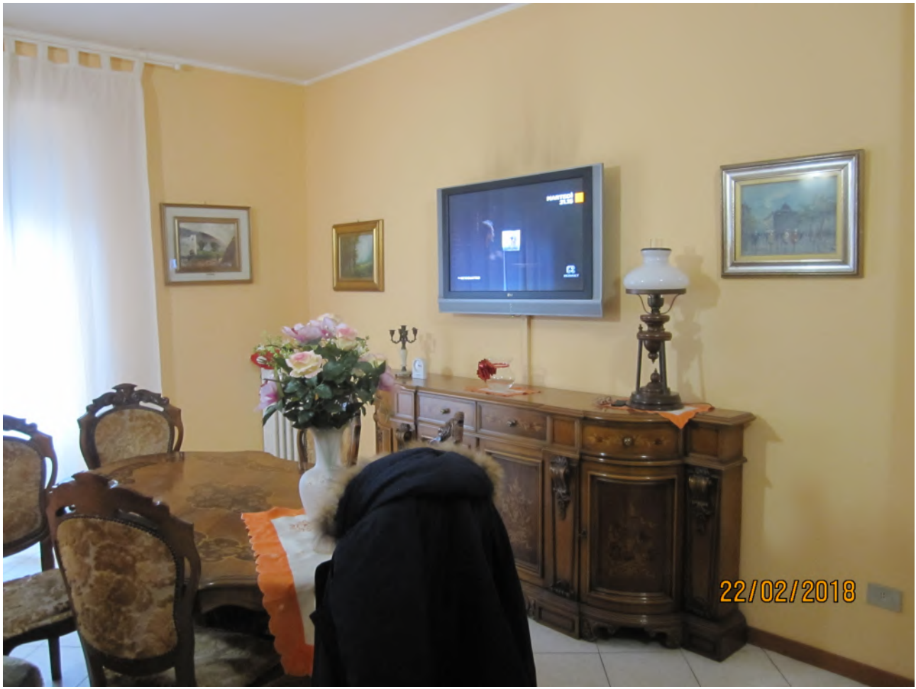
FOTO N. 7 LOCALE SOGGIORNO-PRANZO