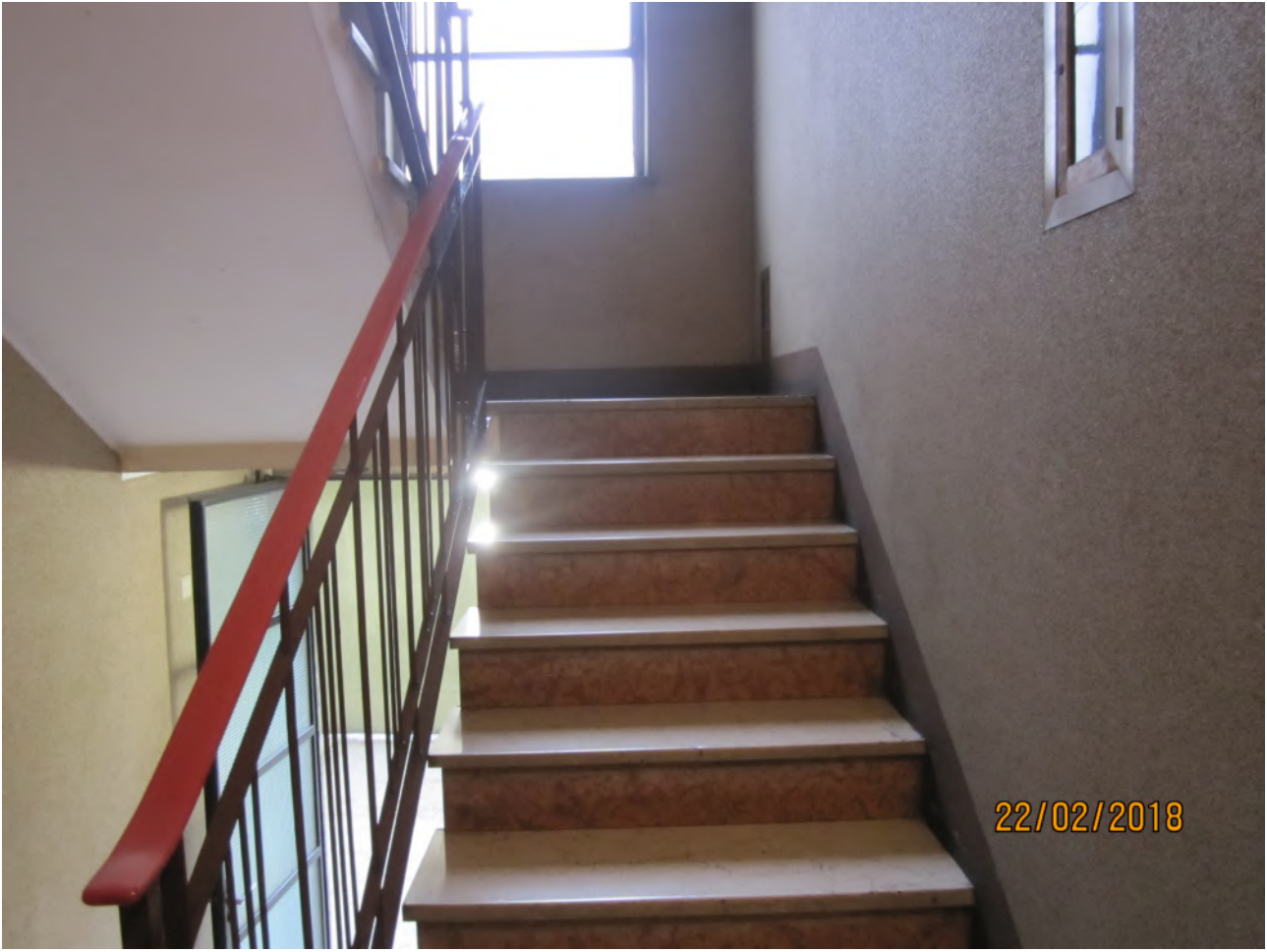
FOTO N. 4 SCALA DI ACCESSO AI PIANI