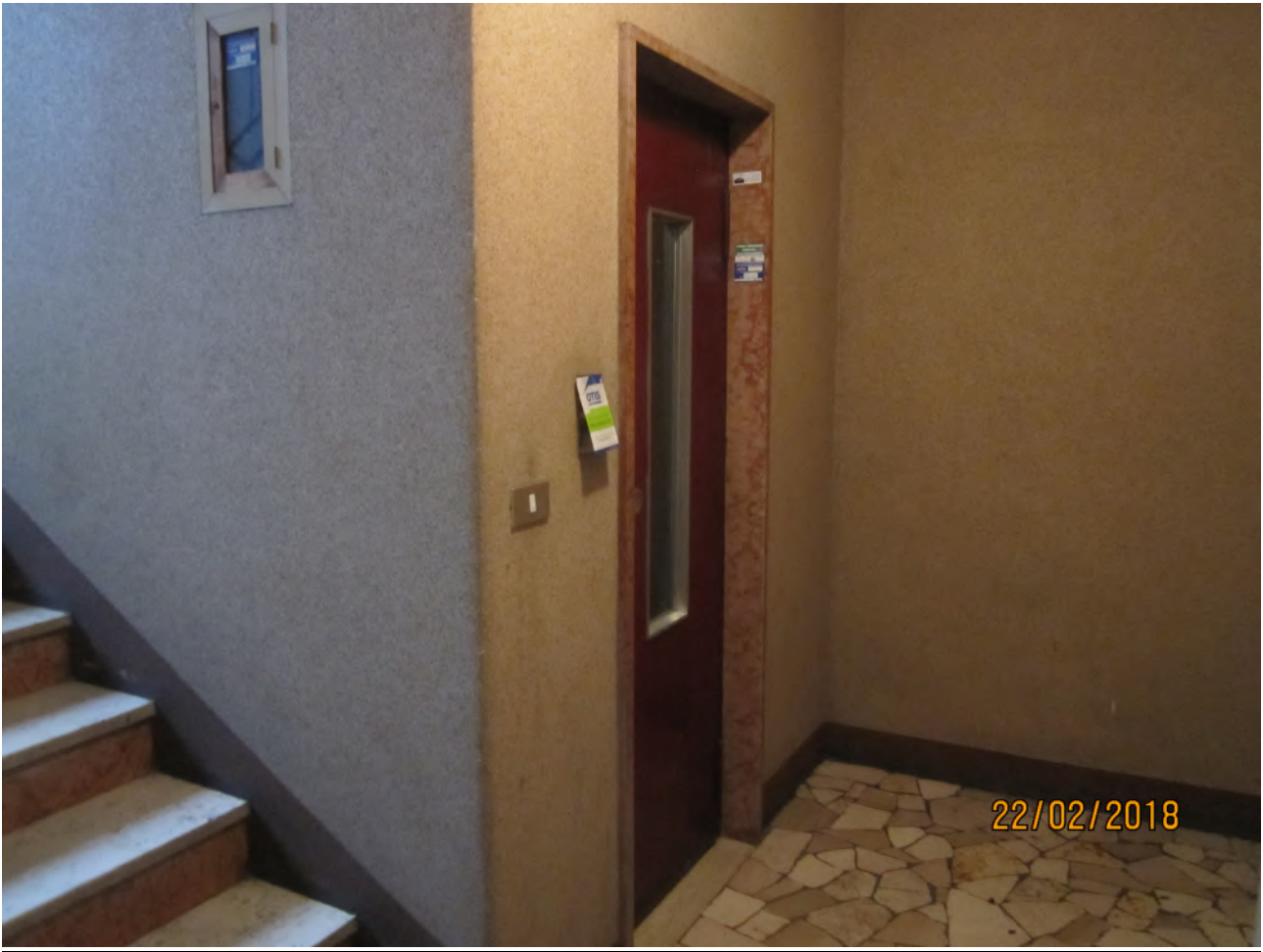
FOTO N. 5 ASCENSORE