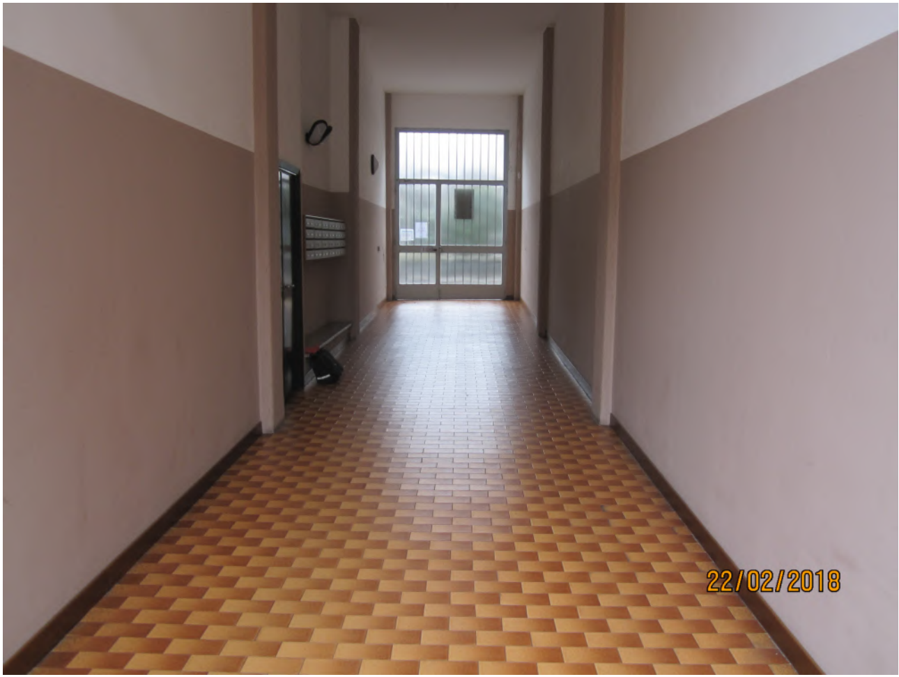
FOTO N. 3 ANDRONE INTERNO PALAZZINA