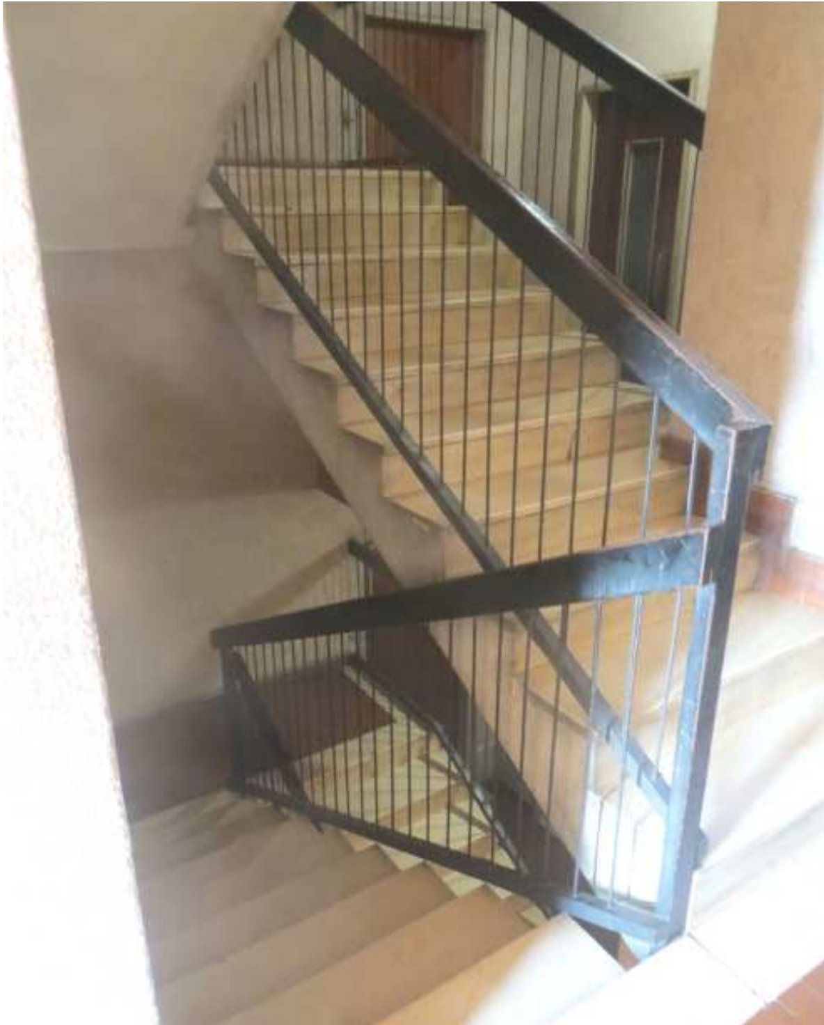
Vista delle parti comuni per l'accesso all'unità immobiliare