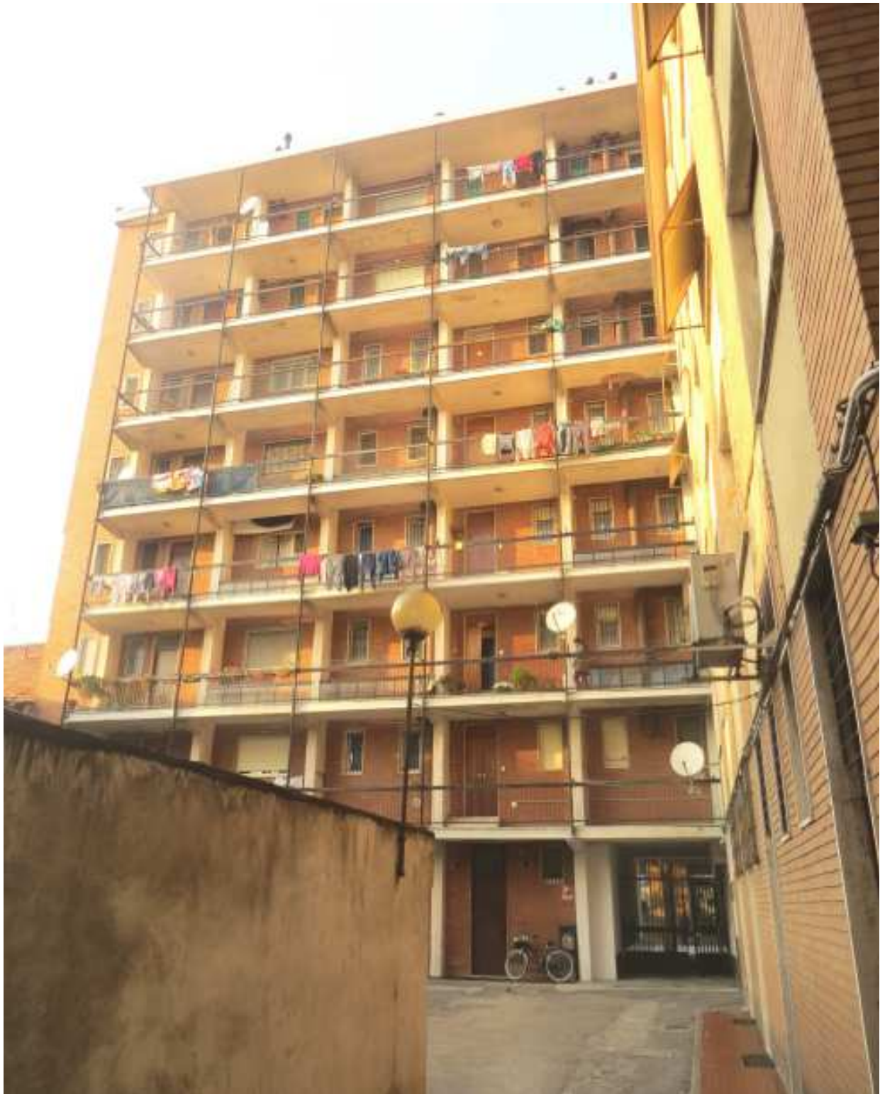
Vista del fabbricato dal lato cortile