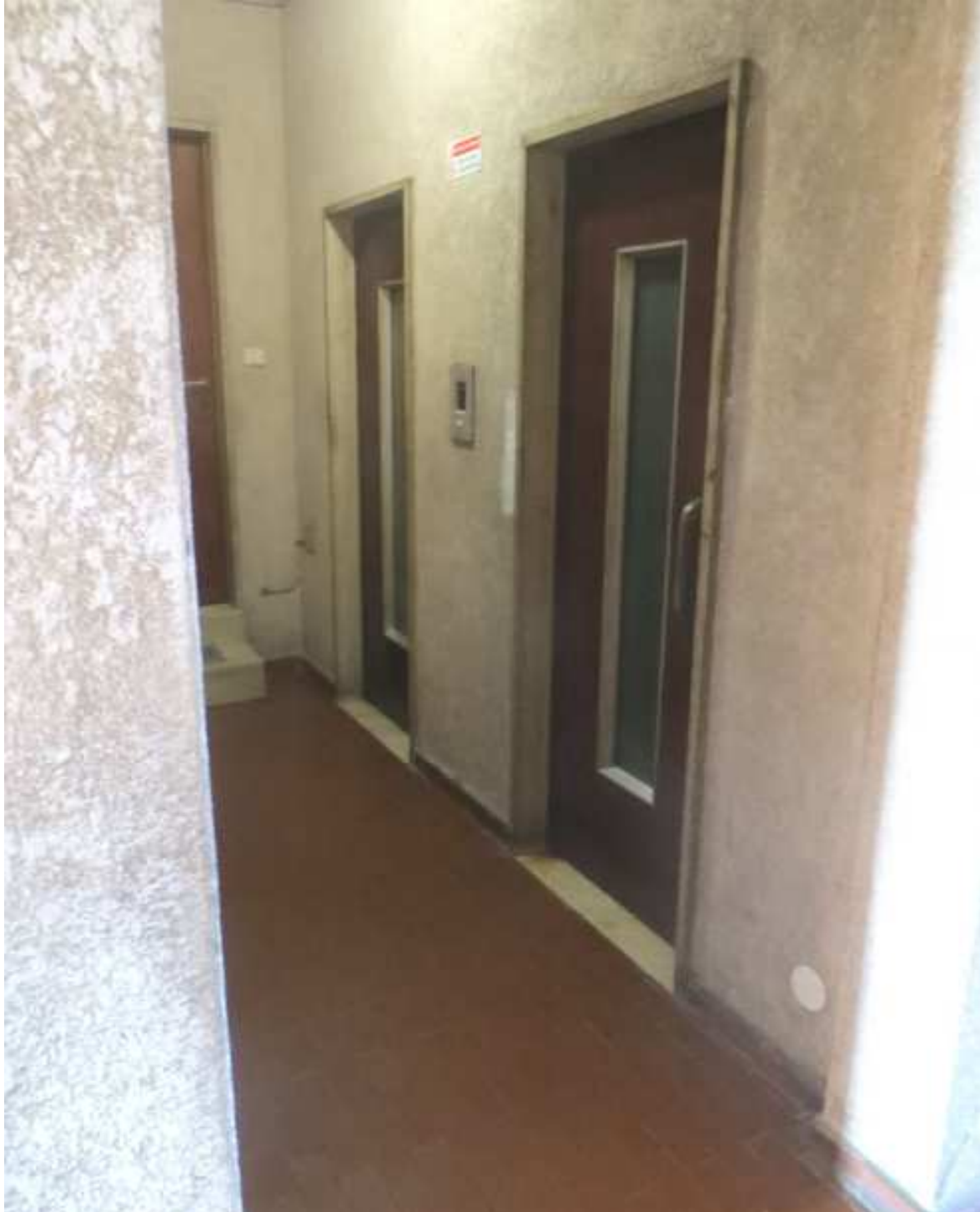
Vista delle parti comuni per l'accesso all'unità immobiliare