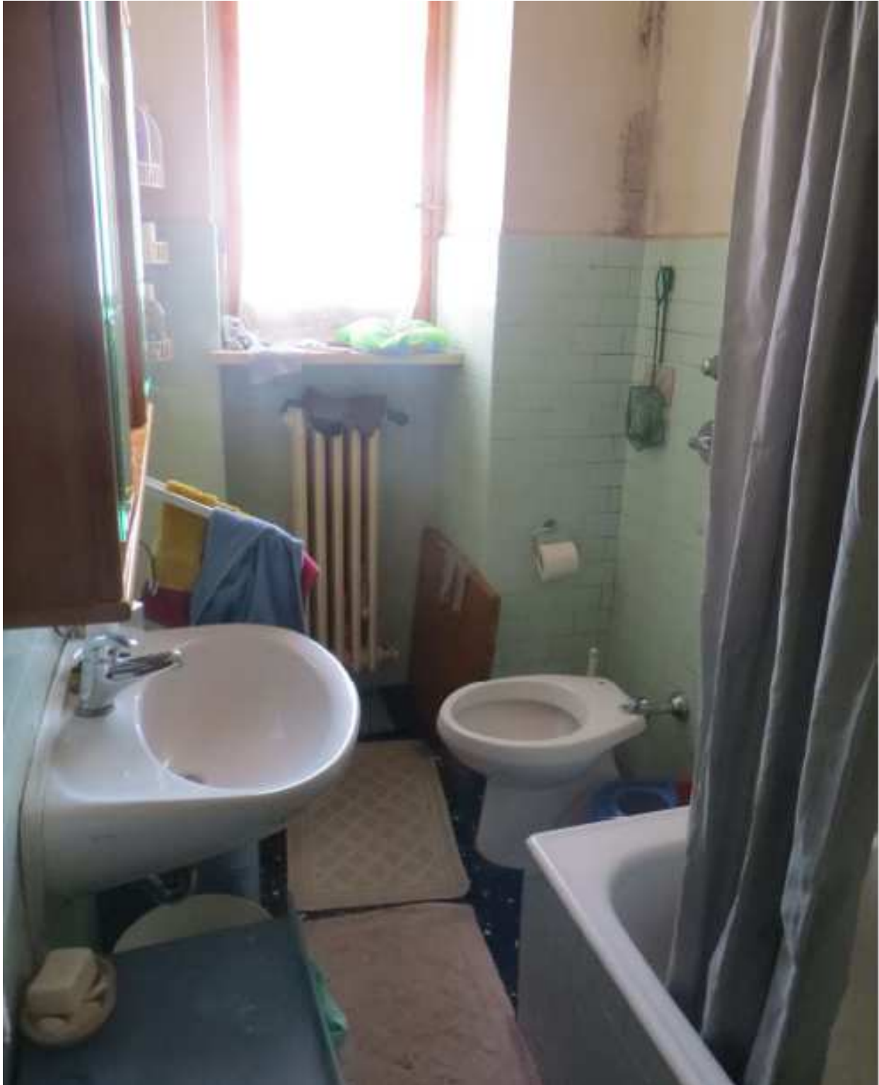
Vista interna del bagno