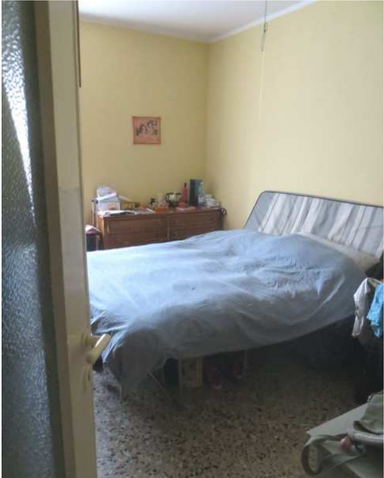
Vista interna della camera in fregio a via Magenta