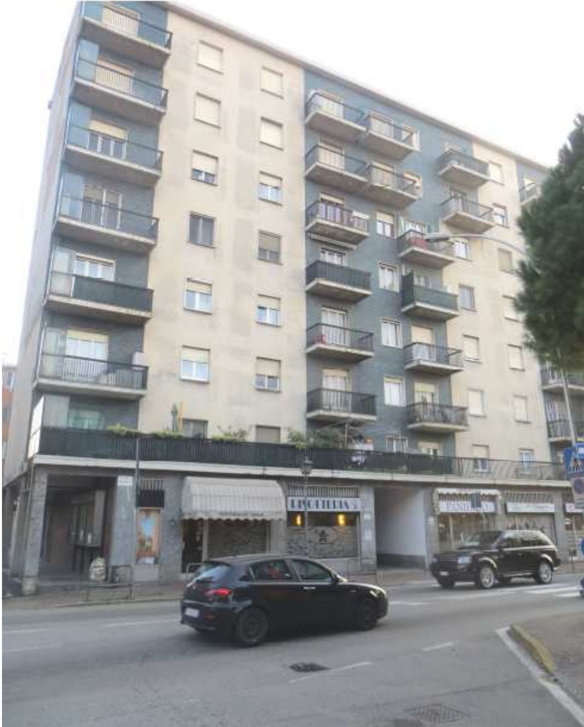
Vista del fabbricato su via Magenta