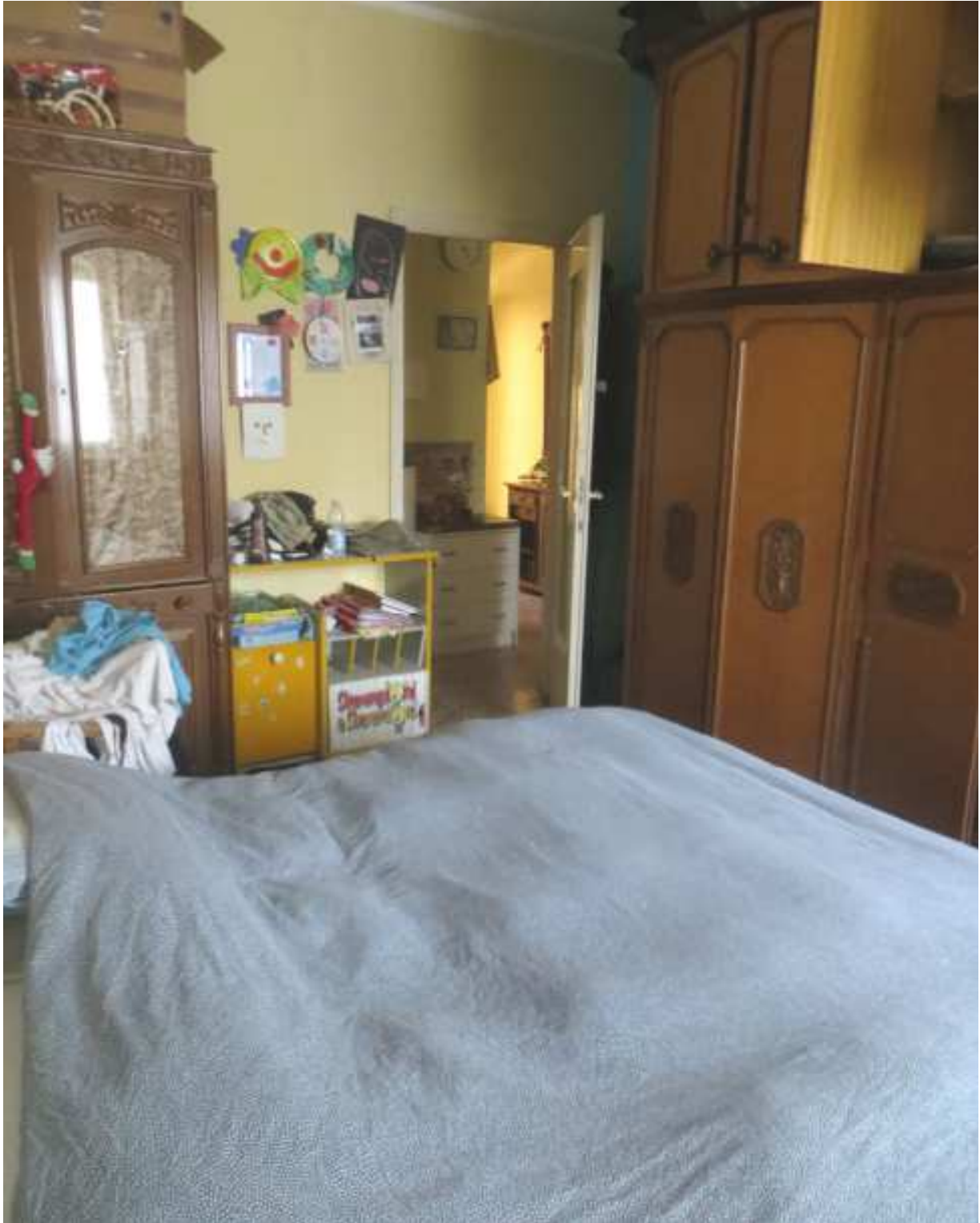
Vista interna della camera in fregio a via Magenta