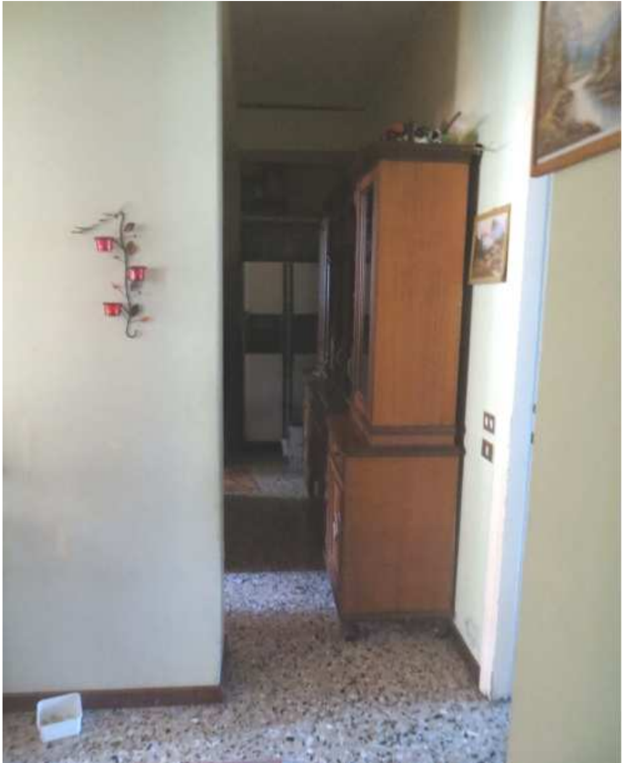
Vista interna del disimpegno