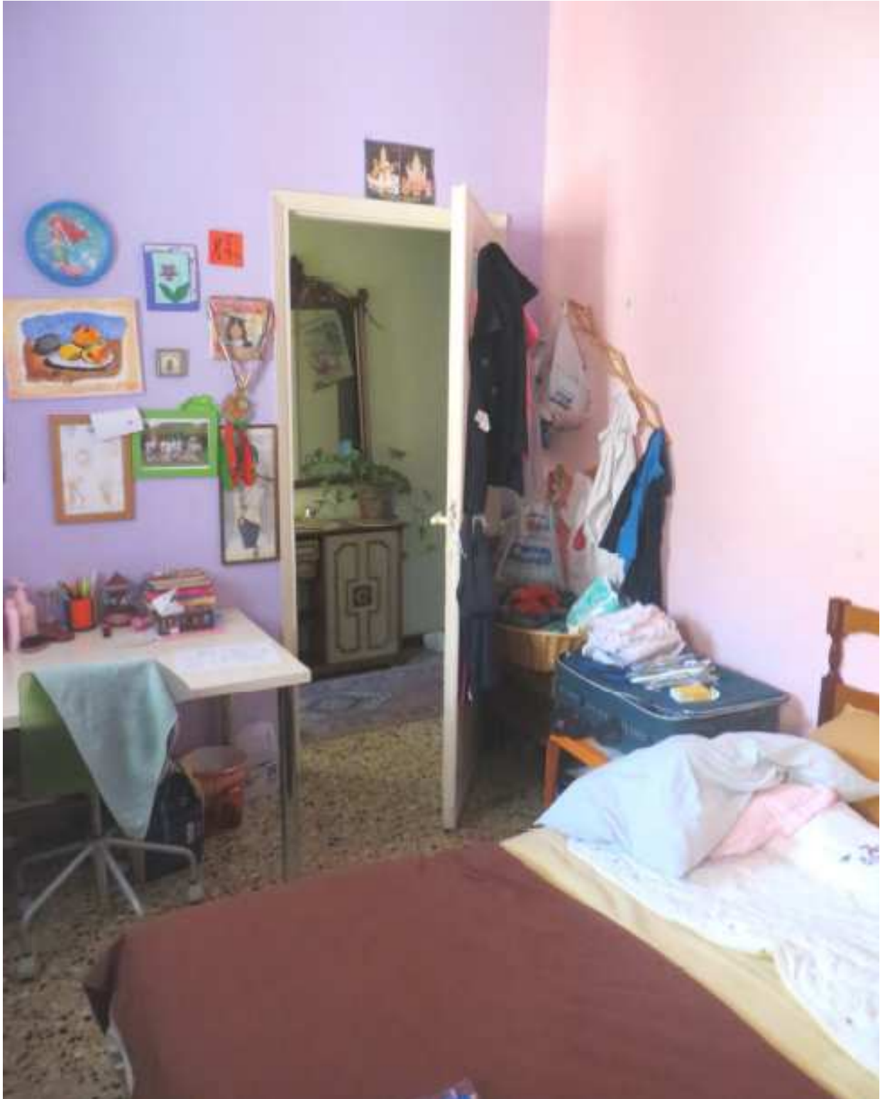
Vista interna della camera lato cortile