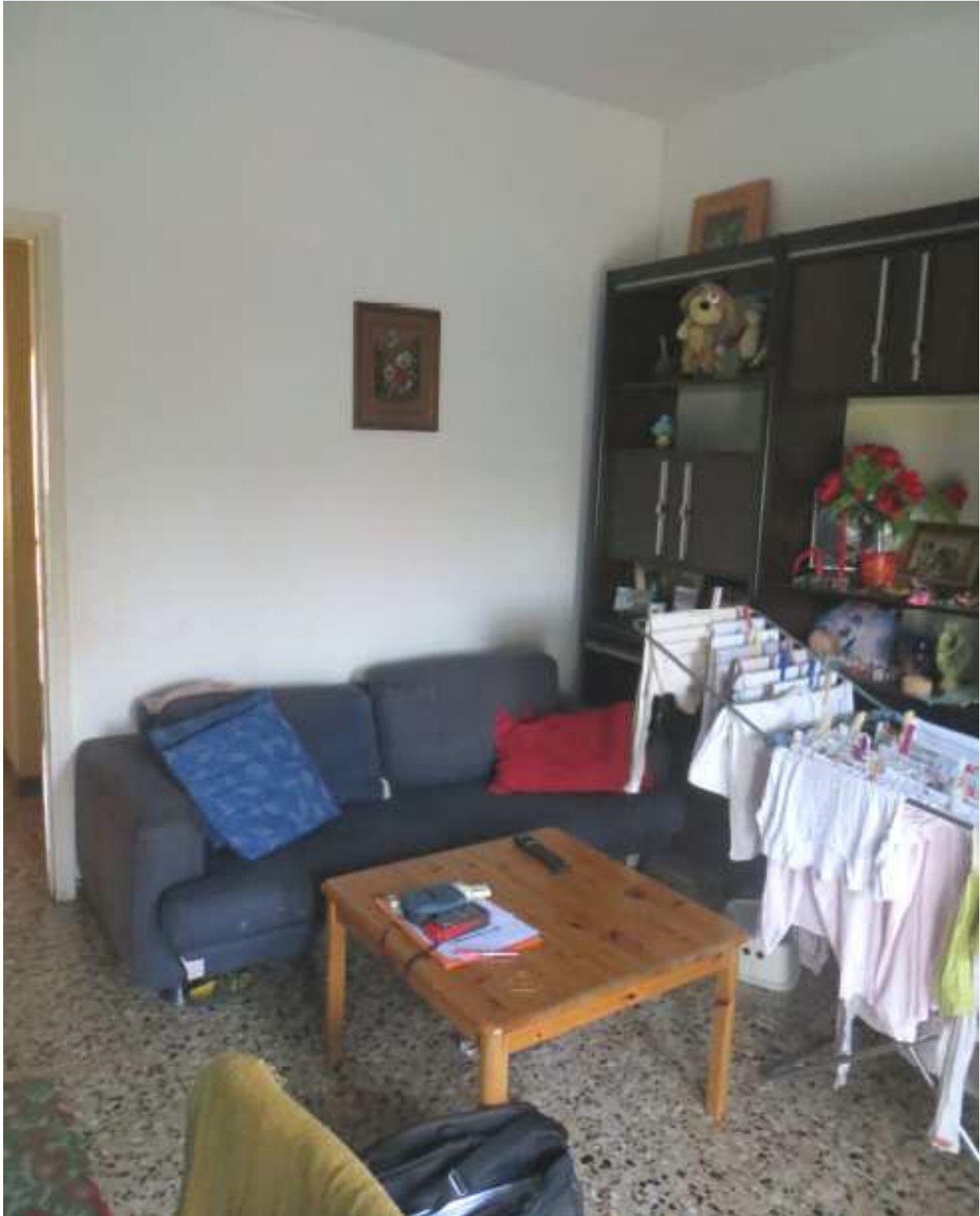
Vista interna del soggiorno