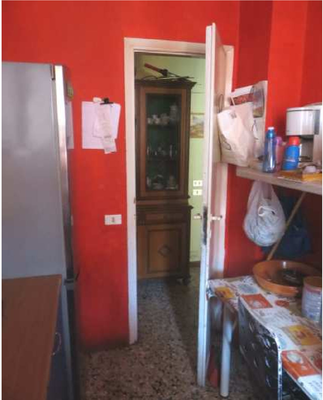
Vista interna del locale cucina