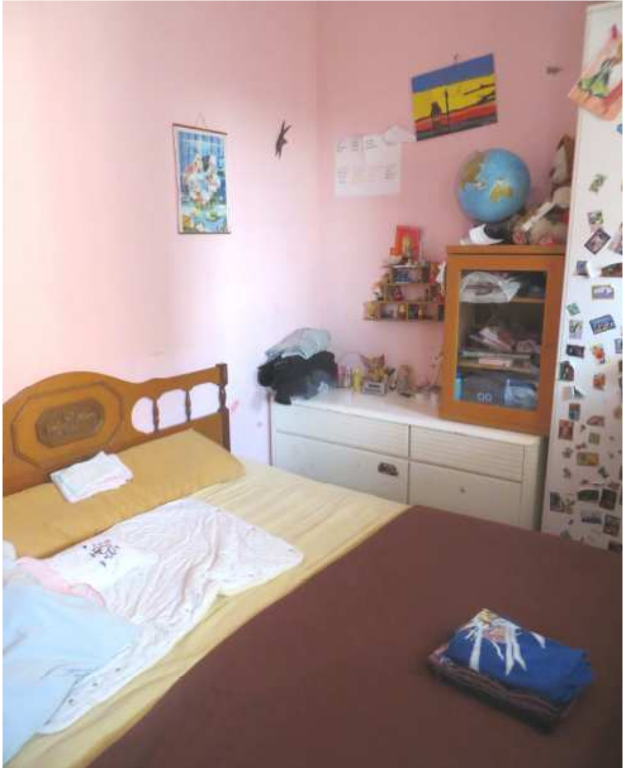
Vista interna della camera lato cortile