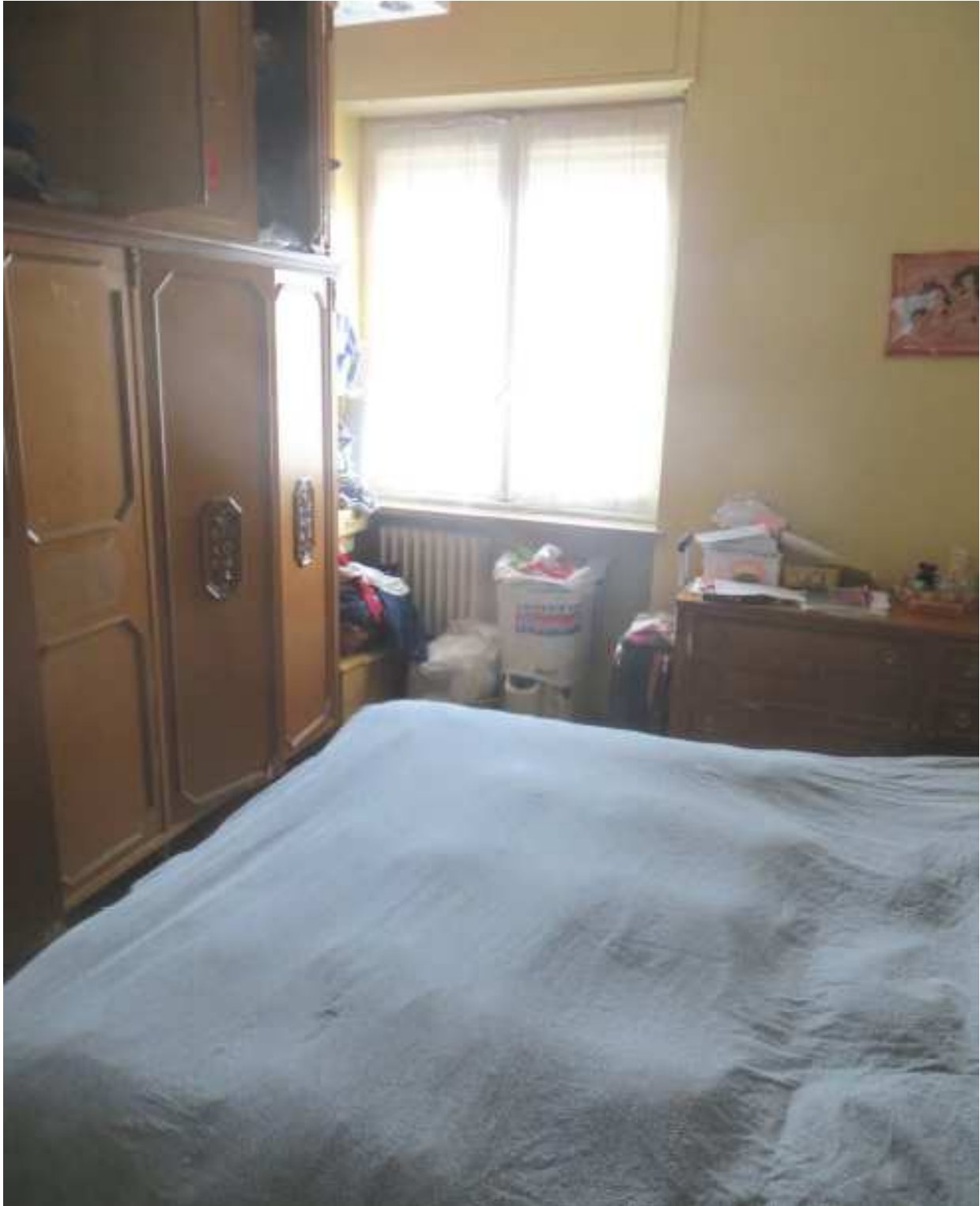
Vista interna della camera in fregio a via Magenta