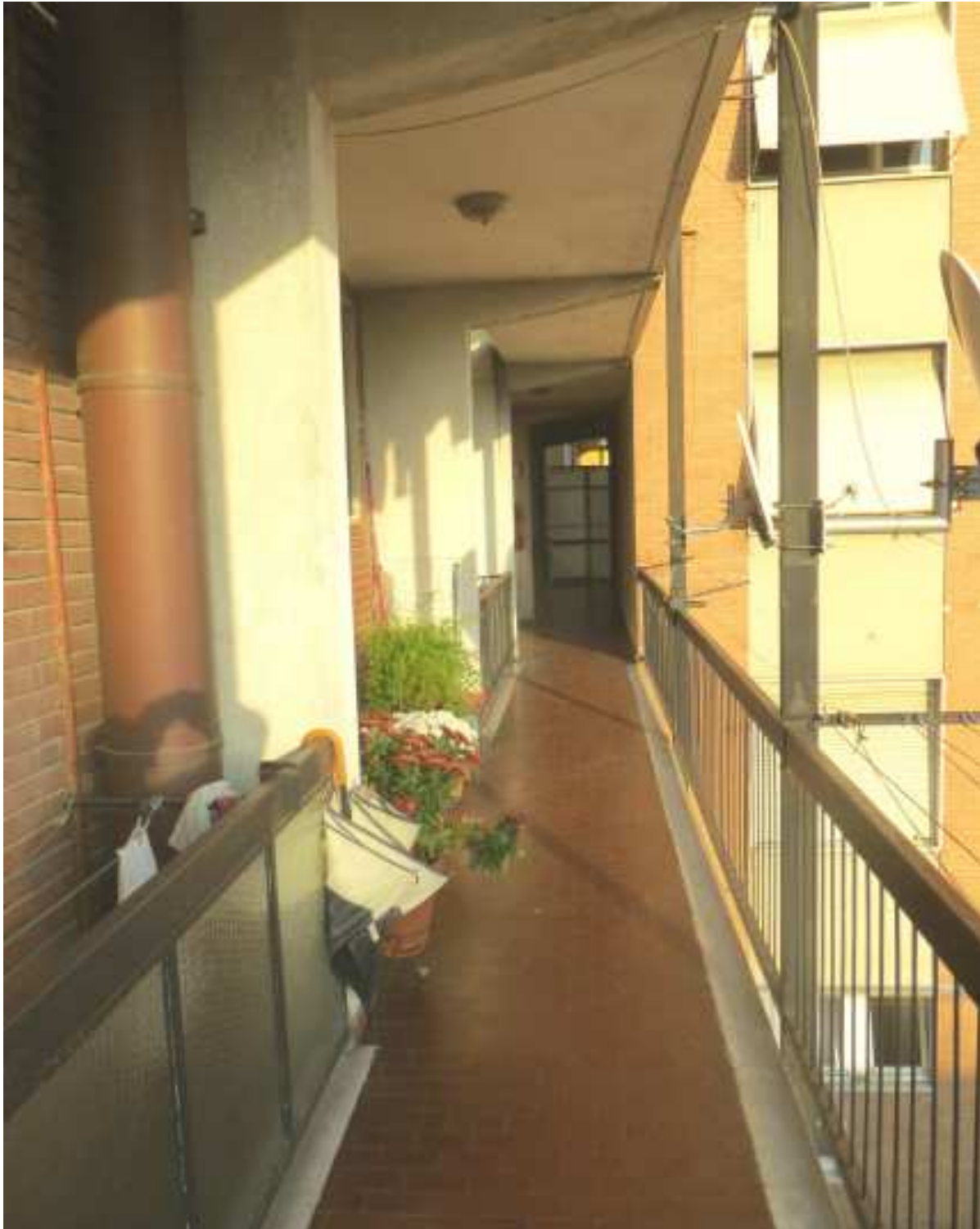
Vista del ballatoio comune di accesso all'unità immobiliare