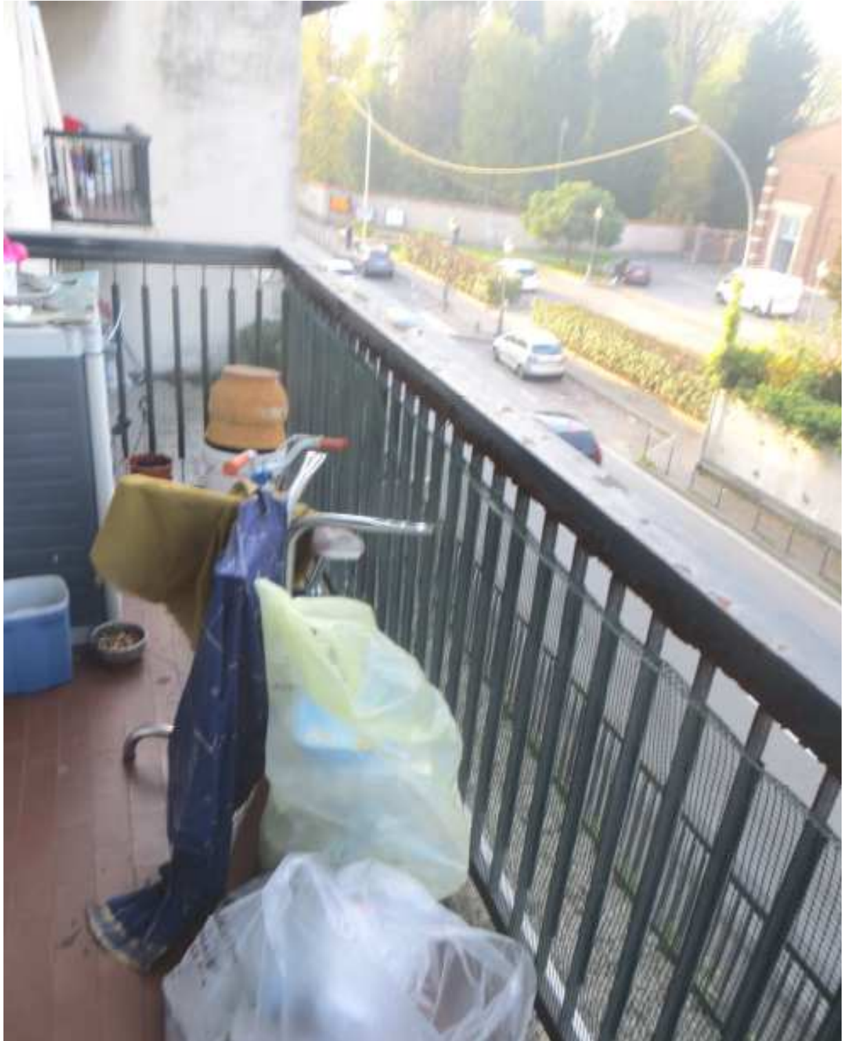
Vista del balcone su via Magenta