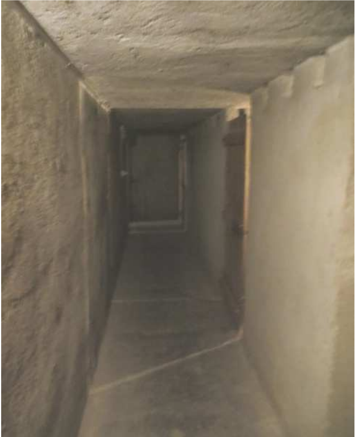
Vista del disimpegno comune di accesso alle cantine