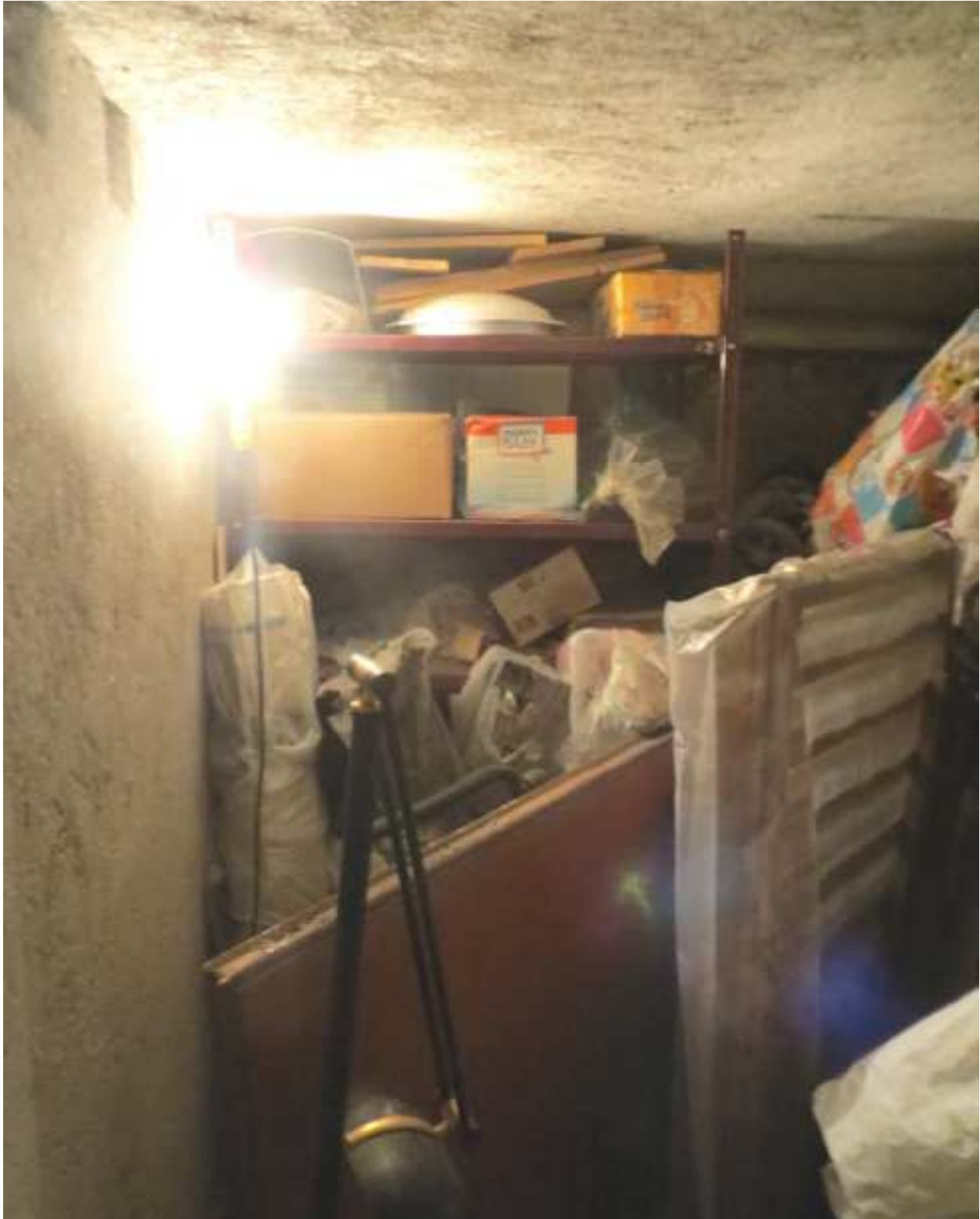
Vista del locale cantina