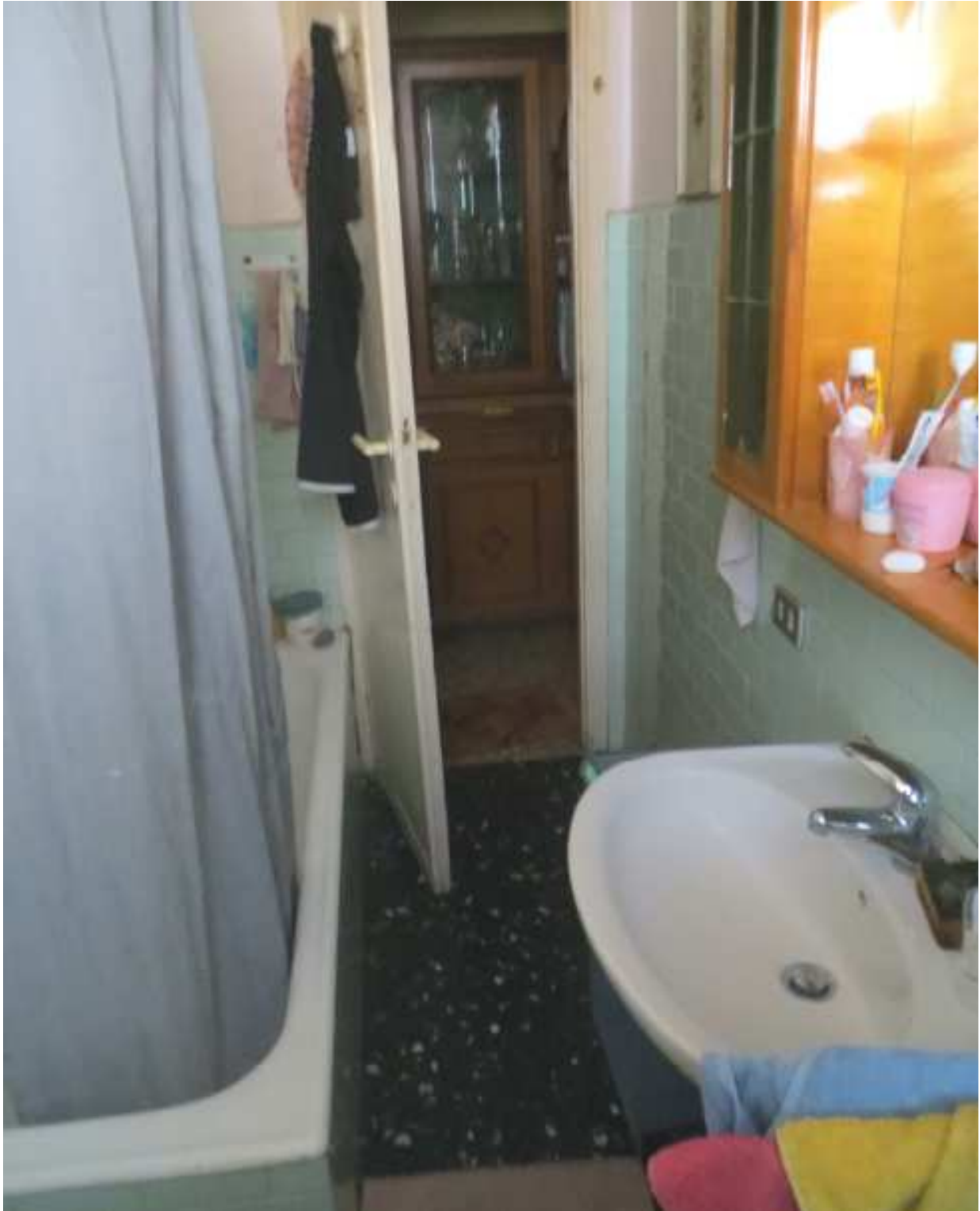
Vista interna del bagno