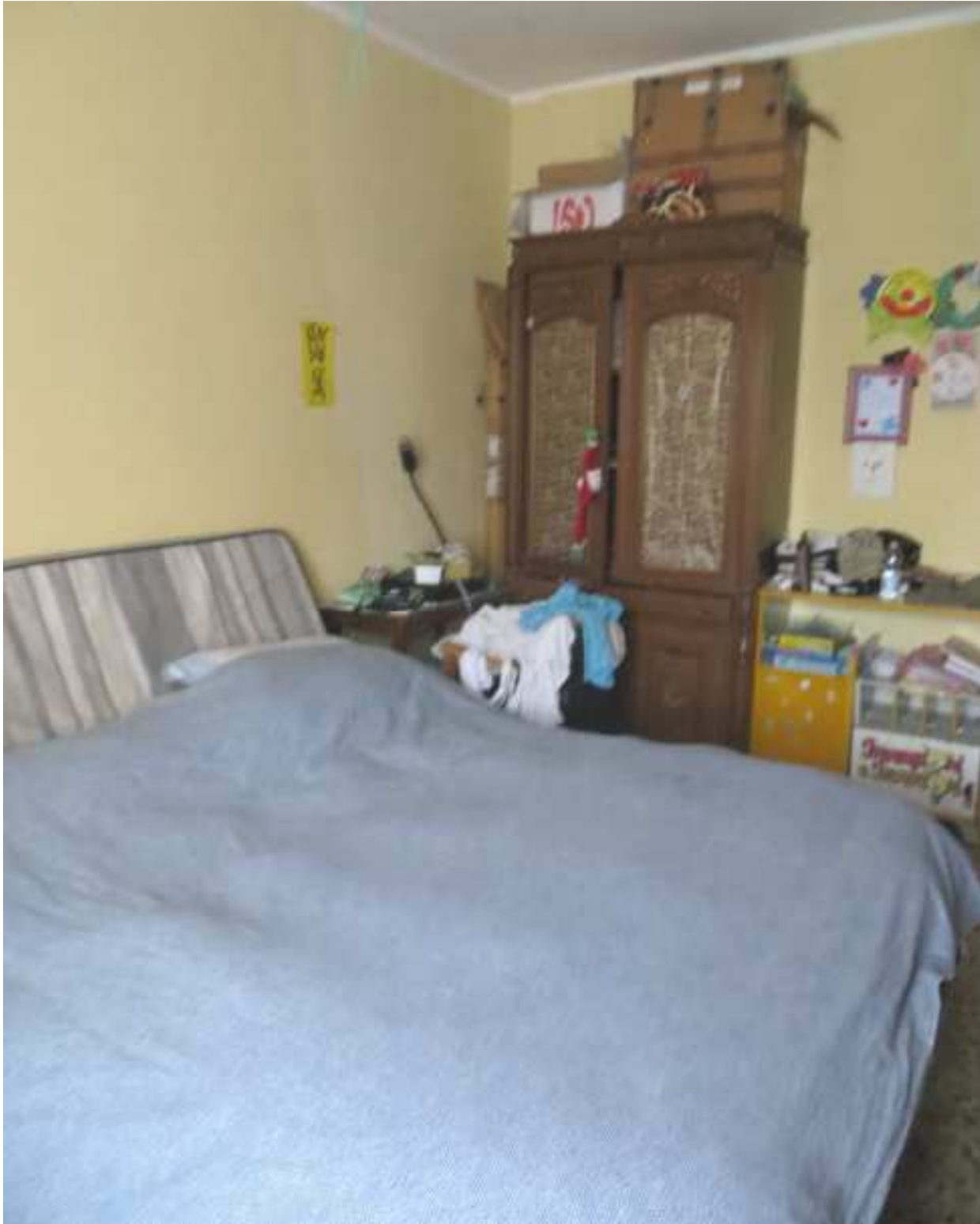
Vista interna della camera in fregio a via Magenta