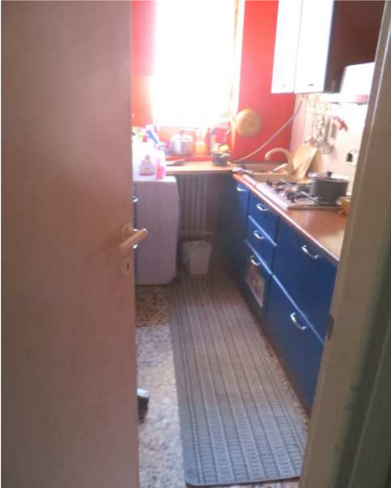
Vista interna del locale cucina