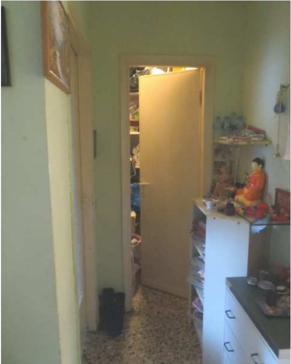
Vista interna del disimpegno