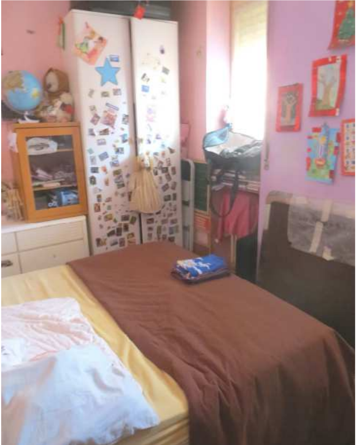
Vista interna della camera lato cortile