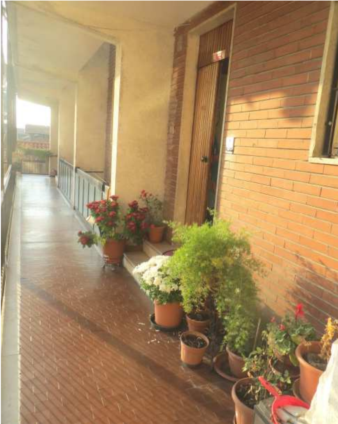
Vista del ballatoio comune antistante l'unità immobiliare