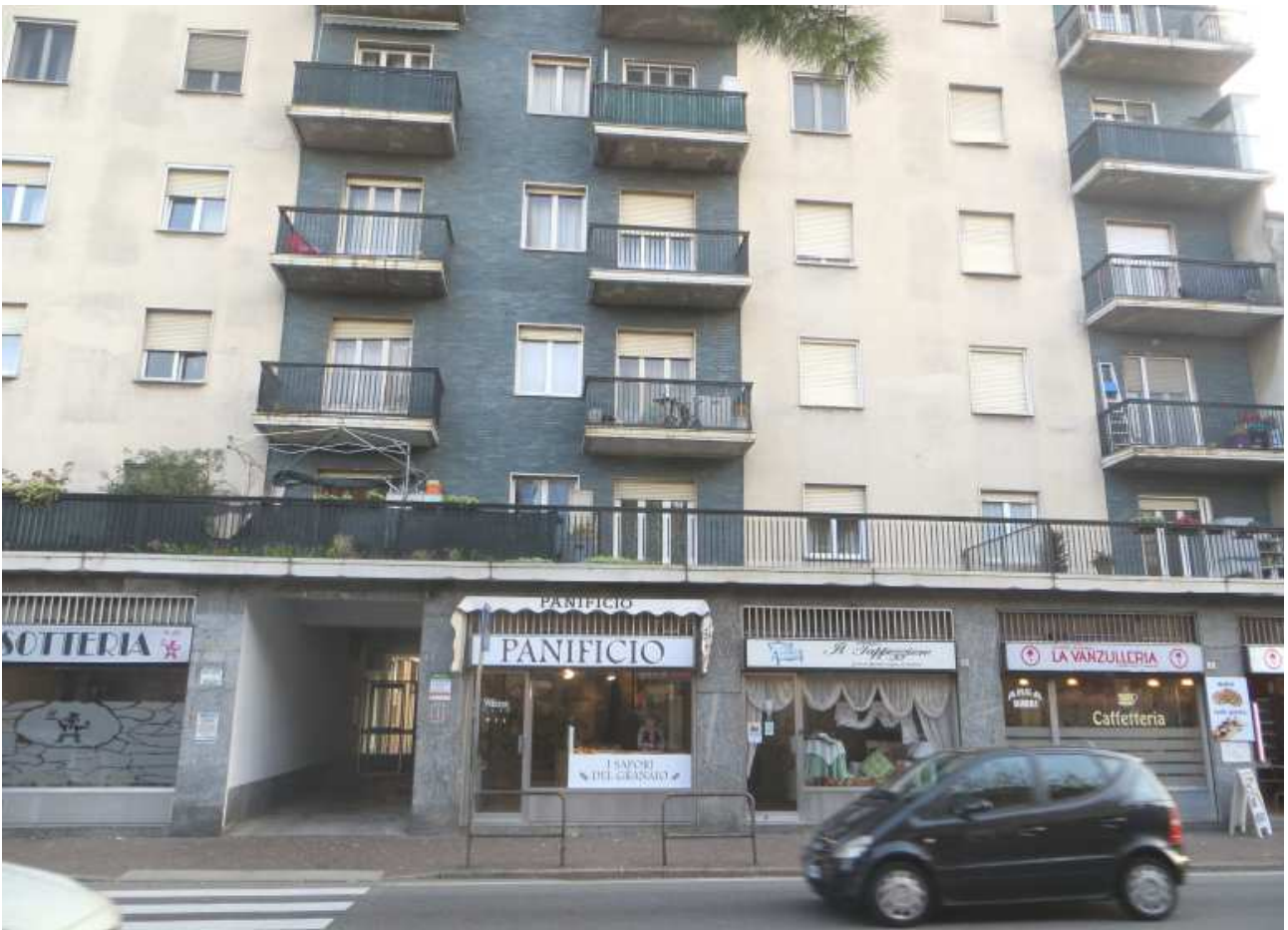
Vista del fabbricato su via Magenta