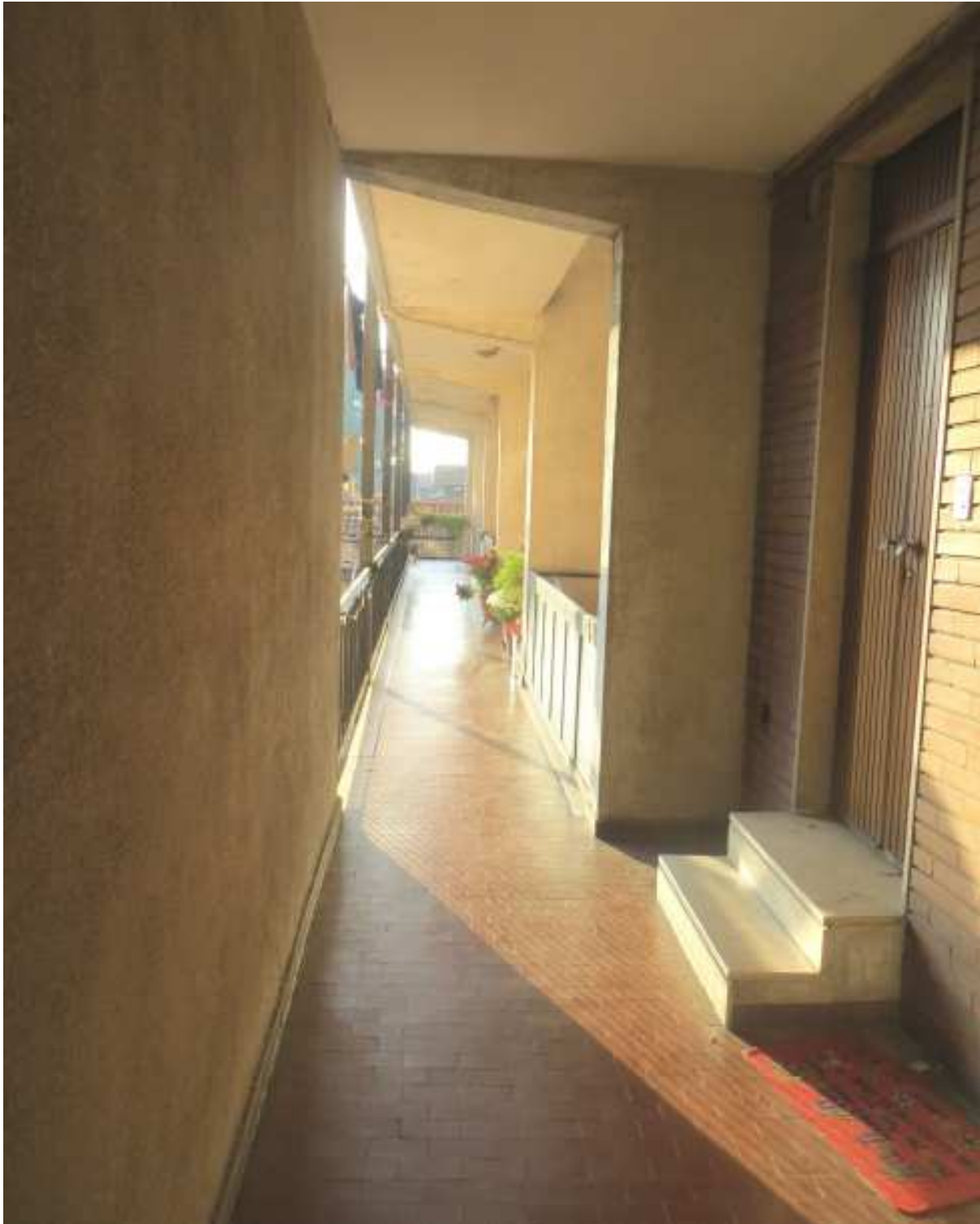
Vista del ballatoio comune di accesso all'unità immobiliare