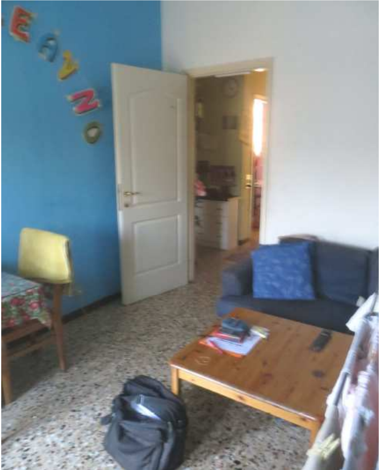
Vista interna del soggiorno