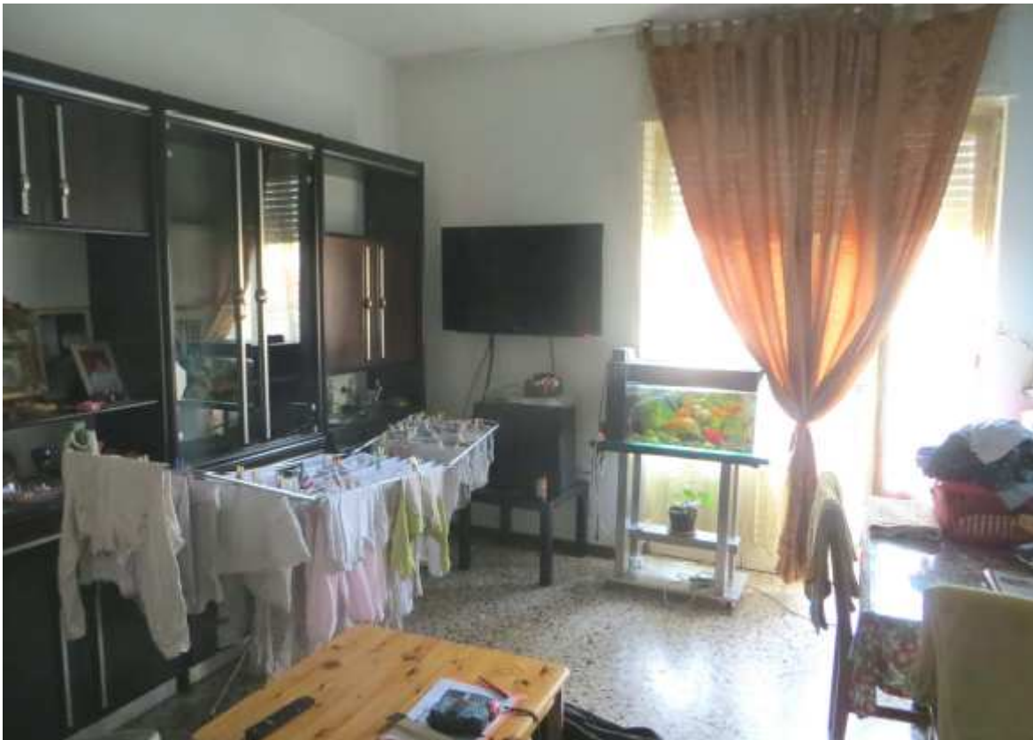
Vista interna del soggiorno