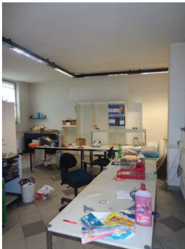
Particolari dello spazio centrale e dei rivestimenti rilevati in buono stato di manutenzione.