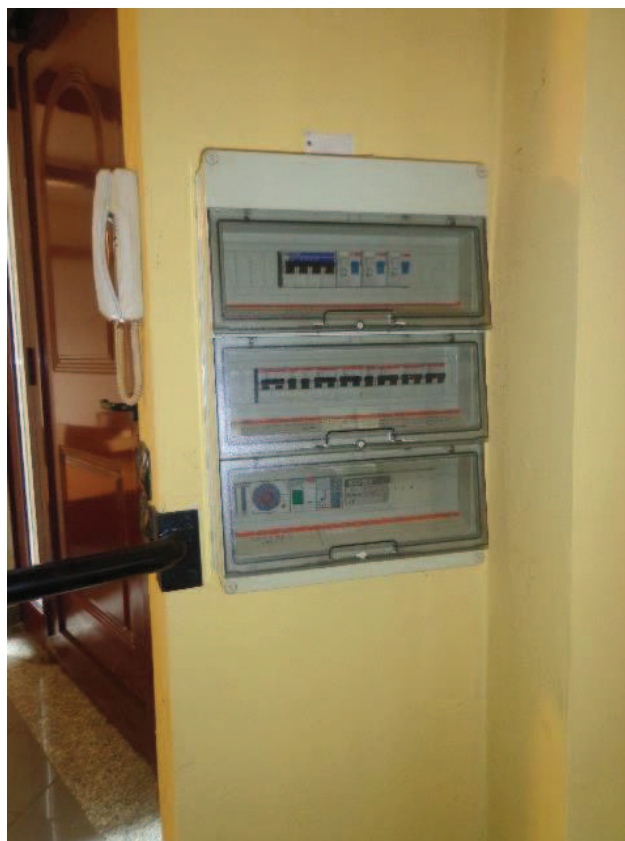
Particolari di alcune tubazioni relative alla caldaia installata all'interno dell'unità immobiliare oggetto di pignoramento; quadro elettrico rilevato all'interno dell'unità immobiliare.