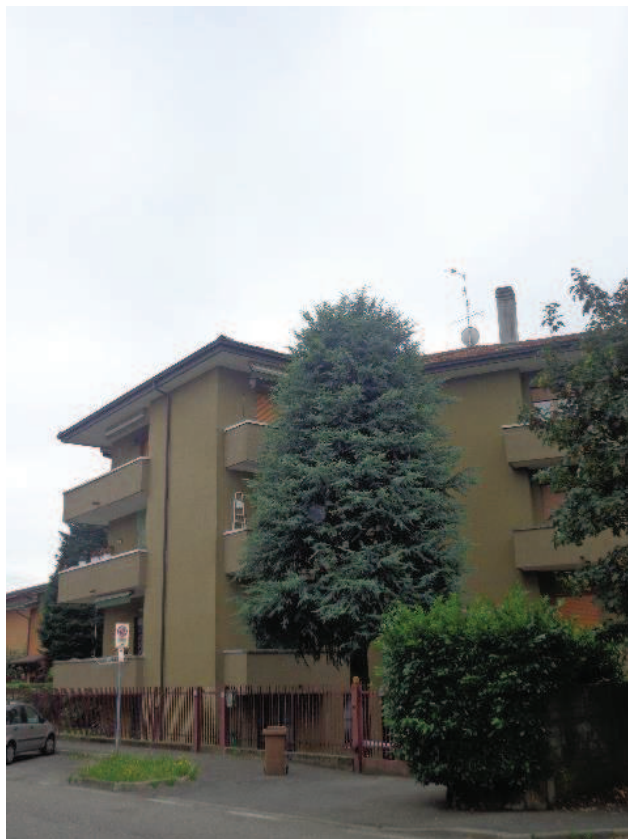
Particolari del “Condominio Sole” di Via Liguria n.11 in Comune di Pogliano Milanese (MI).