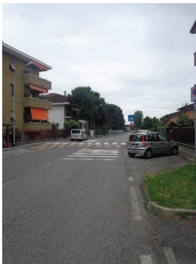
Particolari di via Liguria e dell'insediamento residenziale rilevato in prossimità; presenza di parco giochi nelle vicinanze.