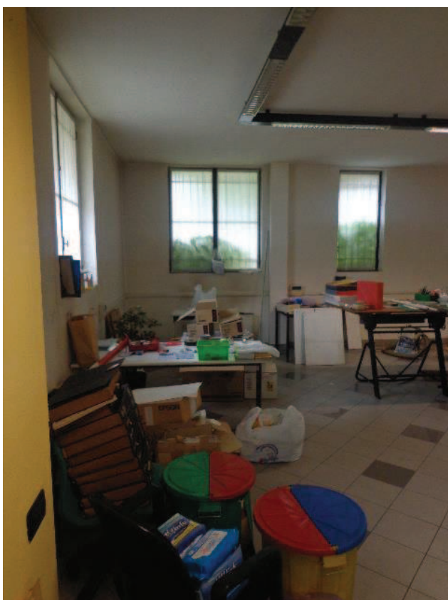
Particolari dei termoconvettori installati nello spazio sul lato nord e nello spazio centrale dell'immobile attualmente occupato da materiale promiscuo; presenza di infissi esterni metallici con vetri semplici.