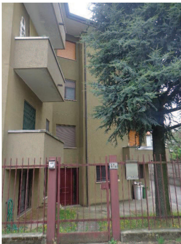
Particolari dell'accesso pedonale e carrabile automatizzato, in struttura metallica, relativi al civico n.11/A dove è identificata l'unità immobiliare oggetto di pignoramento; piano seminterrato .