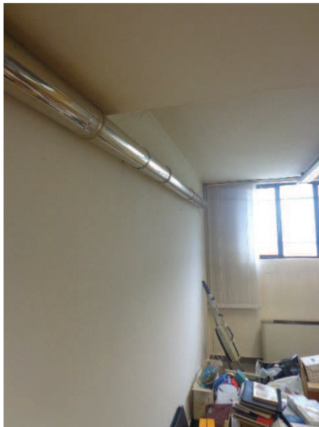
Particolari delle tubature, relative alla caldaia autonoma, passanti all'interno della ex canna fumaria condominiale; installazione di termoconvettori relativi all'impianto di riscaldamento a gas metano.