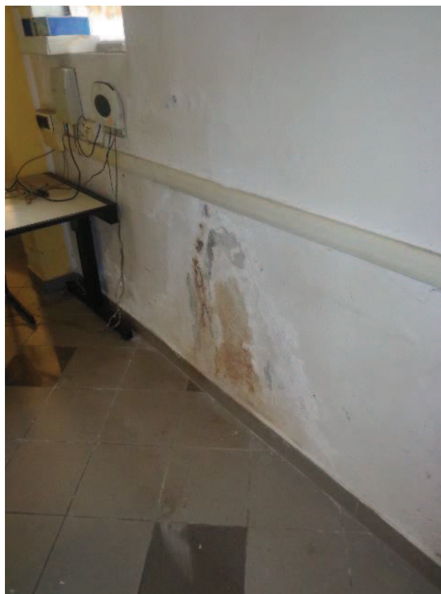
Particolari del secondo termoconvettore installato e di alcune infiltrazioni d'acqua, con esfoliazioni d'intonaco e macchie di muffa, rilevate sulla parete lato sud / est; pavimentazioni e battiscopa in monocottura.