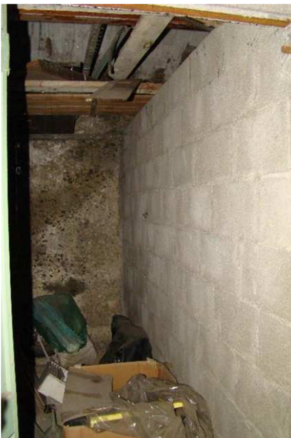
19. Vista della cantina.