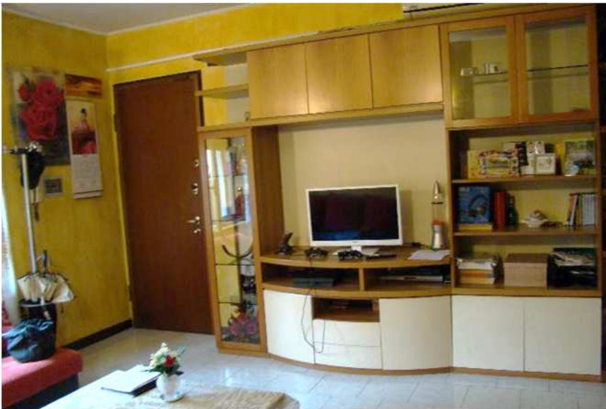
4. Vista dell'ingresso.