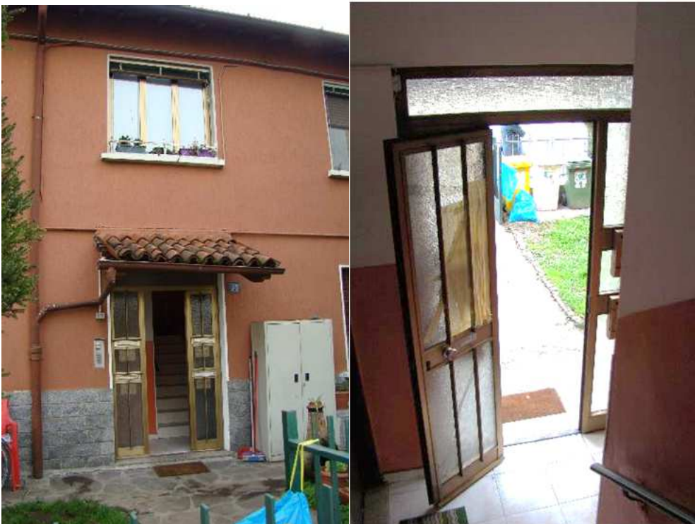
2. Dettaglio del portone di accesso alla scala di pertinenza, dall'esterno e dall'interno.