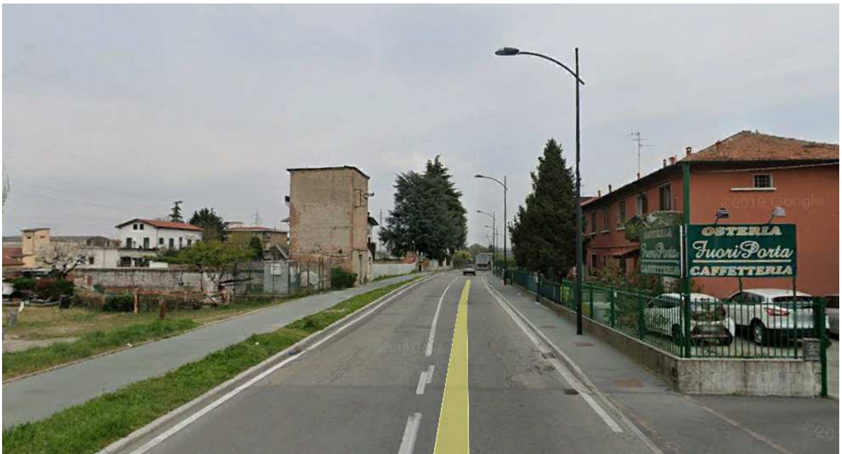
4. Rilievo fotografico del contesto.