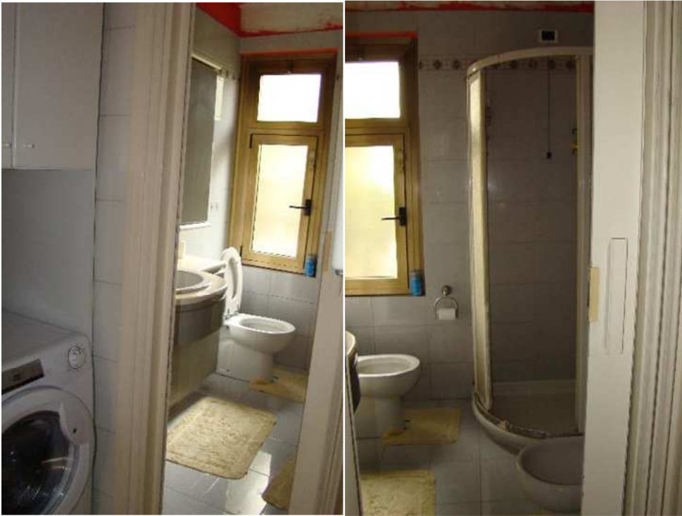
9. Viste del bagno.