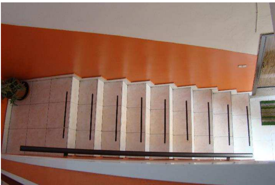
16. Dettaglio delle scale condominiali.