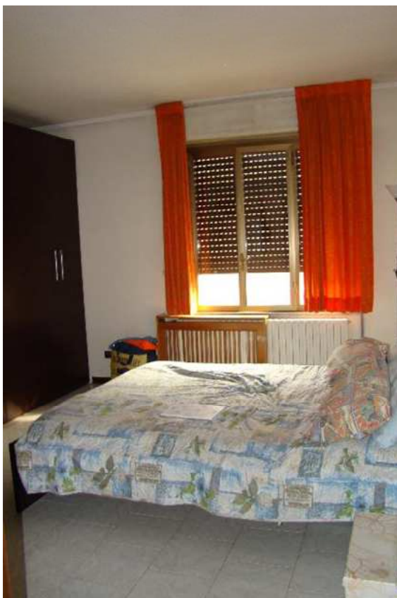
11. Vista di una camera.