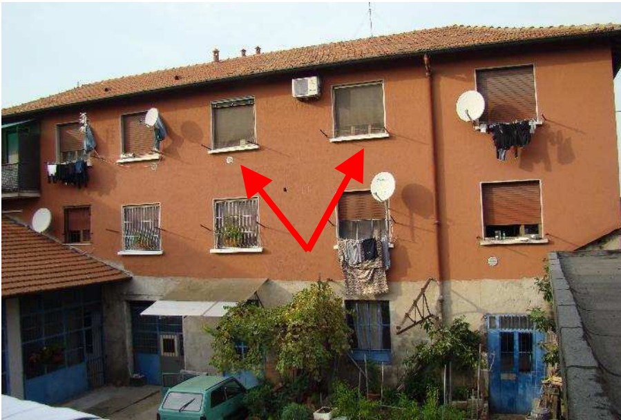
23. Vista del prospetto interno e individuazione degli affacci.