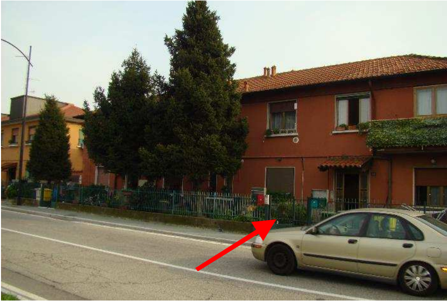
1. Vista del fronte strada e indicazione dell'ingresso pedonale di accesso.