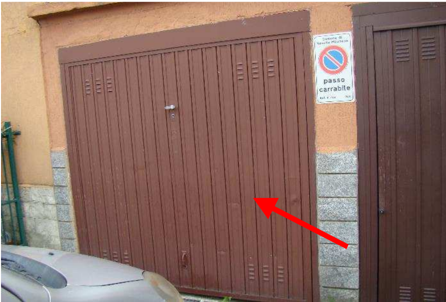
21. Individuazione del box.