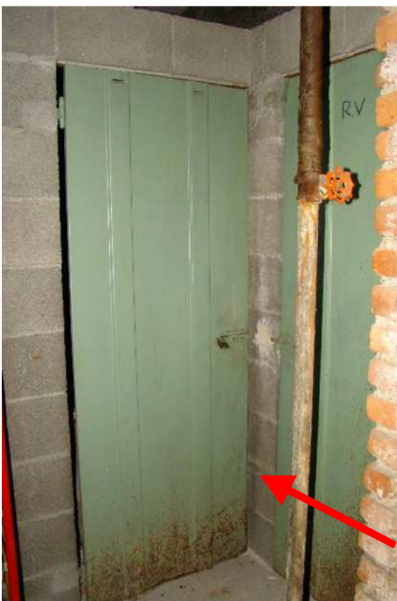
18. Individuazione della cantina.