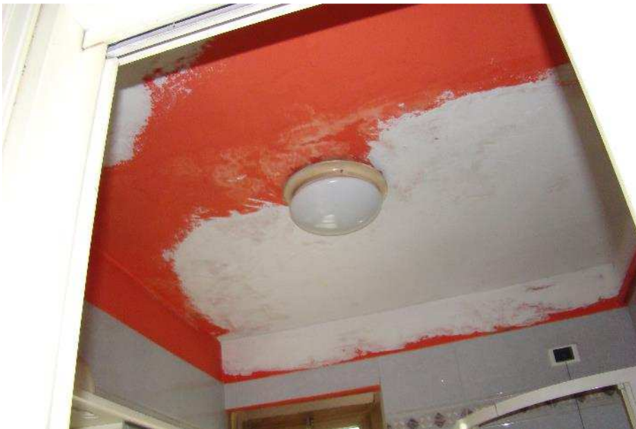
10. Dettaglio del plafone del disimpegno.