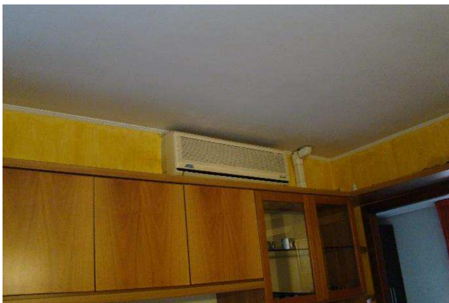
13. Dettaglio dell'impianto di aria condizionata.