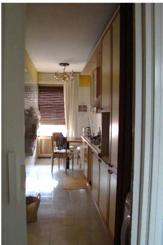
6. Vista della cucina.