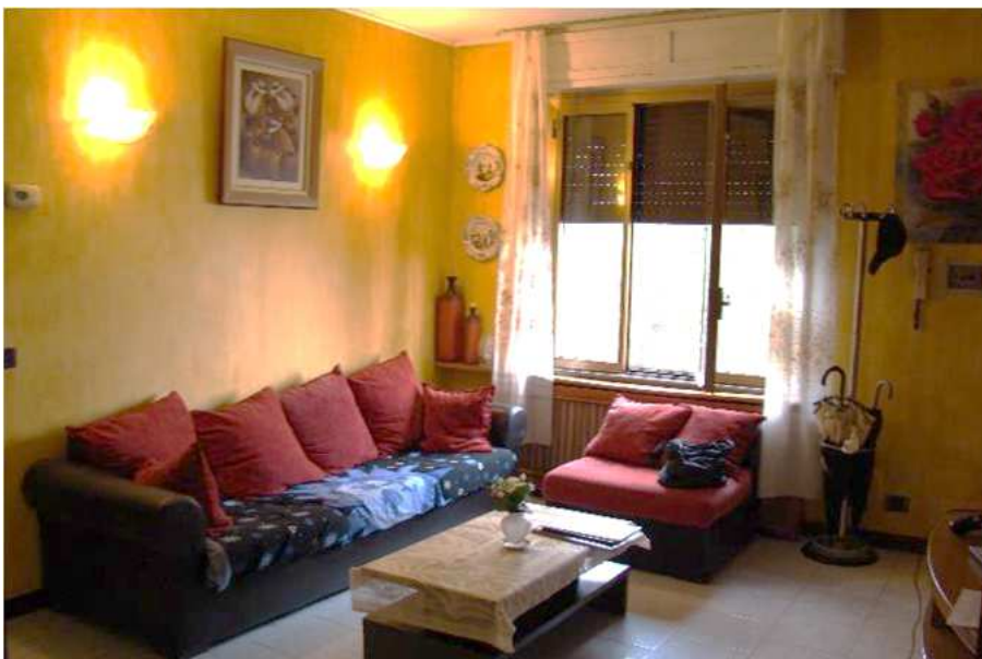
5. Vista del soggiorno.