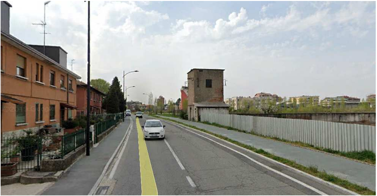
5. Rilievo fotografico del contesto.