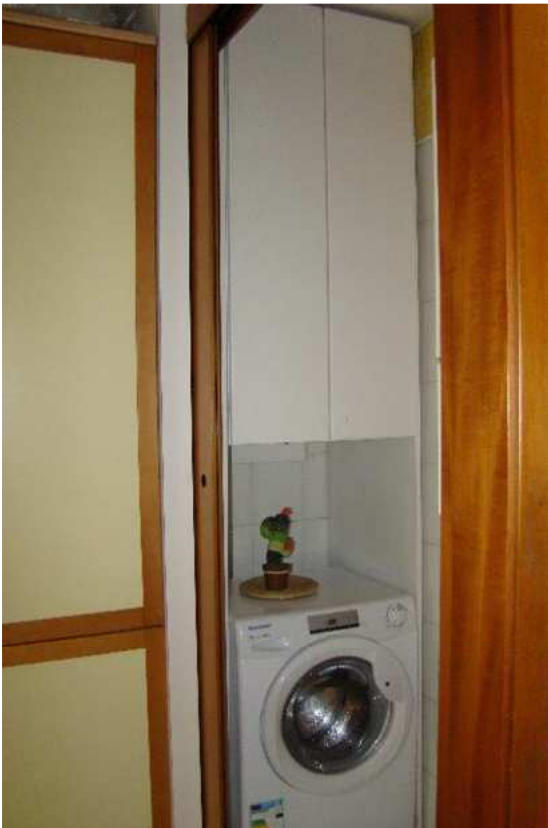
8. Vista del disimpegno.