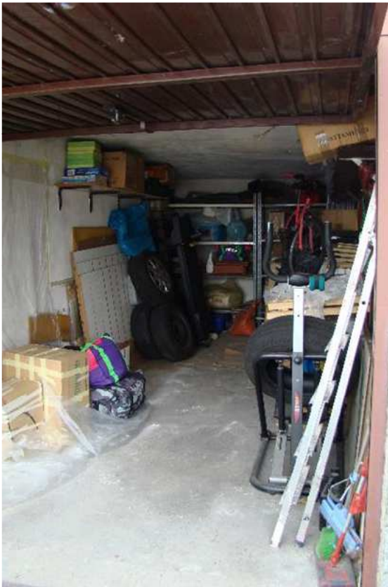
22. Vista del box.