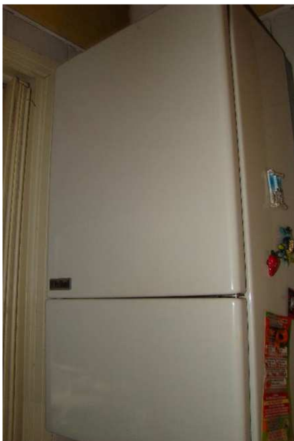
14. Dettaglio della caldaia.