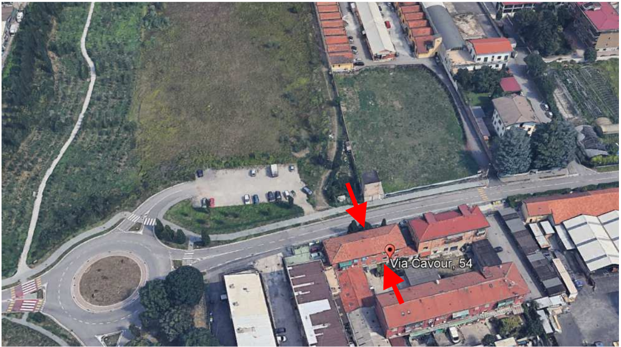
3. Rilievo fotografico del contesto. Vista aerea dell'edificio con indicazione degli affacci dell'immobile.