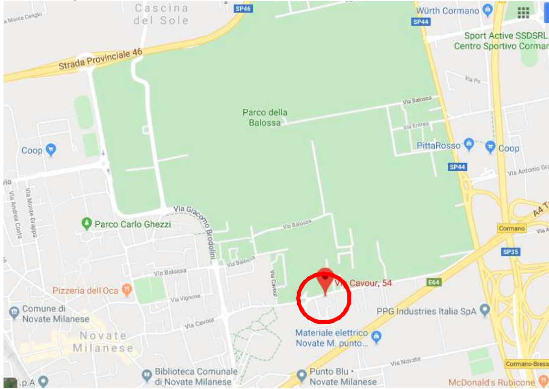
1. Vista aerea del contesto.