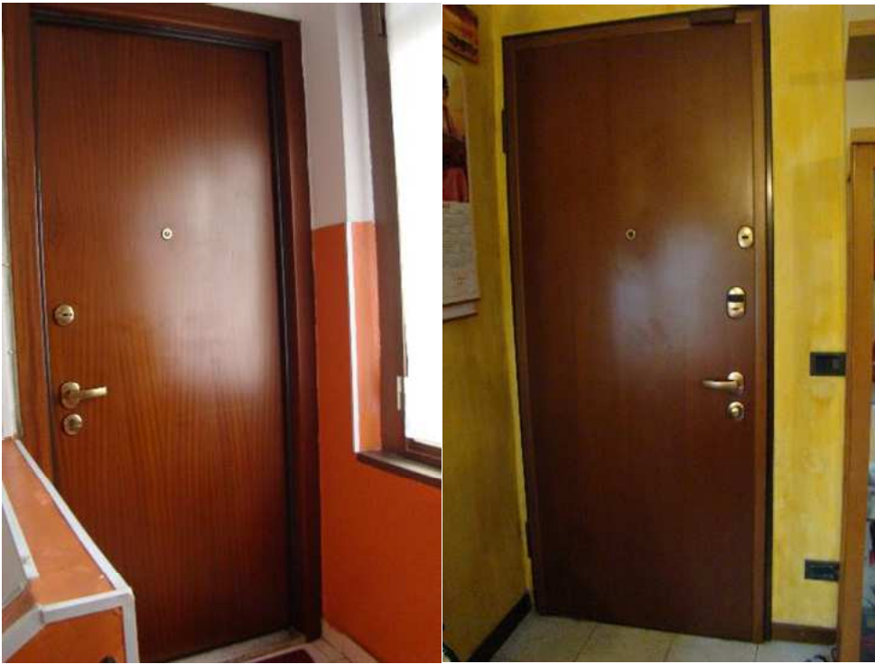
3. Dettaglio della porta di accesso all'alloggio, dal pianerottolo e dall'interno.