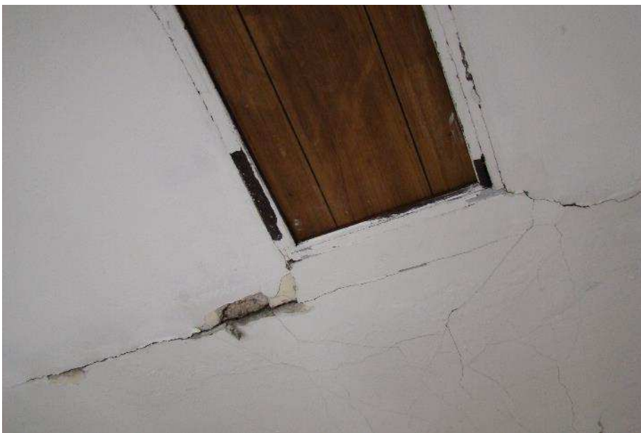
15. Dettaglio della botola di accesso al sottotetto, in corrispondenza del pianerottolo comune.