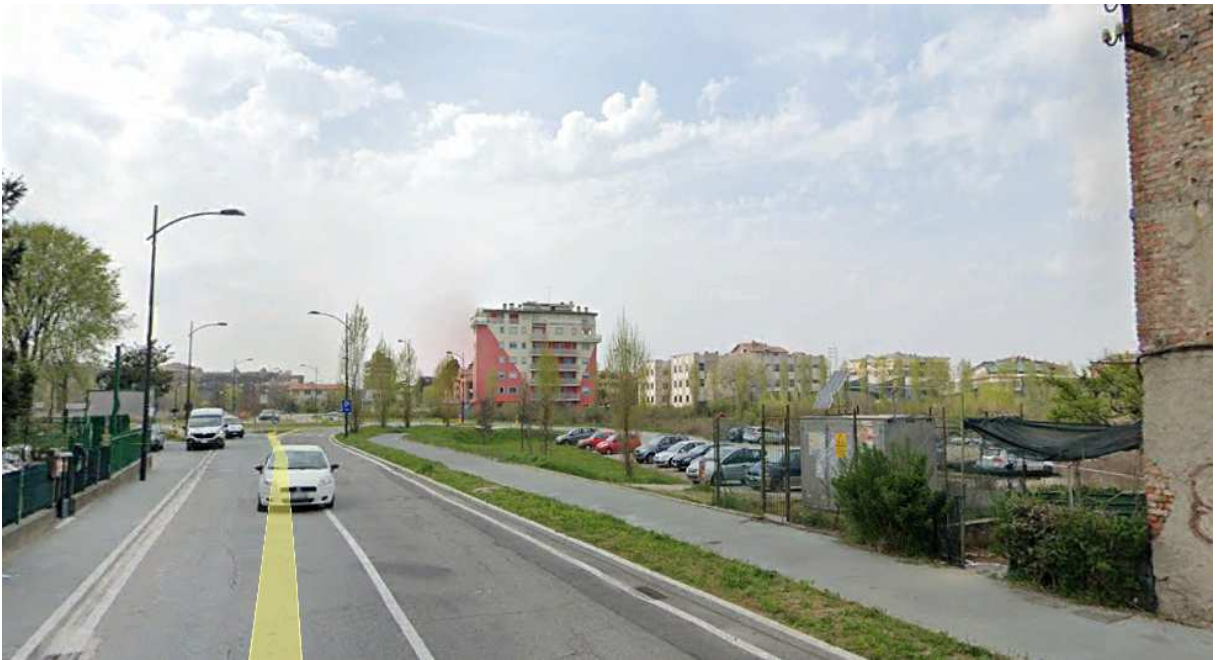
6. Rilievo fotografico del contesto.