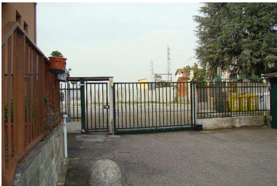
20. Vista dell'entrata del civico n.62, da cui si accede alla cantina.