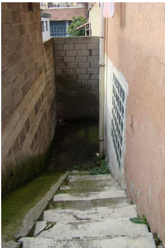
17. Vista della discesa per l'accesso alle cantine.