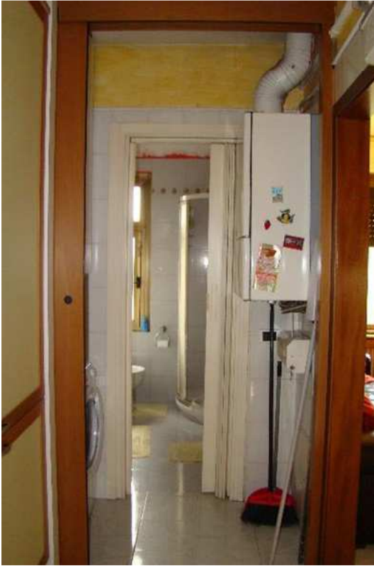
7. Vista del disimpegno verso il bagno.