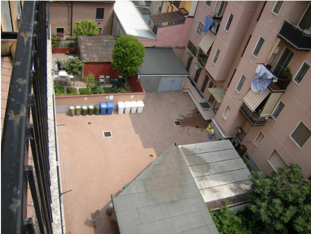
Foto 5 – Il cortile interno visto dall'alto. Sulla destra l'edificio B (via Caravaggio).