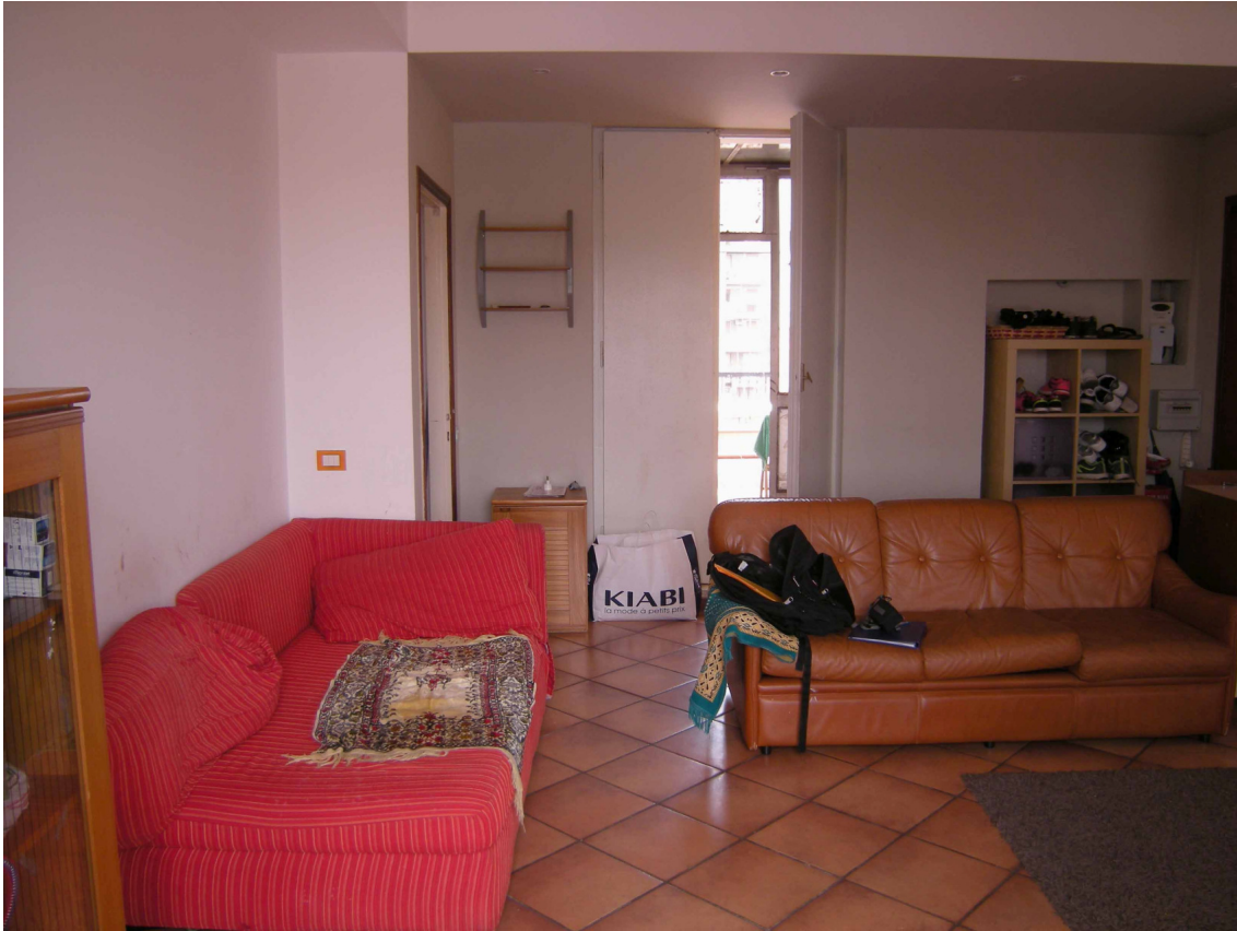
Foto 9 – Altra vista parziale del soggiorno. Sullo sfondo la veranda.