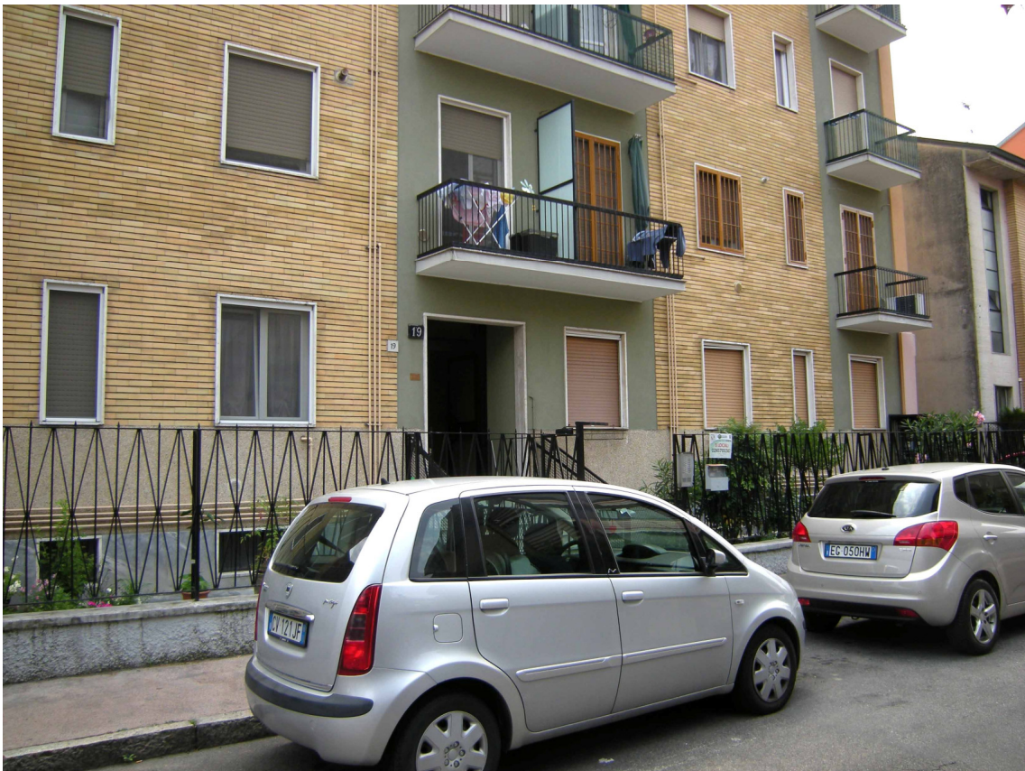
Foto 4 – Vista parziale del prospetto principale con il portone di accesso al fabbricato.