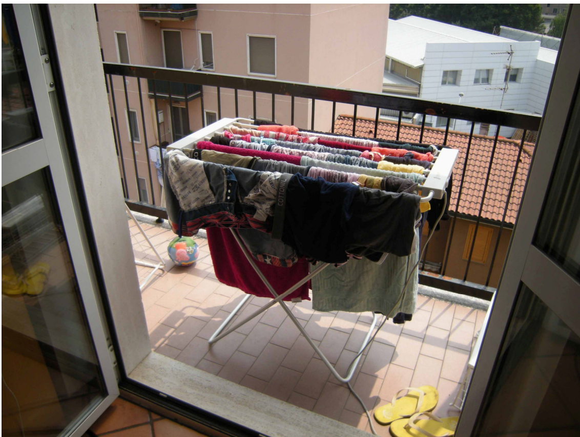
Foto 16 – Il balcone con accesso dal soggiorno e dalla cucina ed affaccio sul cortile.