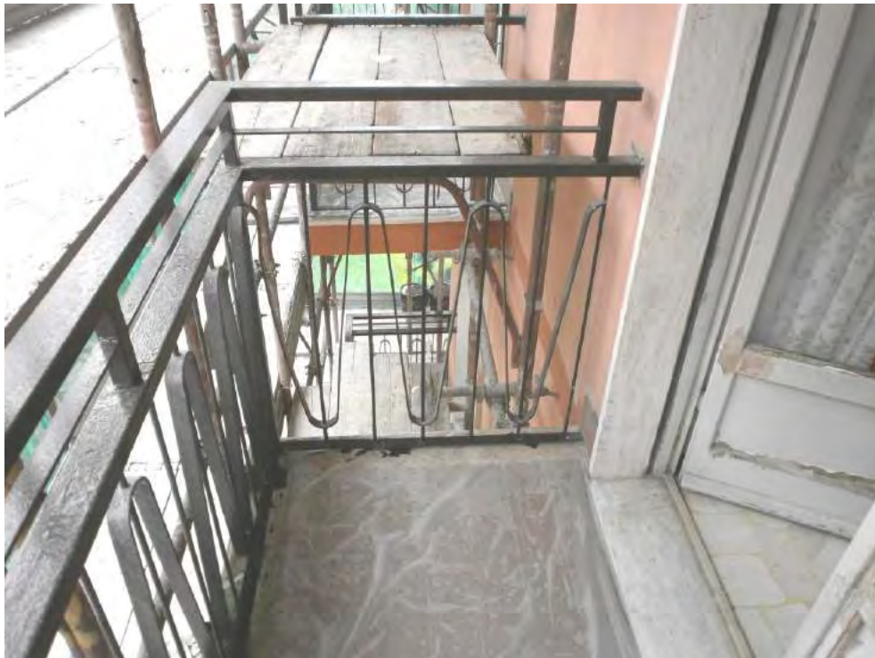
- FOTO 14 - BALCONE -