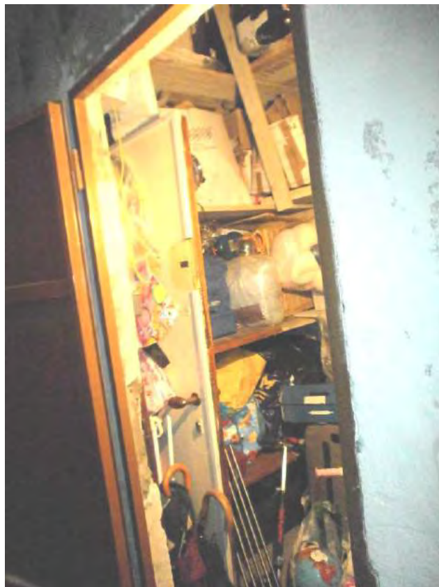
- FOTO 15 - PORTA D'INGRESSO DELLA CANTINA -