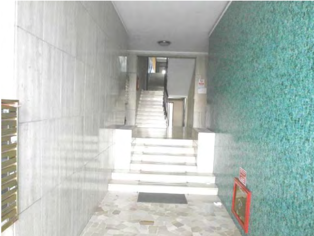
- FOTO 3 - ANDRONE DI INGRESSO -