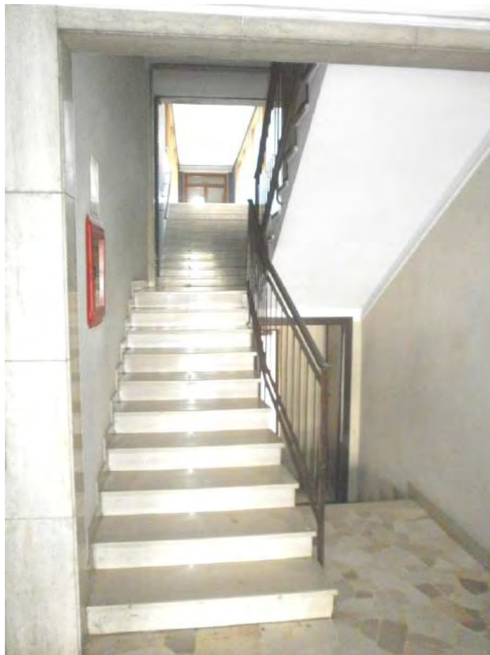
- FOTO 4 - SCALE CONDOMINIALI -