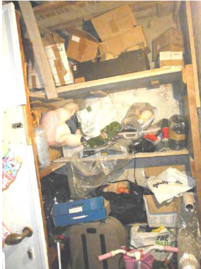
- FOTO 16 - CANTINA -