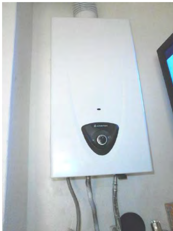
- FOTO 10 - PARTICOLARE SCALDABAGNO -