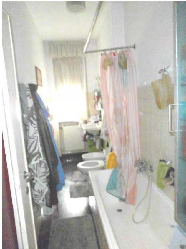
- FOTO 11 - BAGNO -