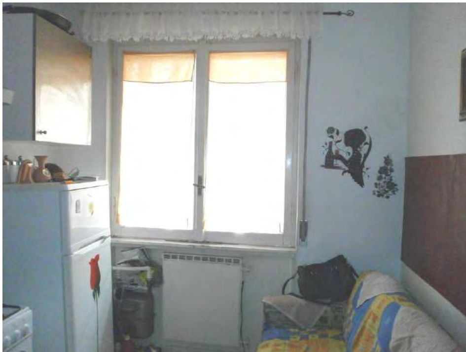
- FOTO 8 - CUCINA -