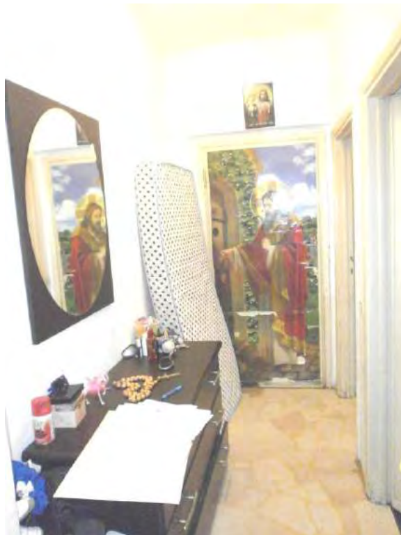
- FOTO 6 - DISIMPEGNO -