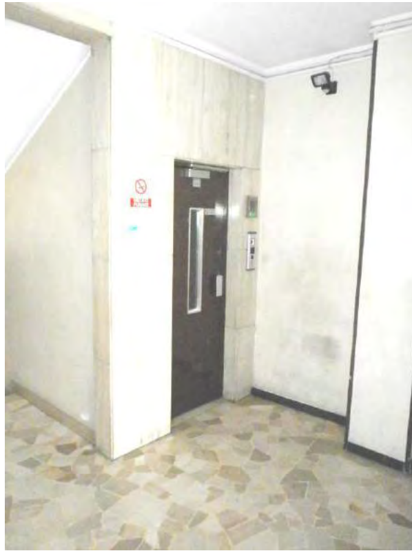
- FOTO 5 - ASCENSORE -