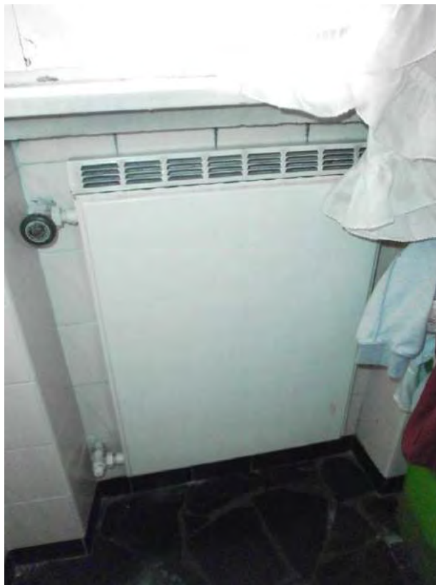
- FOTO 12 - PARTICOLARE TERMOSIFONI IN ALLUMINIO -