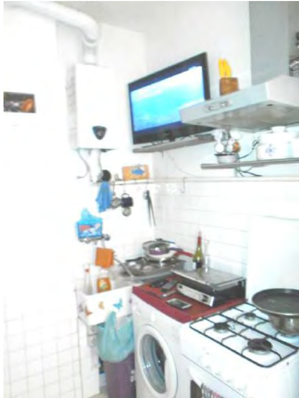
- FOTO 9 - CUCINA -