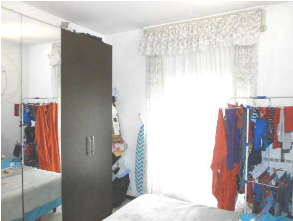
- FOTO 13 - CAMERA -