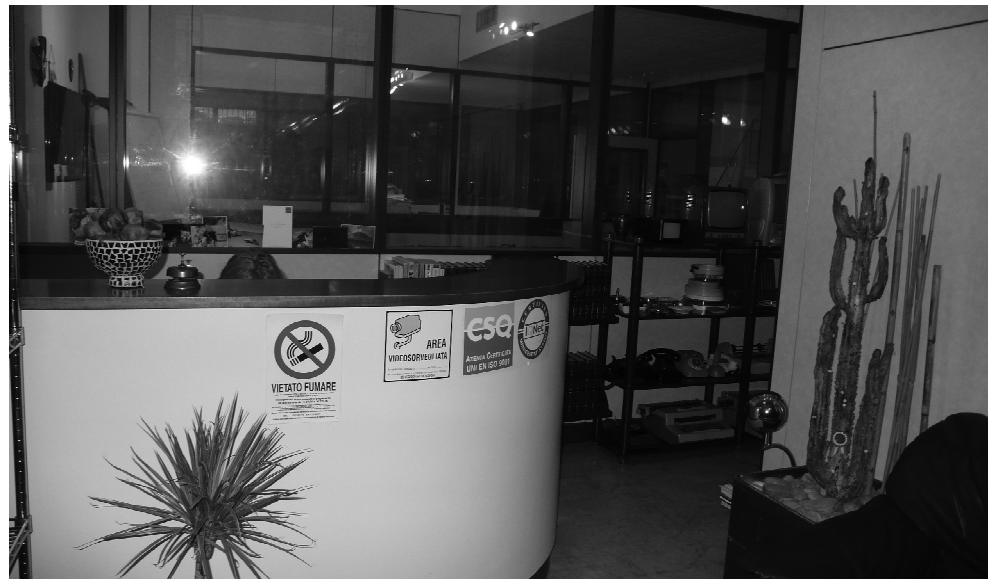
Vista 6 - RECEPTION