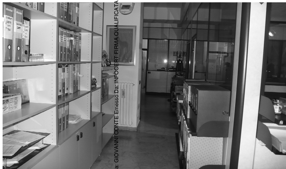
Vista 8 - INTERNO 2

Fornito Da: GIOVANNI CONTE Emesso Da: INFOCERT FIRMA QUALIFICATA Serial#: 01165d