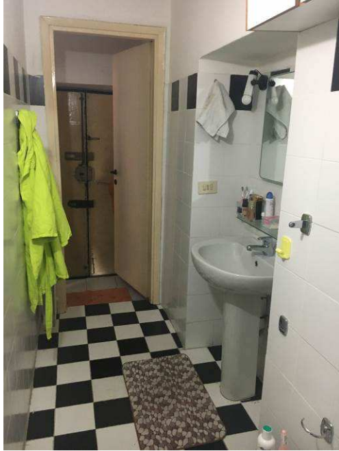
Foto 14 - bagno