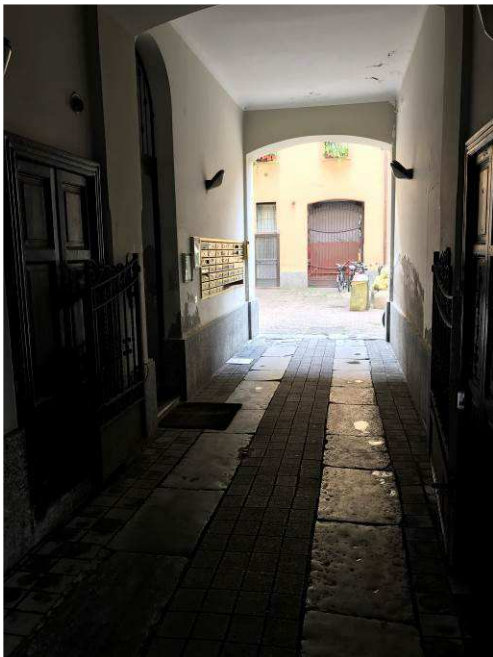
Foto 2 - androne di ingresso