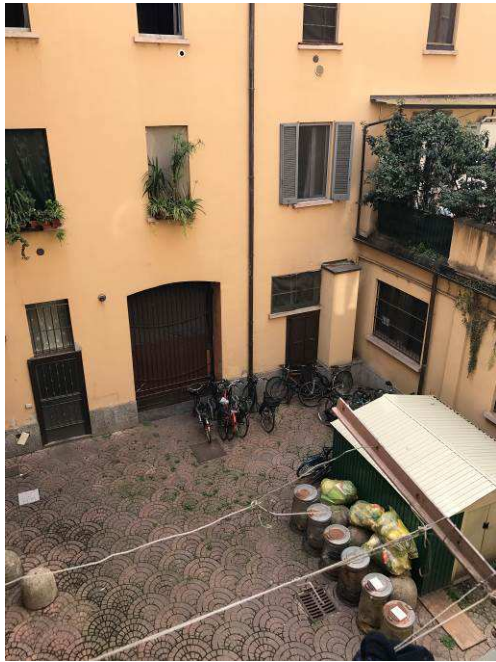
Foto 6 - facciata su corte comune