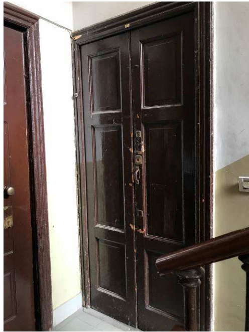
Foto 8 - ingresso appartamento