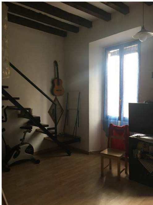
Foto 11 - scaletta interna per ripostiglio