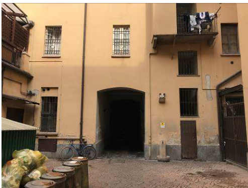
Foto 3 - corte interna comune