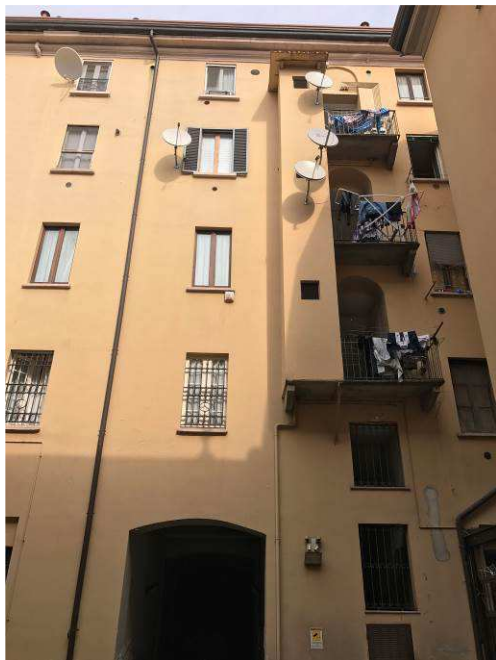
Foto 7 - facciata su corte comune