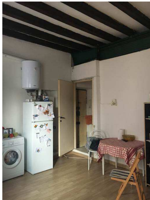
Foto 9 - ingresso visto dal soggiorno