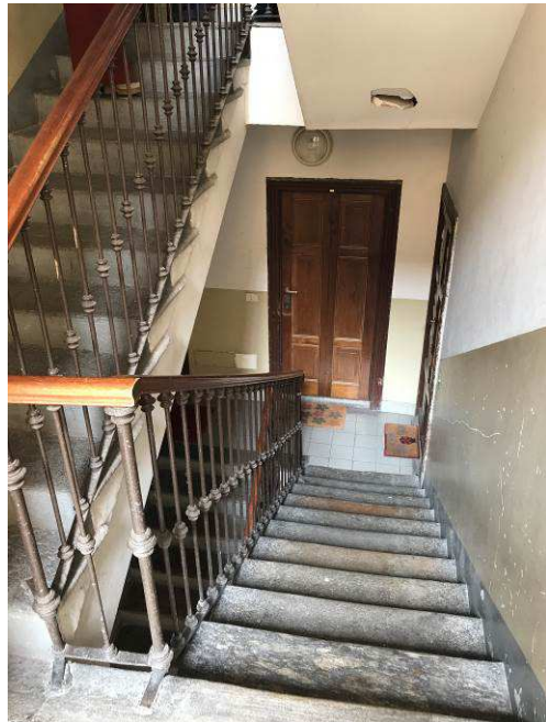
Foto 5 - vano scala comune