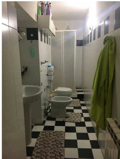
Foto 13 - bagno