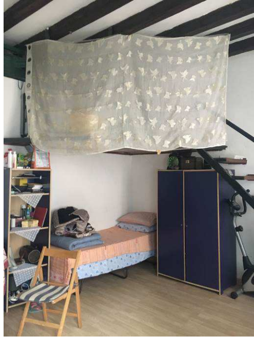
Foto 12 - zona notte