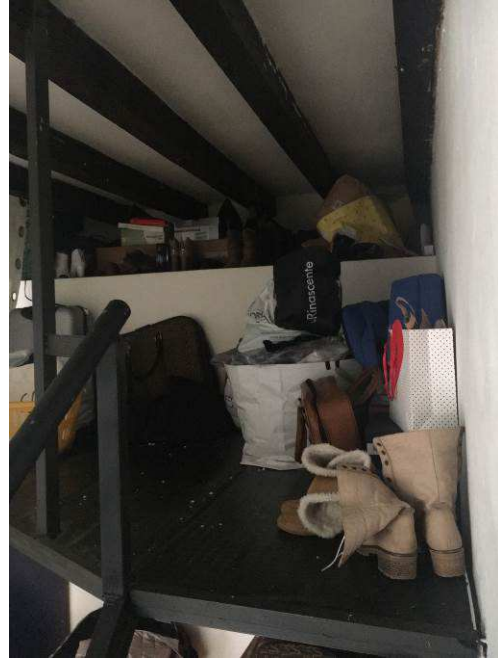
Foto 15 - ripostiglio in quota