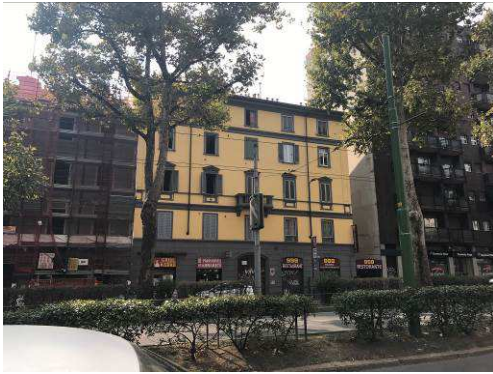
Foto 1 - immobile vile Tibaldi n. 8