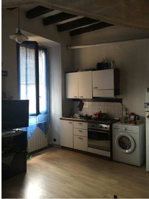
Foto 10 - angolo cottura