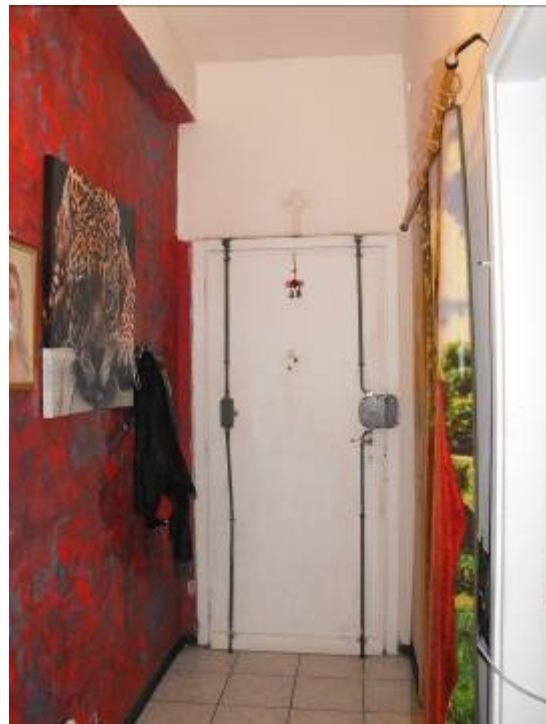
porta di primo accesso interna