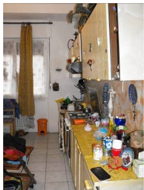
soggiorno con cucina abitabile