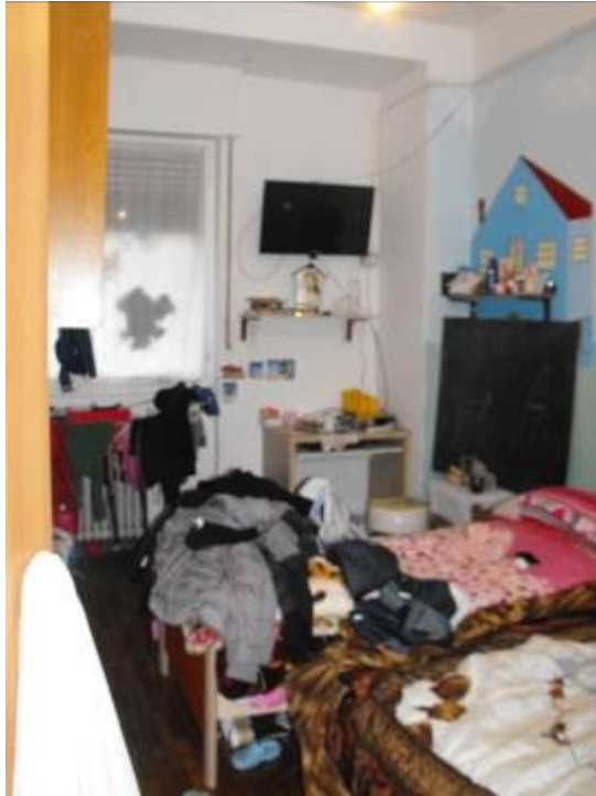
camera da letto