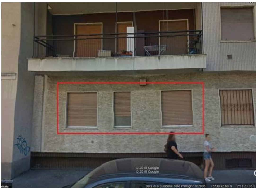
Vista su fronte strada