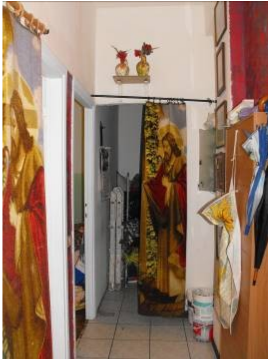
corridoio con sgabuzzino