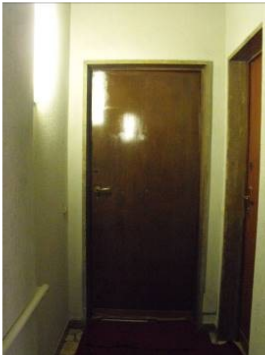
porta di primo accesso esterna