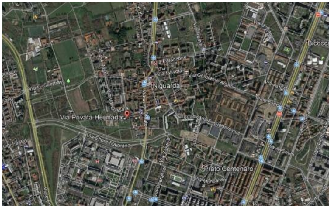
vista aereofotogrammetrica del bene