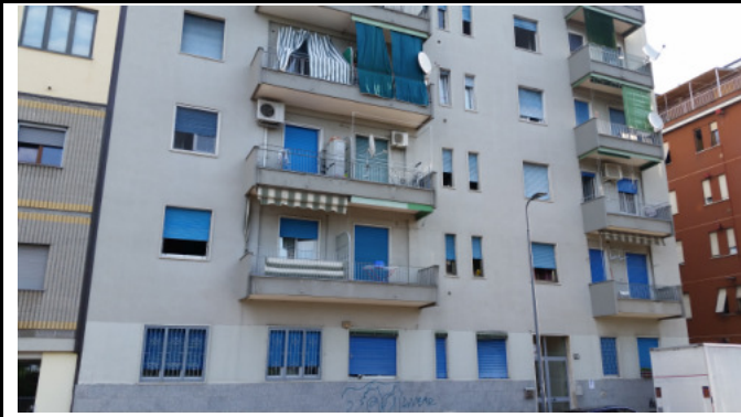
Immobilie di via Nuoro, 39 (MI) - lato strada