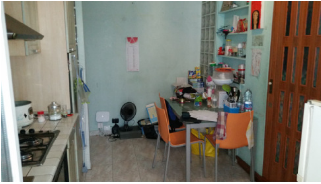
Appartamento oggetto di pignoramento -soggiorno cucina altra foto