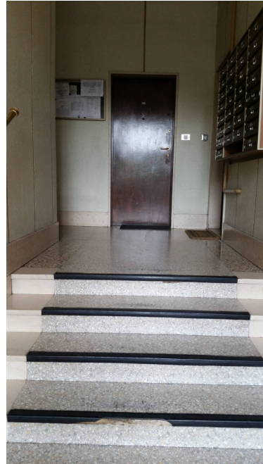
Immobilie di via Nuoro, 39 (MI) - atrio ingresso allo stabile