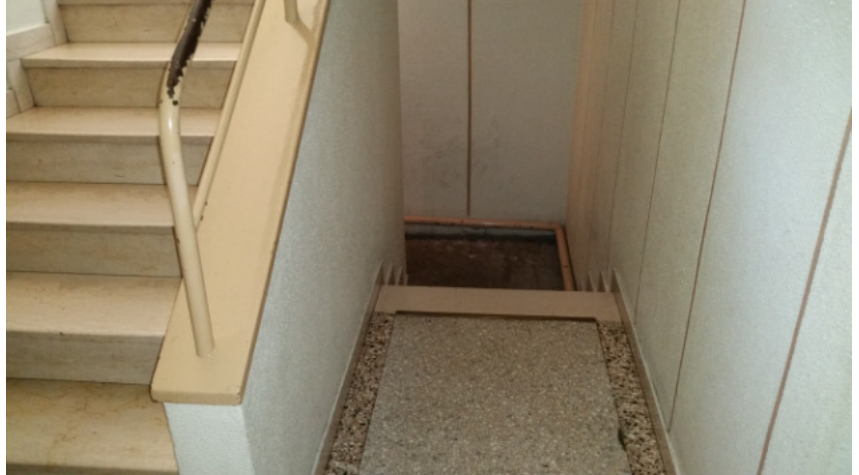
Appartamento oggetto di pignoramento -scale di accesso alla cantina