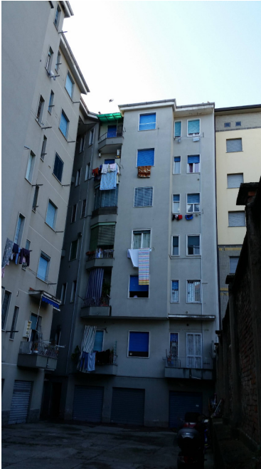
Immobilie di via Nuoro, 39 (MI) - cortile interno e prospetto lato via privata Iglesias