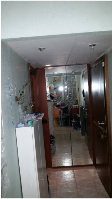
Appartamento oggetto di pignoramento - ingresso