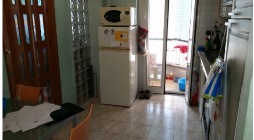
Appartamento oggetto di pignoramento - soggiorno cucina