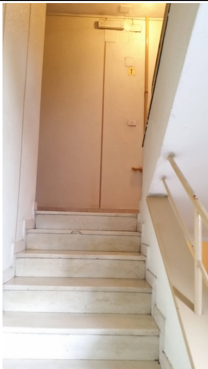
Immobilie di via Nuoro, 39 (MI) - scala interna