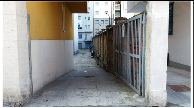
Immobilie di via Nuoro, 39 (MI) - ingresso cortile interno lato via privata Iglesias