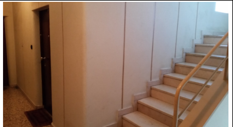
Immobilie di via Nuoro, 39 (MI) - scala interna e porta di accesso all'appartamento pignorato