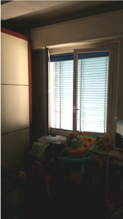
Appartamento oggetto di pignoramento - camera