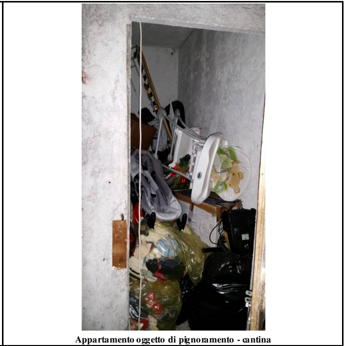
Appartamento oggetto di pignoramento - cantina