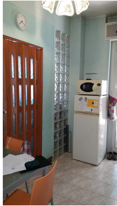
Appartamento oggetto di pignoramento -soggiorno cucina porta di accesso alla camera