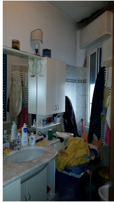
Appartamento oggetto di pignoramento - bagno