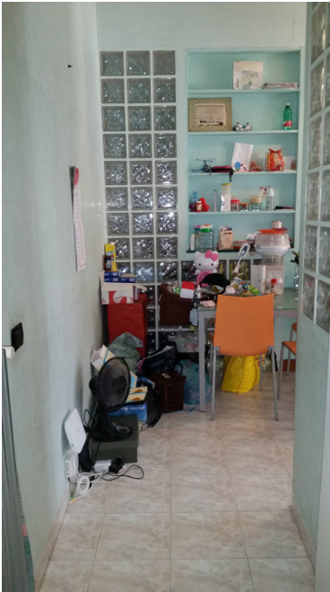
Appartamento oggetto di pignoramento - ingresso al soggiorno-cucina