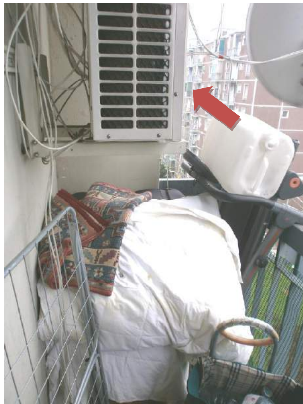
- FOTO 12 - BALCONE - IN EVIDENZA L'UNITA' ESTERNA DEL CLIMATIZZATORE -