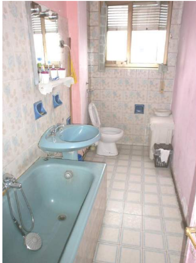
- FOTO 21 - BAGNO -