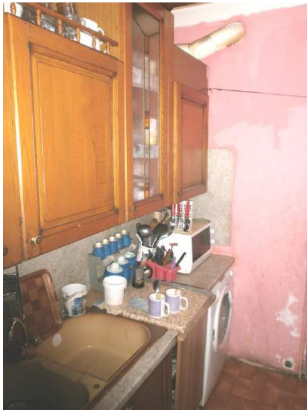
- FOTO 14 - CUCINA -