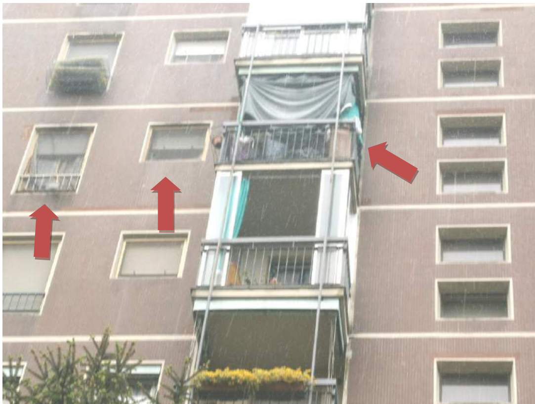
- FOTO 2 - FACCIATA NORD-EST - DETTAGLIO DEL BALCONE E DELLE FINESTRE DELL'APPARTAMENTO -