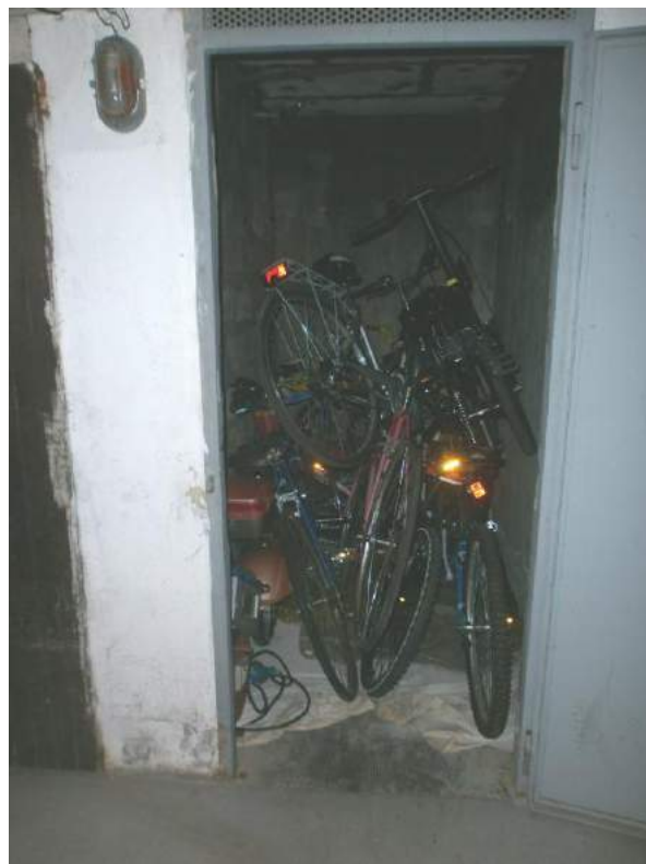
- FOTO 25 - CANTINA -