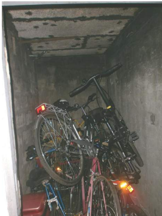
- FOTO 26 - INTERNO DELLA CANTINA -