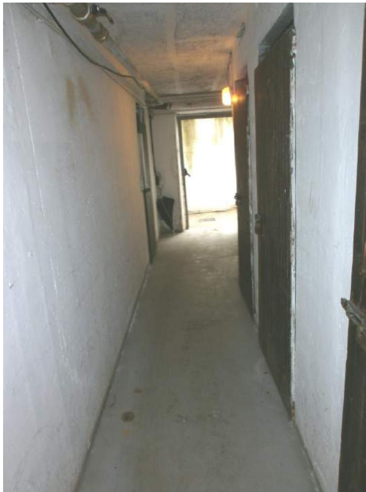
- FOTO 23 - CORRIDOIO COMUNE -