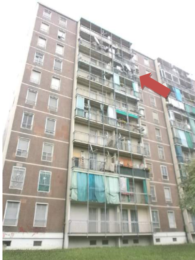
- FOTO 3 - FACCIATA SUD-OVEST - IN EVIDENZA IL BALCONE DELL'APPARTAMENTO -