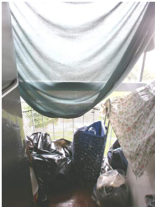
- FOTO 15 - BALCONE -