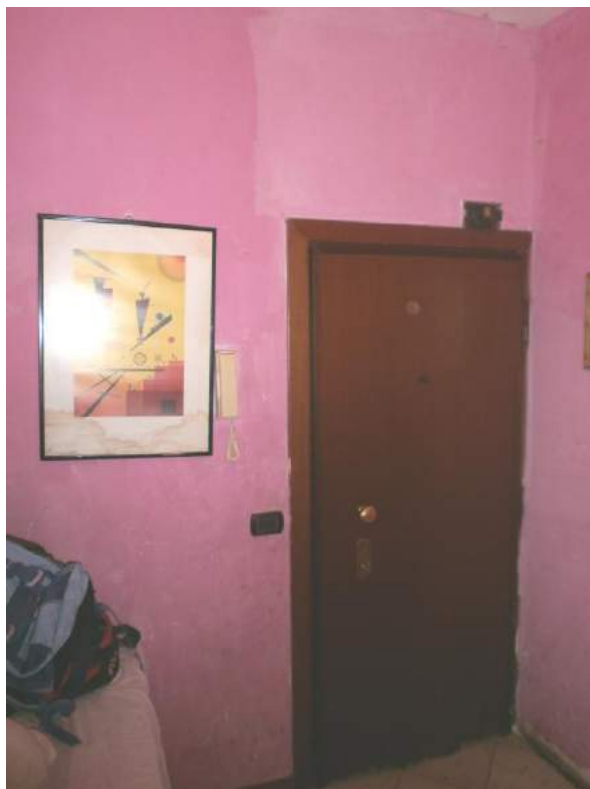
- FOTO 9 - INGRESSO -