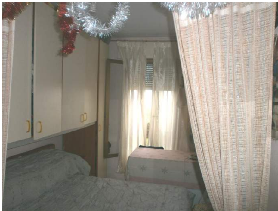
- FOTO 18 - CAMERA -