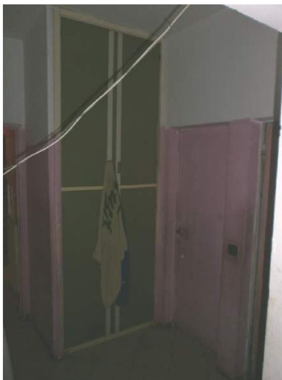
- FOTO 16 - DISIMPEGNO -