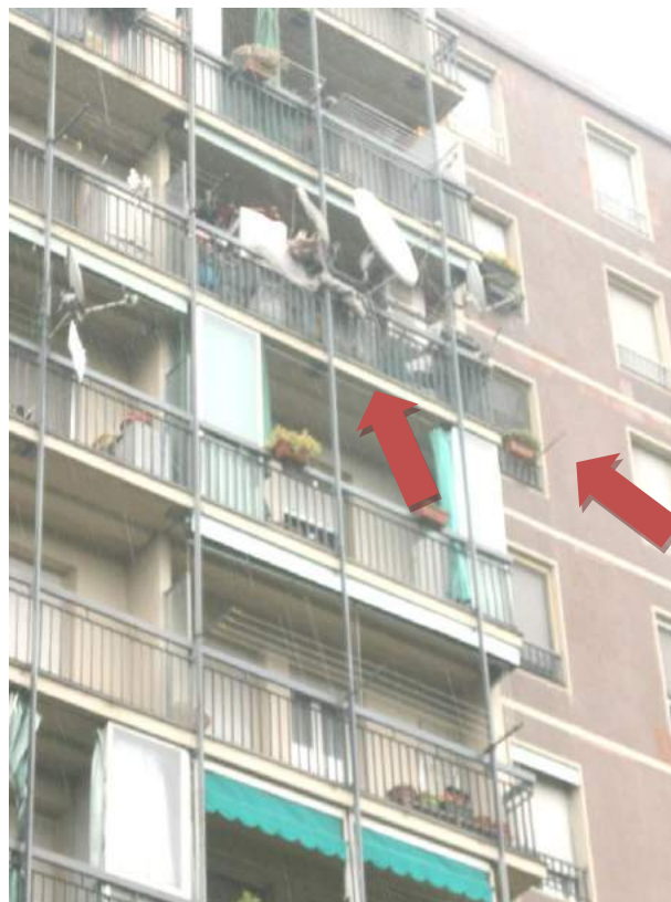
- FOTO 4 - FACCIATA SUD-OVEST - DETTAGLIO DEL BALCONE E DELLE FINESTRE DELL'APPARTAMENTO