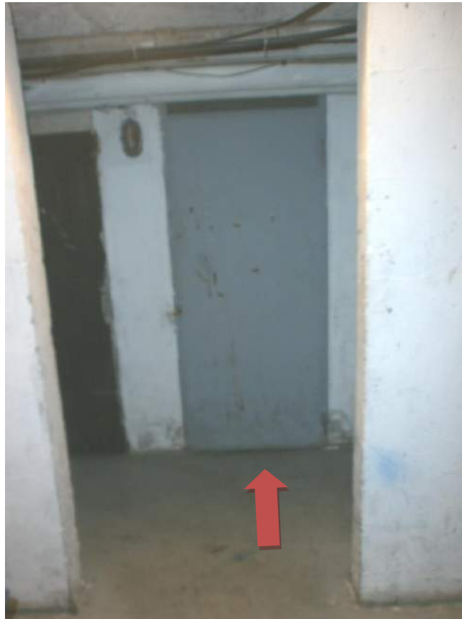
- FOTO 24 - CORRIDOIO COMUNE - IN EVIDENZA LA PORTA DELLA CANTINA -