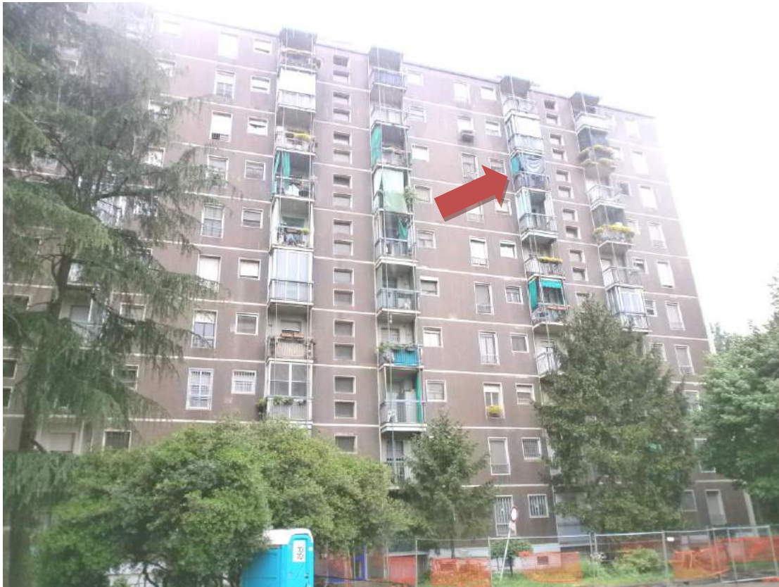
- FOTO 1 - FACCIATA NORD-EST - IN EVIDENZA IL BALCONE DELL'APPARTAMENTO -