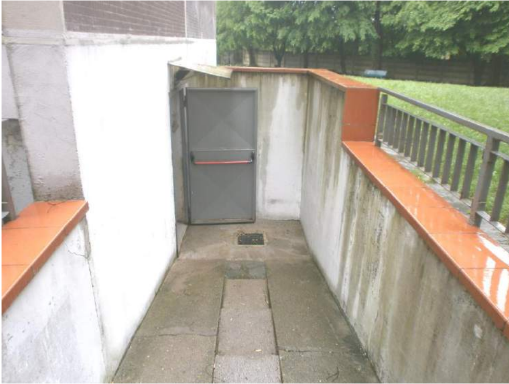
- FOTO 22 - ACCESSO AL PIANO INTERRATO ADIBITO A CANTINE -