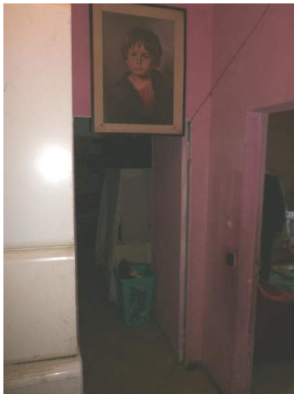
- FOTO 10 - SOGGIORNO -