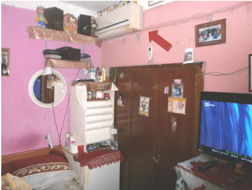
– FOTO 19 – CAMERA MATRIMONIALE – IN EVIDENZA LO SPLIT DEL CLIMATIZZATORE –