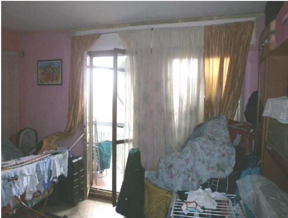
- FOTO 11 - SOGGIORNO -