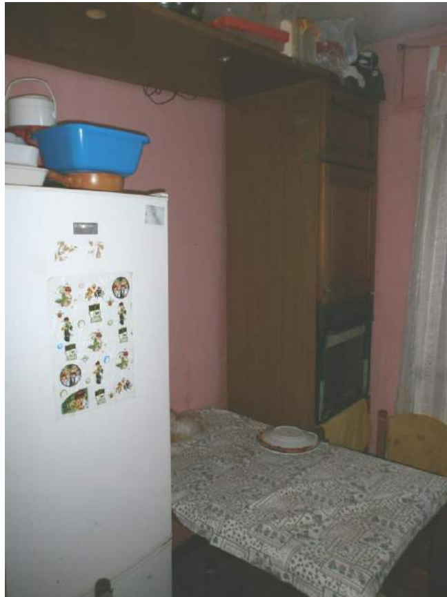
- FOTO 13 - CUCINA -