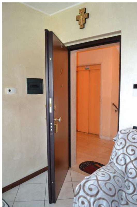
FOTO N. 4 – INTERNO – Porta blindata e ingresso all'appartamento direttamente in soggiorno-pranzo