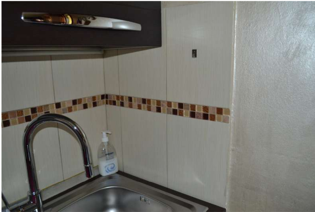
FOTO N. 8 – INTERNO – Tipologia rivestimento parete attrezzata angolo cottura con fila mosaico