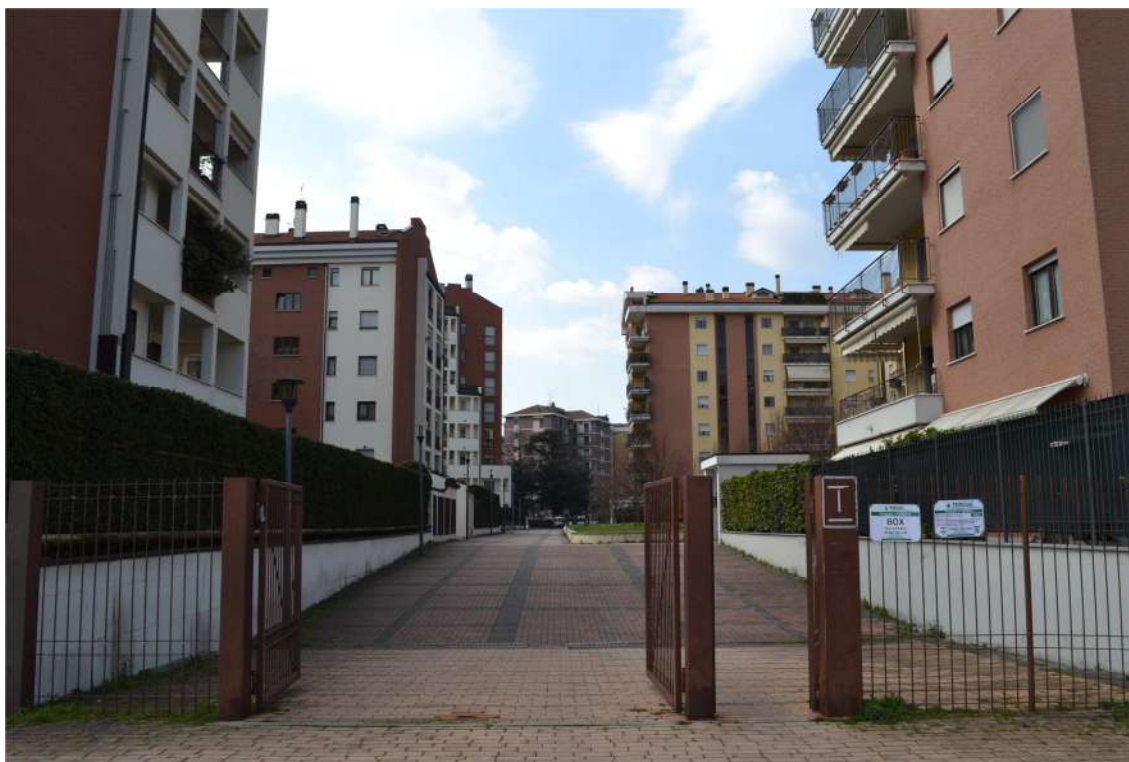
FOTO N. 1 – ESTERNO: Ingresso dal parco al complesso condominiale di Via Luigi Ornato n.110