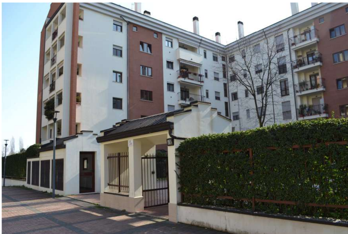
FOTO N. 2 – ESTERNO: Edificio del complesso condominiale di Via Luigi Ornato n.110