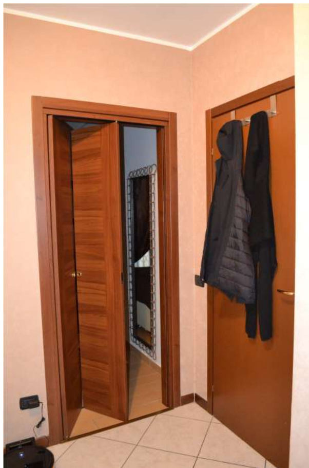
FOTO N. 9 – INTERNO – Disimpegno e porte interne (a libro e a battente)