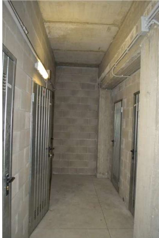
FOTO N. 14 – ACCESSORIO INDIRETTO – Disimpegno condominiale delle cantine (parti comuni)