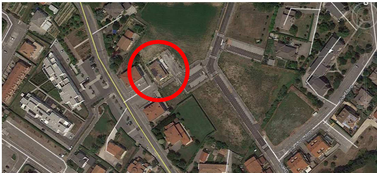
Fig.1: vista aerea dell'edificio oggetto di trattazione.