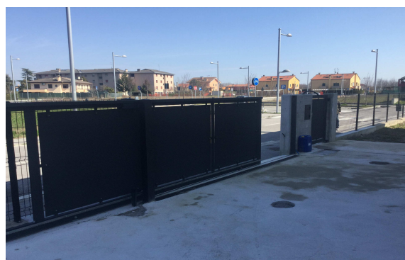
Fig.3: cortile verso strada.