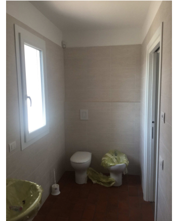
Fig.16: bagno piano primo.