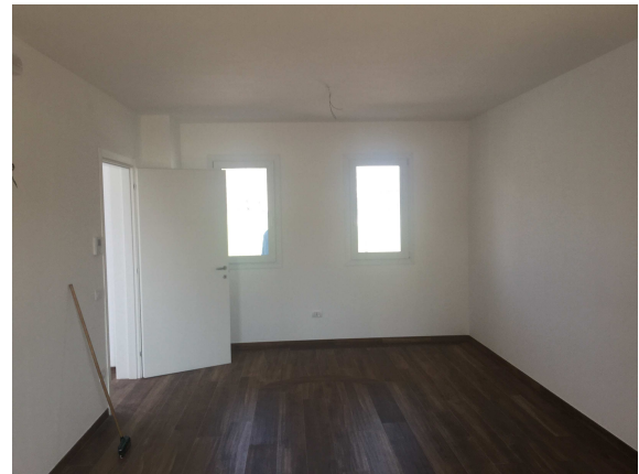
Fig.10-11: viste soggiorno.