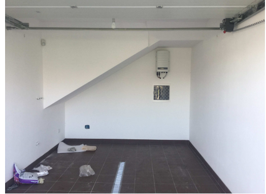
Fig.8-9: vista esterna ed interna autorimessa.