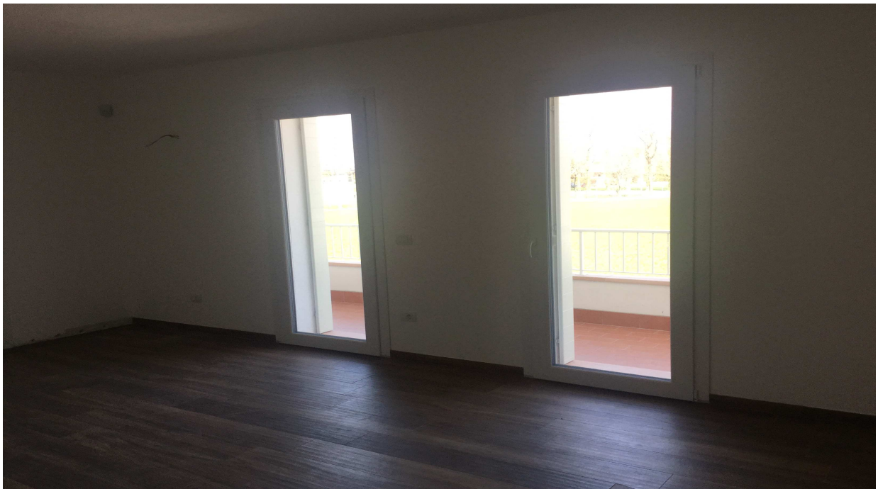
Fig.17: camera piano primo.