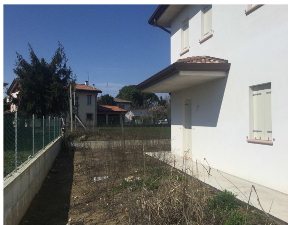
Fig.5: vista giardino posteriore.