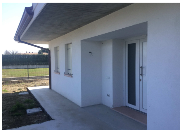
Fig.6-7: viste ingresso