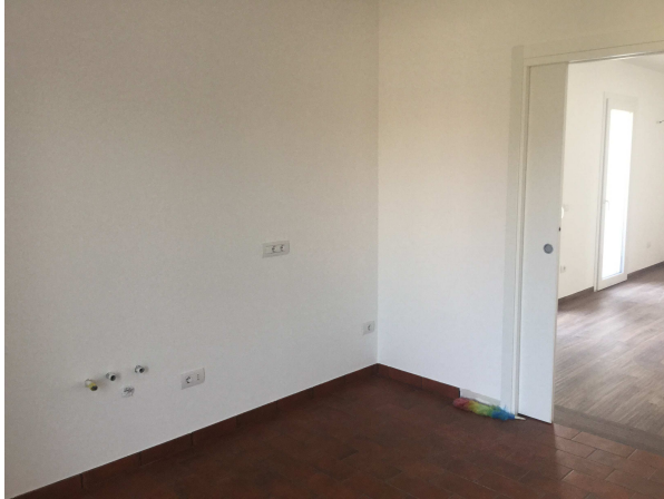
Fig.15: "cucina" piano primo.

Iscritto all'Albo dei Consulenti Tecnici del Tribunale di Milano al n°12247