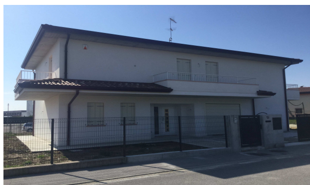
Fig.2: vista esterna edificio.