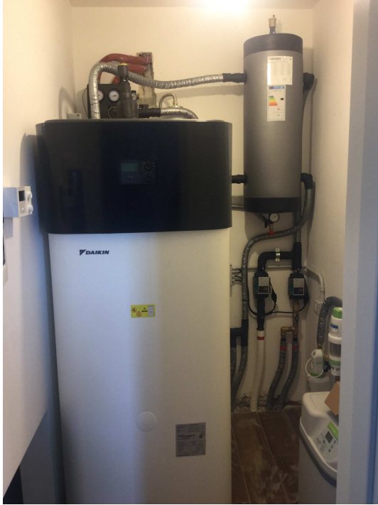
Fig.12: locale tecnico.

Iscritto all'Albo dei Consulenti Tecnici del Tribunale di Milano al n°12247