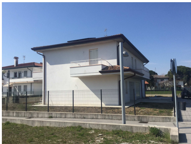
Fig.4: vista laterale edificio.

Iscritto all'Albo dei Consulenti Tecnici del Tribunale di Milano al n°12247