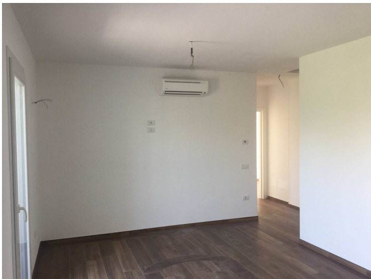
Fig.14: disimpegno piano primo.