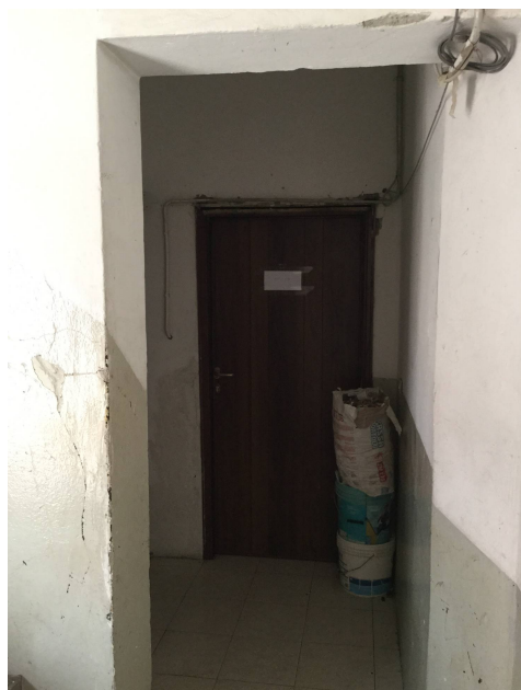
Fig.10: vista ingresso appartamento da scala comune.