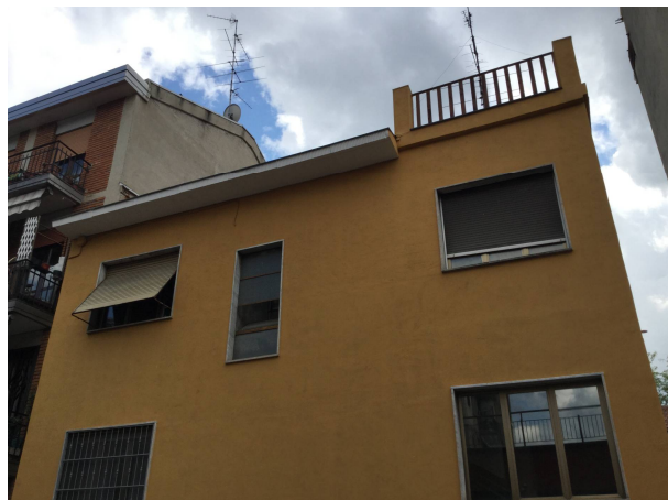
Fig.4: particolare della facciata.

Iscritto all'Albo dei Consulenti Tecnici del Tribunale di Milano al n°12247