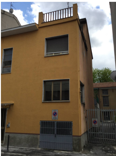
Fig.3: vista dell'edificio e del cancello carraio verso cortile interno.