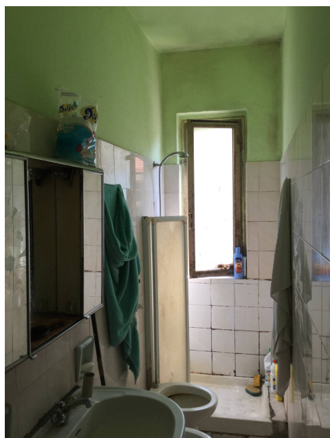
Fig.13-14: viste del servizio igienico.