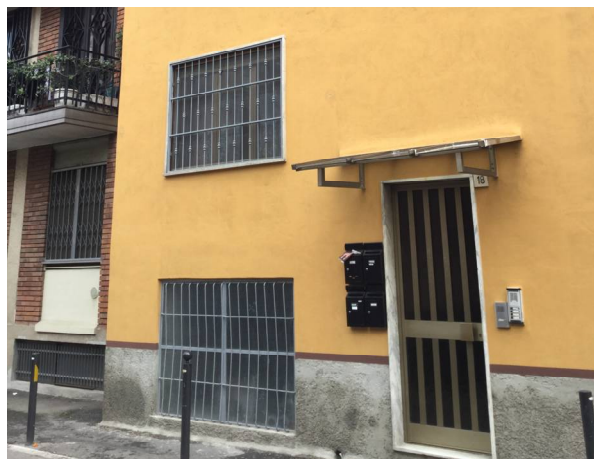
Fig.5: particolare ingresso del fabbricato.