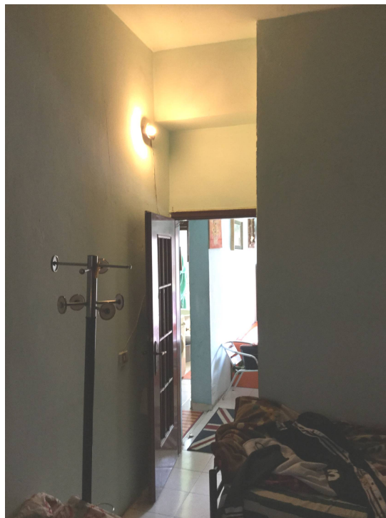
Fig.19-20: viste della camera da letto.