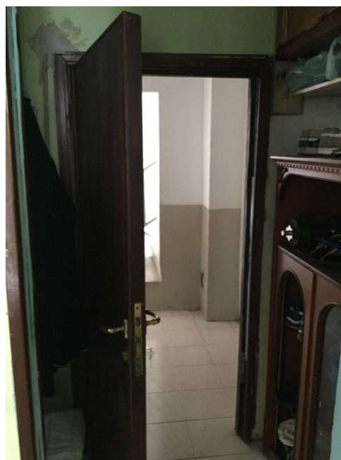
Fig.12: vista ingresso da corridoio.