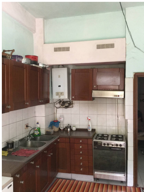
Fig.16: vista angolo cottura.