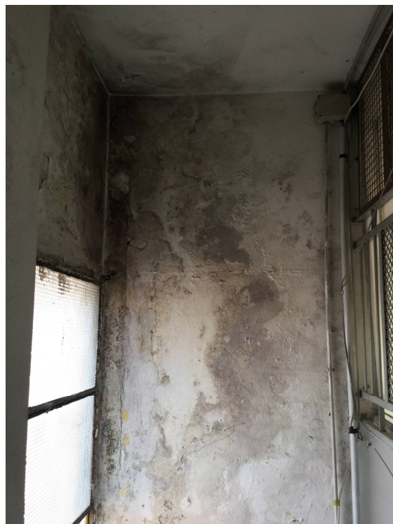
Fig.8-9: vista e particolare delle scale del primo piano.