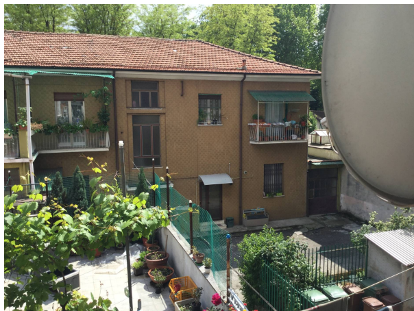
Fig.18: vista dal balcone verso cortile interno.