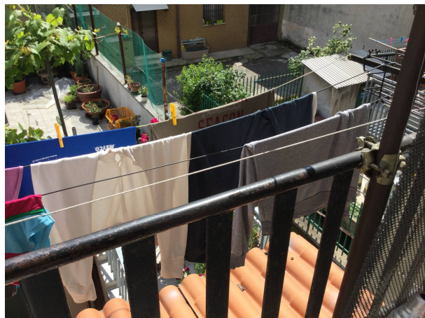
Fig.17: vista del balcone.