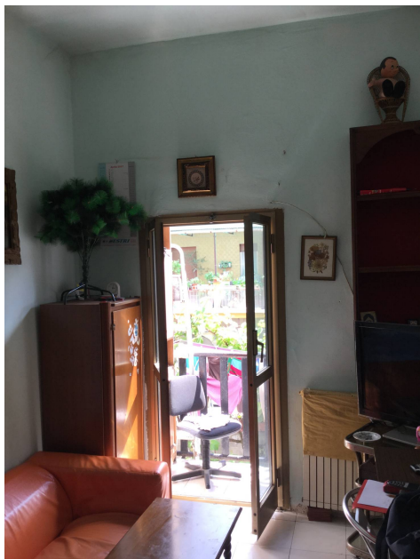
Fig.15: vista del soggiorno da ingresso locale.

Iscritto all'Albo dei Consulenti Tecnici del Tribunale di Milano al n°12247