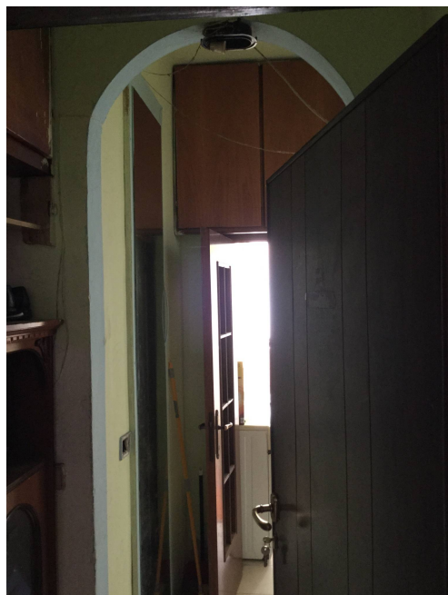
Fig.11: vista ingresso da parti comuni.

Iscritto all'Albo dei Consulenti Tecnici del Tribunale di Milano al n°12247