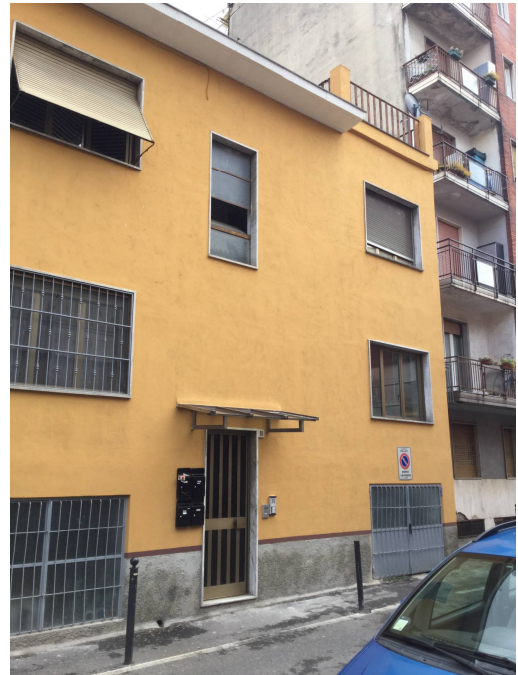
Fig.1-2: viste dell'edificio da Via Palmanova.