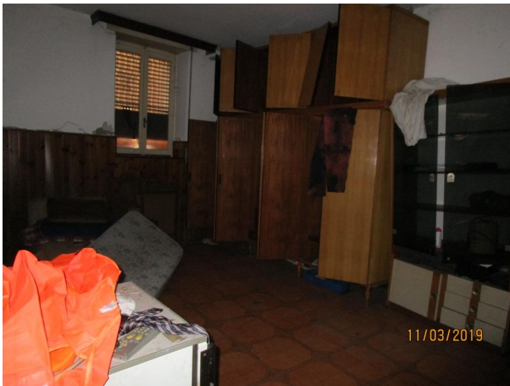
Foto 7 - Camera da letto al piano terra