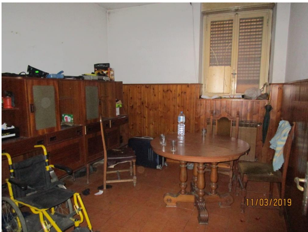
Foto 4 – Accesso all'appartamento e vista della sala da pranzo/soggiorno