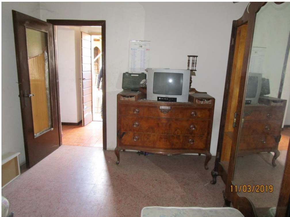
Foto 16 – Vista dalla seconda camera da letto, verso il disimpegno e l'accesso al balcone