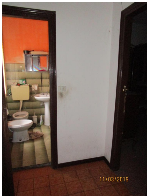
Foto 13 - Disimpegno di accesso alla seconda camera da letto ed al bagno