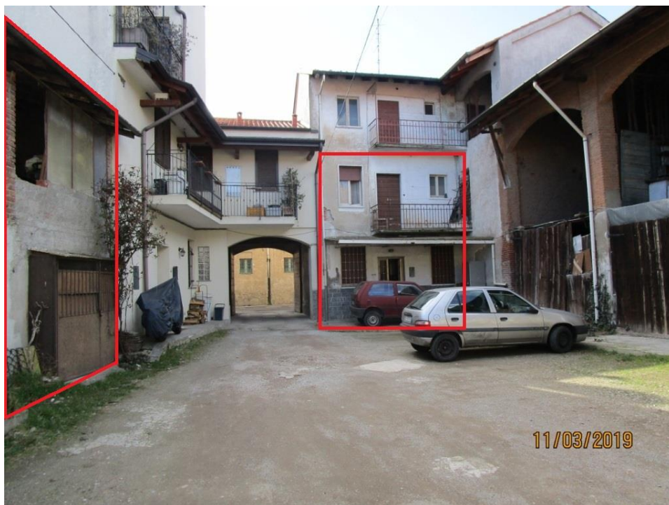
Foto 2 – Vista dalla corte comune. Riquadrate in rosso le unità immobiliari pignorate