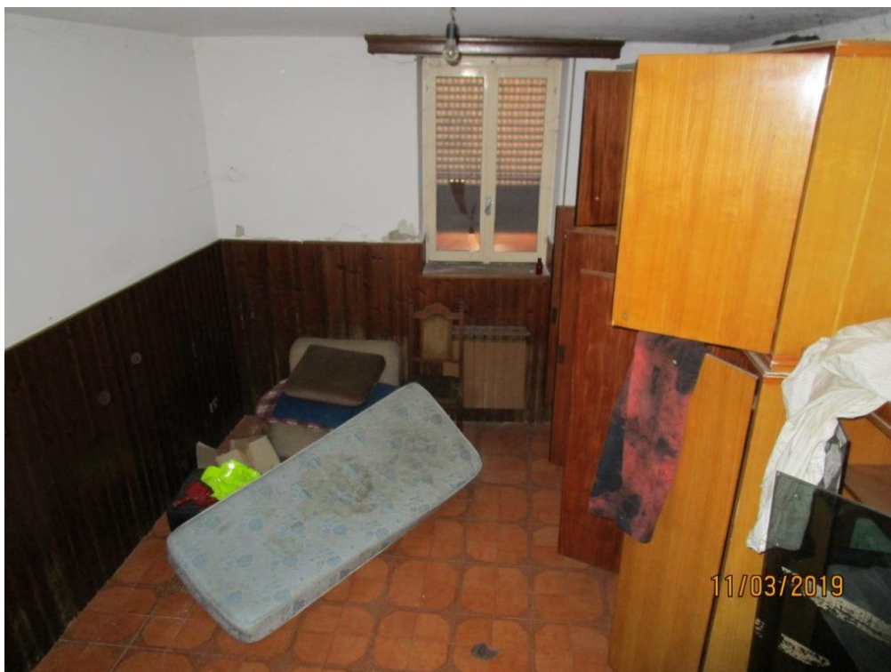
Foto 8 - Camera da letto al piano terra