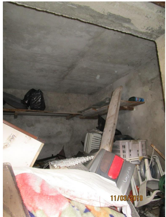
Foto 19/20 – Vista ed inquadramento del box e rustico sub 706 oggetto di pignoramento