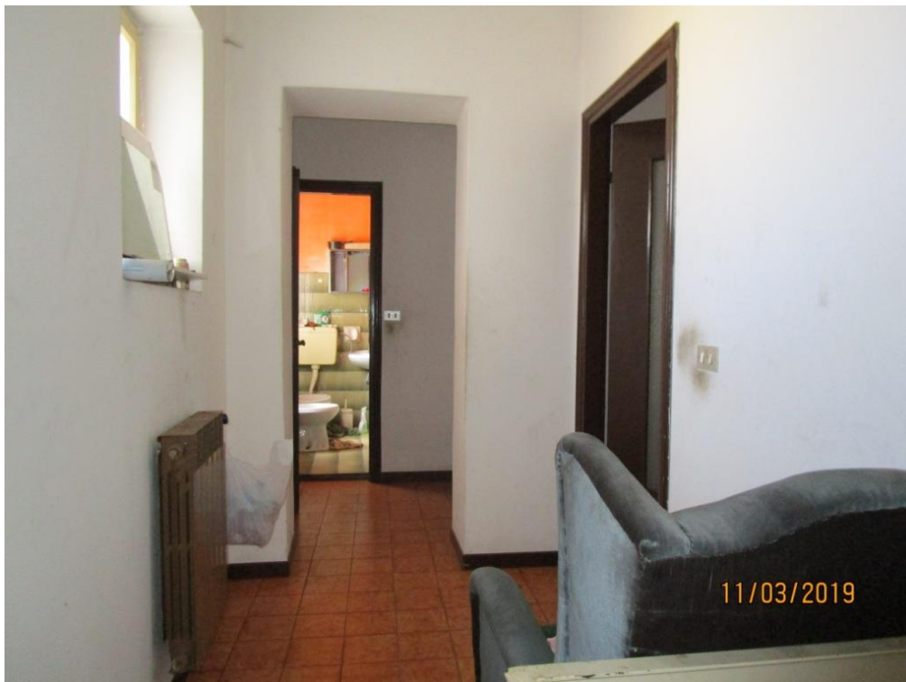
Foto 10 – Vista del piano primo, dal piano di sbarco della scala interna