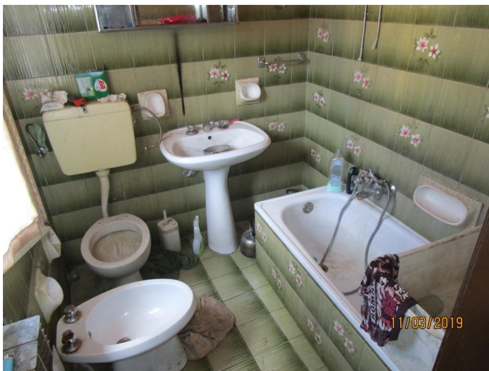
Foto 14 - Bagno