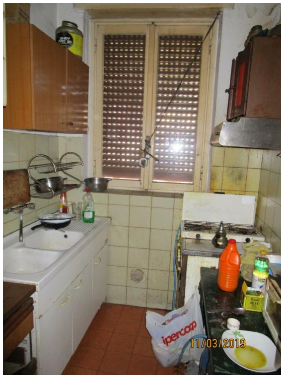
Foto 6 - Cucina