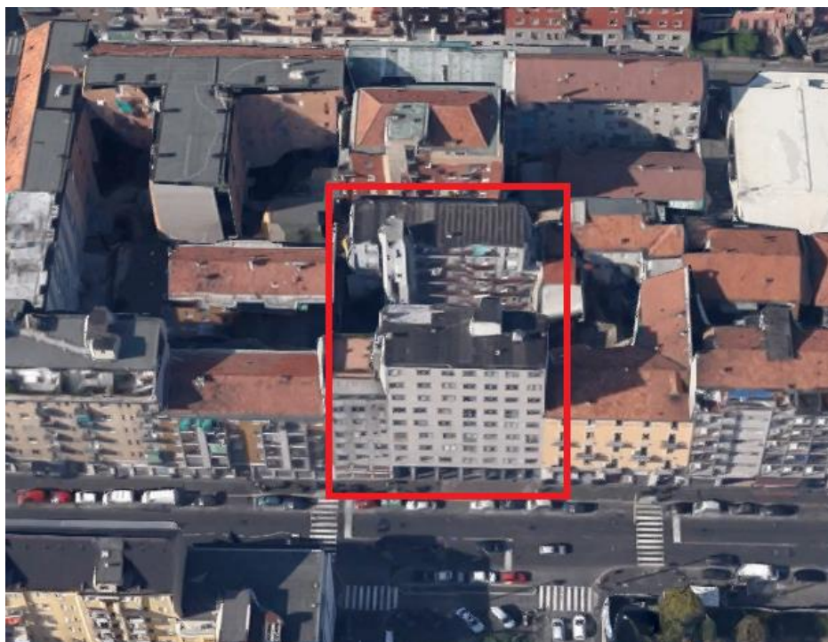
Stralcio ortofoto – vista aerea, localizzazione