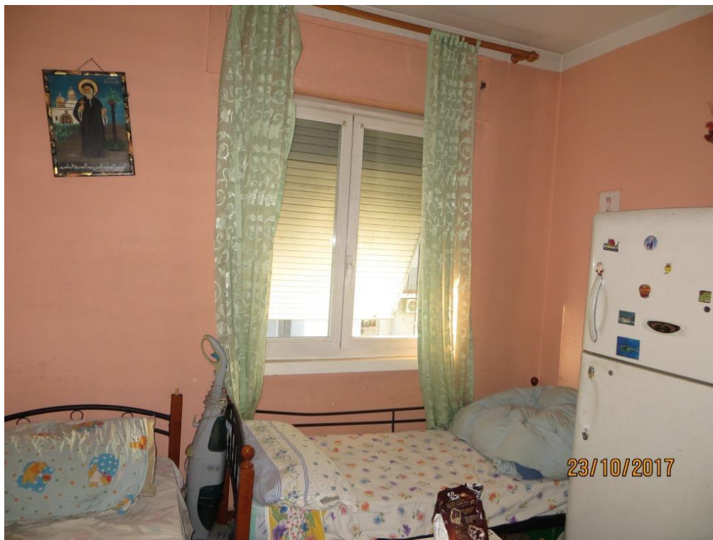
Foto 13 – Camera da letto singola con affaccio sul cortile condominiale