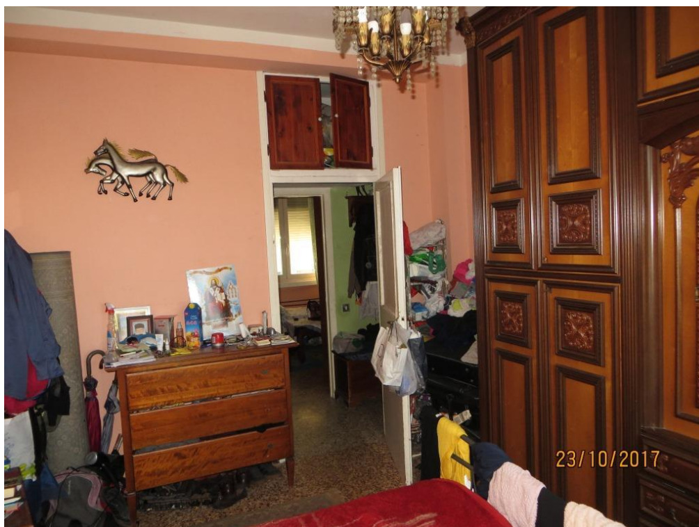
Foto 12 - Vista dall'interno della camera da letto doppia, verso l'ingresso