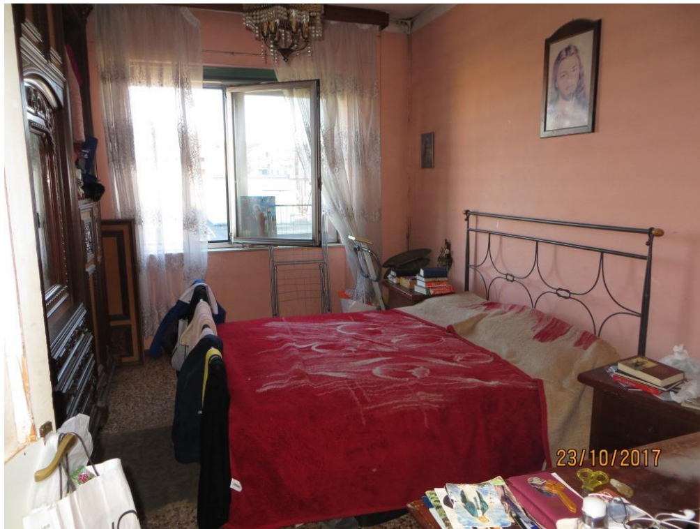
Foto 11 - Camera da letto doppia con affaccio su via Padova