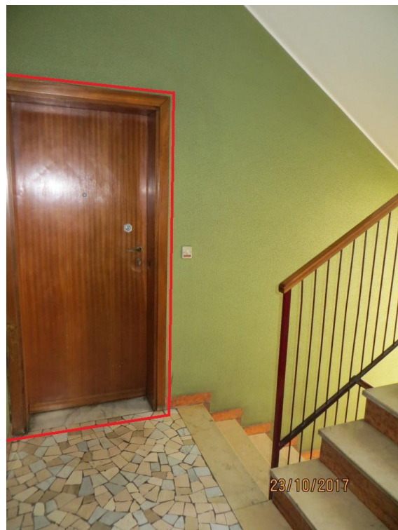
Foto 5 - Piano di sbarco del vano scala e dell'ascensore. Inquadramento della porta di accesso all'appartamento