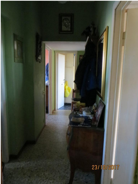
Foto 6 – Vista dell'ingresso con corridoio di distribuzione dei locali