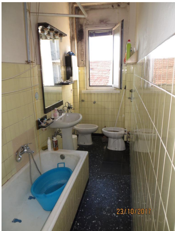
Foto 14 - Bagno