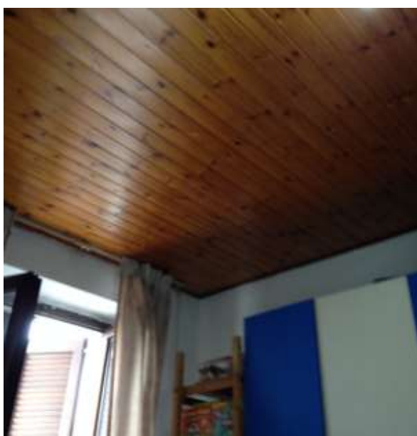
Foto 17. Vista della camera da letto, con soffitto in legno.