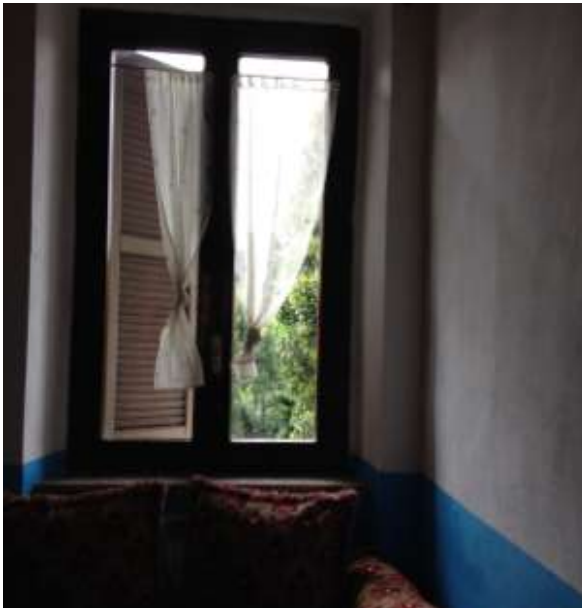
Foto 15. Vista del soggiorno.