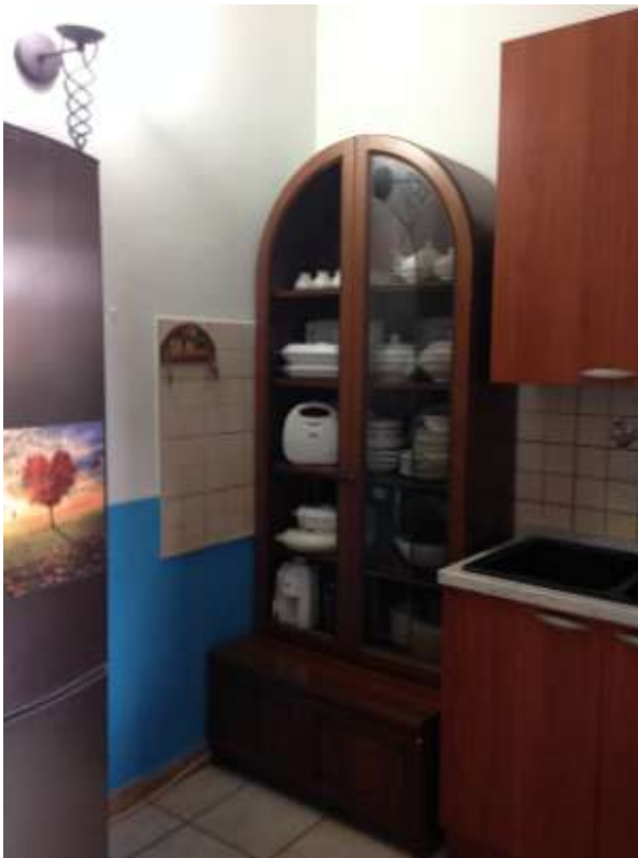
Foto 10. Vista della cucina.