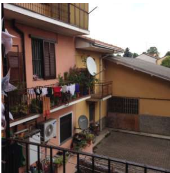
Foto 6. Vista del cortile intero dal ballatoio.