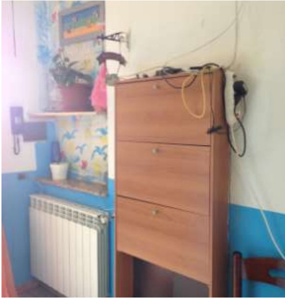
Foto 9. Vista della cucina in cui sono collocati citofono e quadro elettrico.