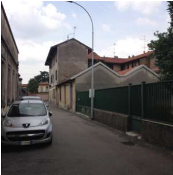
Foto 1. Vista del fabbricato da via XX Settembre.