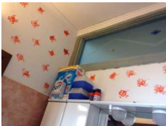
Foto 13. Vista della finestra che permette l'ingresso dell'illuminazione naturale all'interno del bagno.