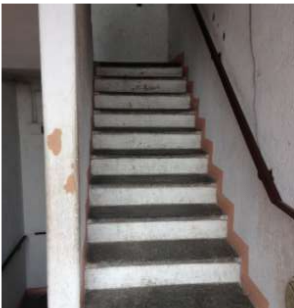
Foto 4. Vista della scala di accesso ai livelli superiori.