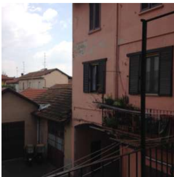
Foto 5. Vista del cortile interno, dal ballatoio.