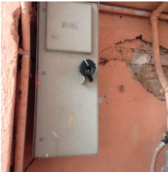
Foto 3. Vista del contatore elettrico.