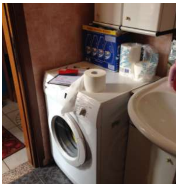
Foto 14. Vista del bagno, in cui è posizionata la lavatrice.