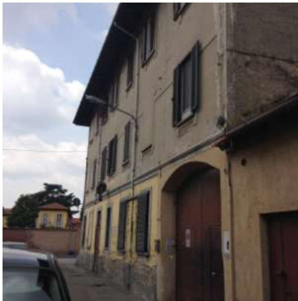
Foto 2. Vista del portone di accesso al fabbricato in ferro.