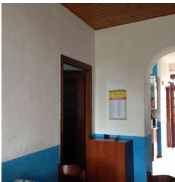
Foto 11. Vista della cucina, abitabile.