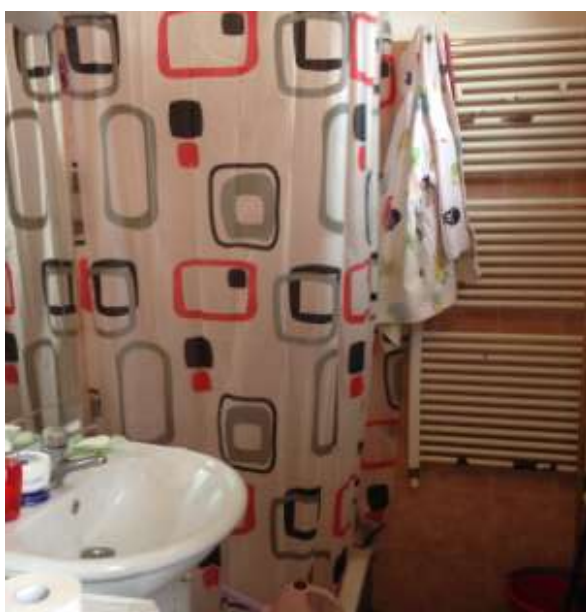
Foto 12. Vista del bagno.