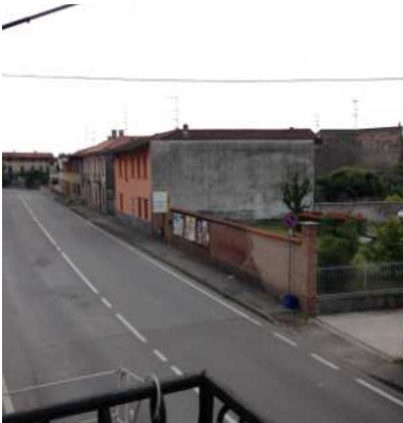
Foto 16. Vista dal balcone, a cui si accede dal soggiorno, su via Tadini.