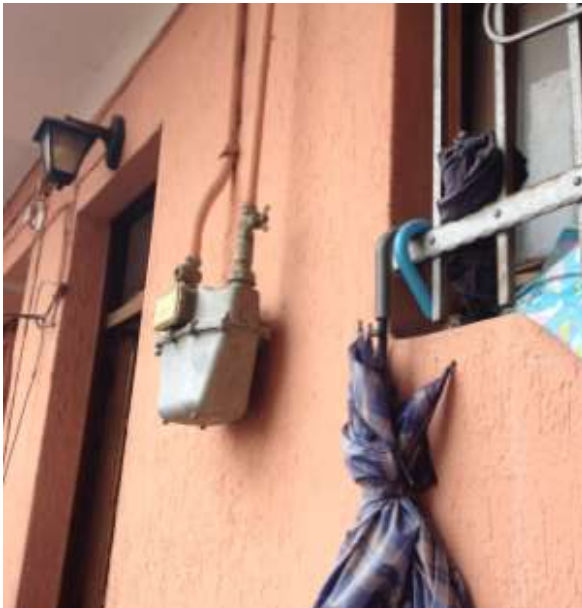
Foto 7. Vista del portoncino di ingresso all'appartamento.