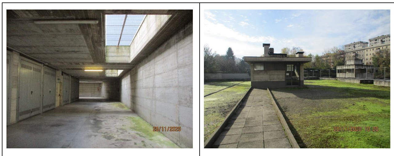
Corsello di manovra

Principali collegamenti pubblici: autobus di linea 49-78-64-80.