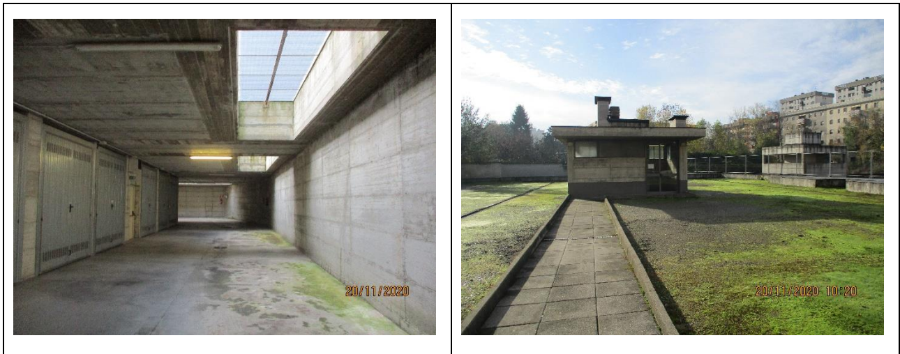
Corsello di manovra

Principali collegamenti pubblici: autobus di linea 49-78-64-80.