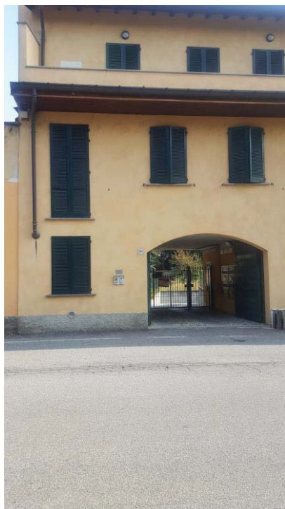
VIA CONCORDATO 20 - FACCIATA