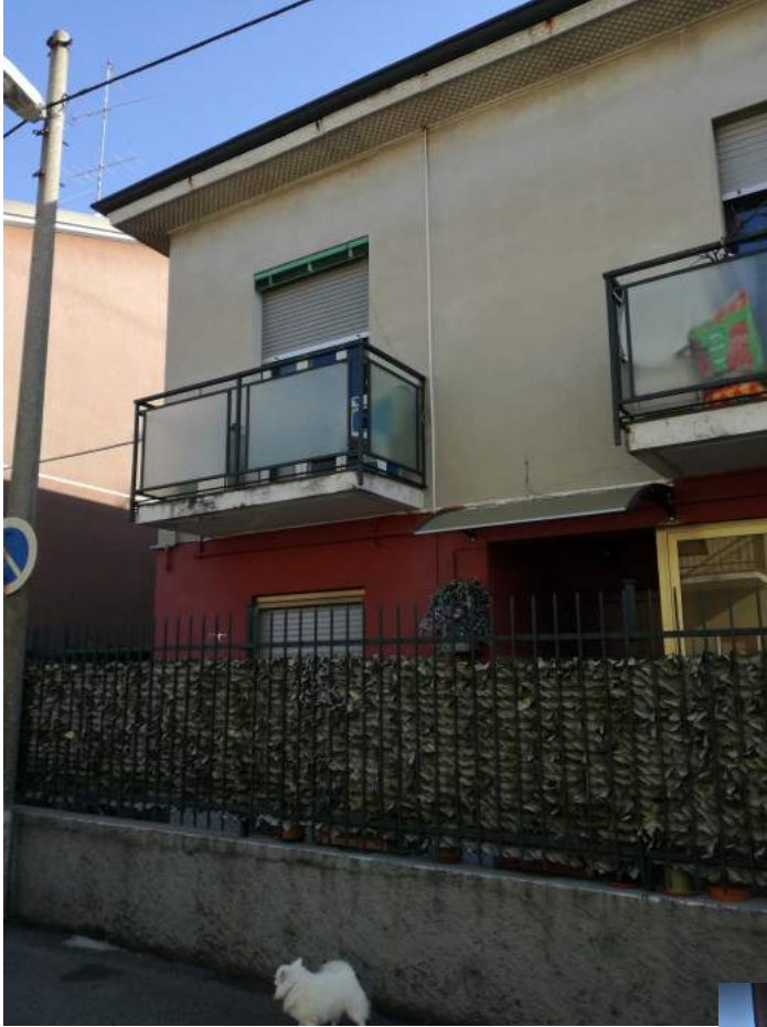
Foto 4,5 foto esterne del civico 18