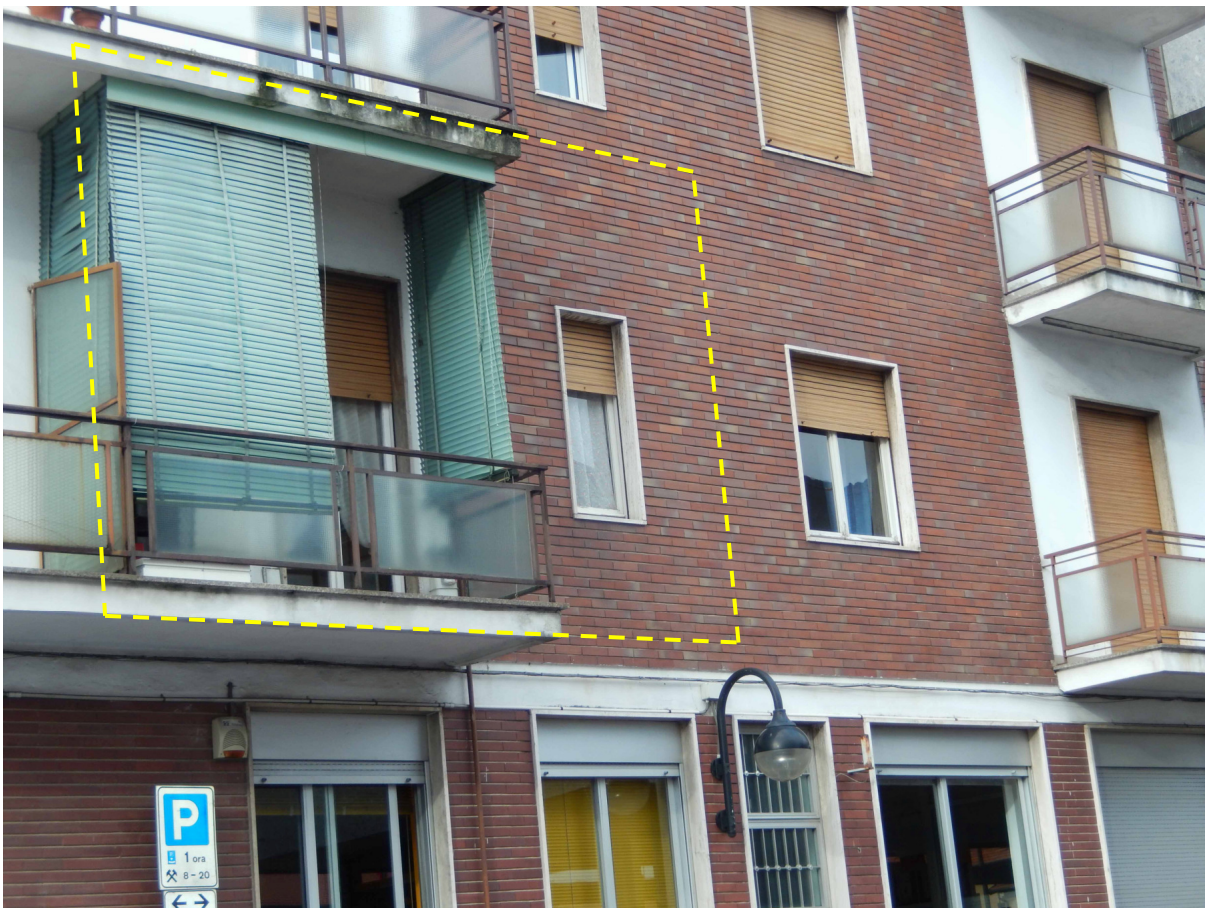
Foto 2 – Vista ravvicinata dell'appartamento in esame ripreso dalla piazza Giovanni XXIII.