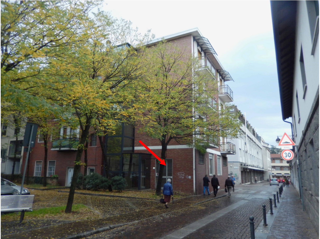
Foto 3 – Vista da ovest del fabbricato in esame. Indicato dalla freccia il portone d'ingresso.