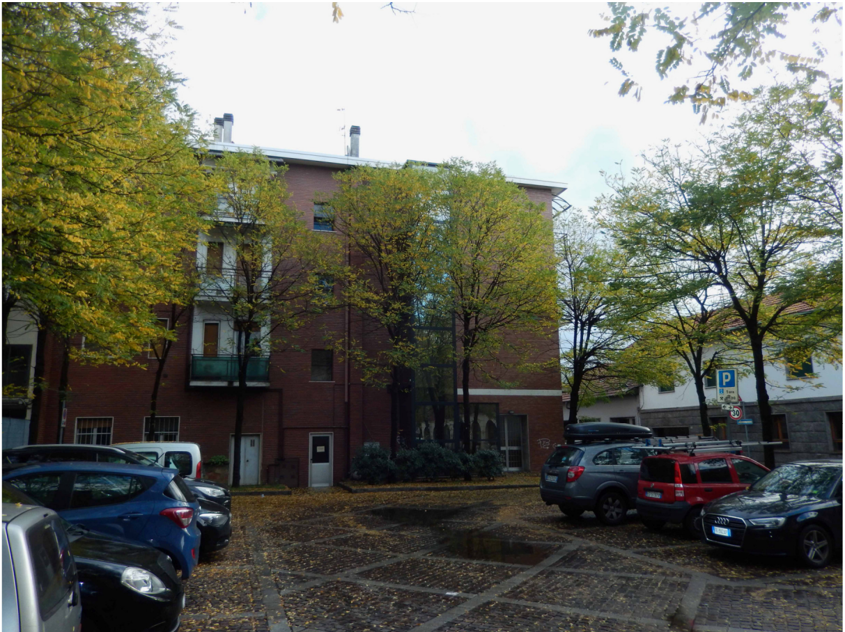
Foto 5 – Vista del prospetto ovest con in primo piano l'antistante parcheggio pubblico.