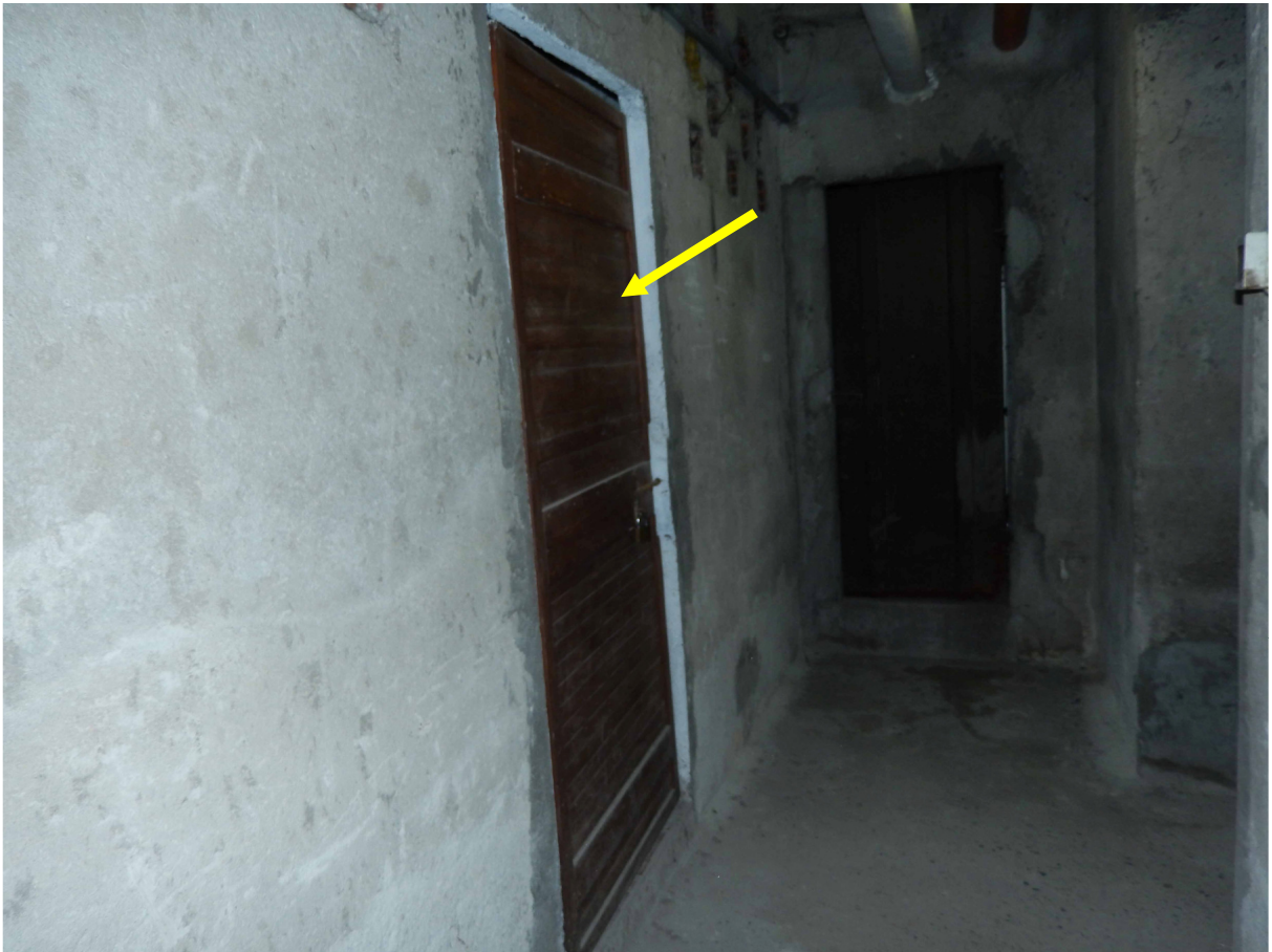
Foto 15 – Piano interrato. Indicata dalla freccia la porta della cantina.