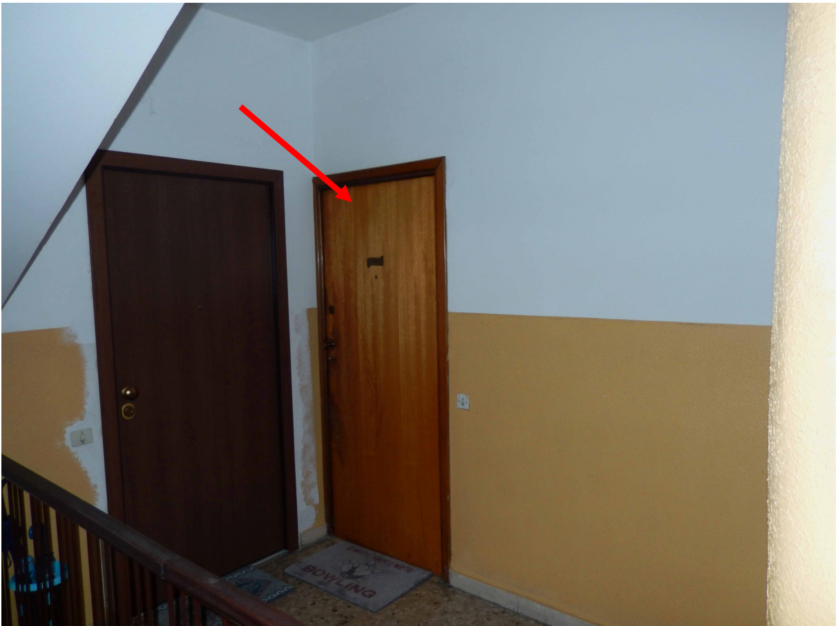
Foto 8 – La porta di ingresso dell'appartamento vista dal pianerottolo comune.