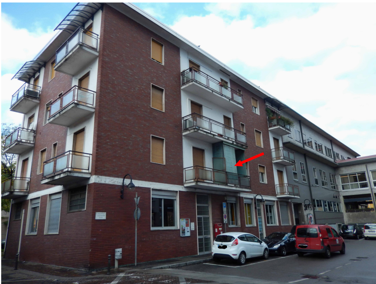
Foto 1 – Vista da est del fabbricato. Indicato dalla freccia l'appartamento in esame.