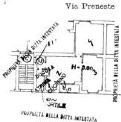
Estratto da planimetria catastale presentata il 30/01/1943