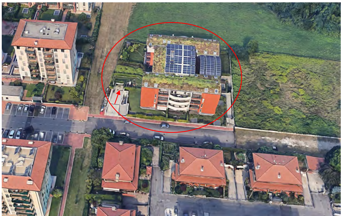
Inquadramento territoriale - vista dell'area e individuazione fabbricato e accesso carrabile