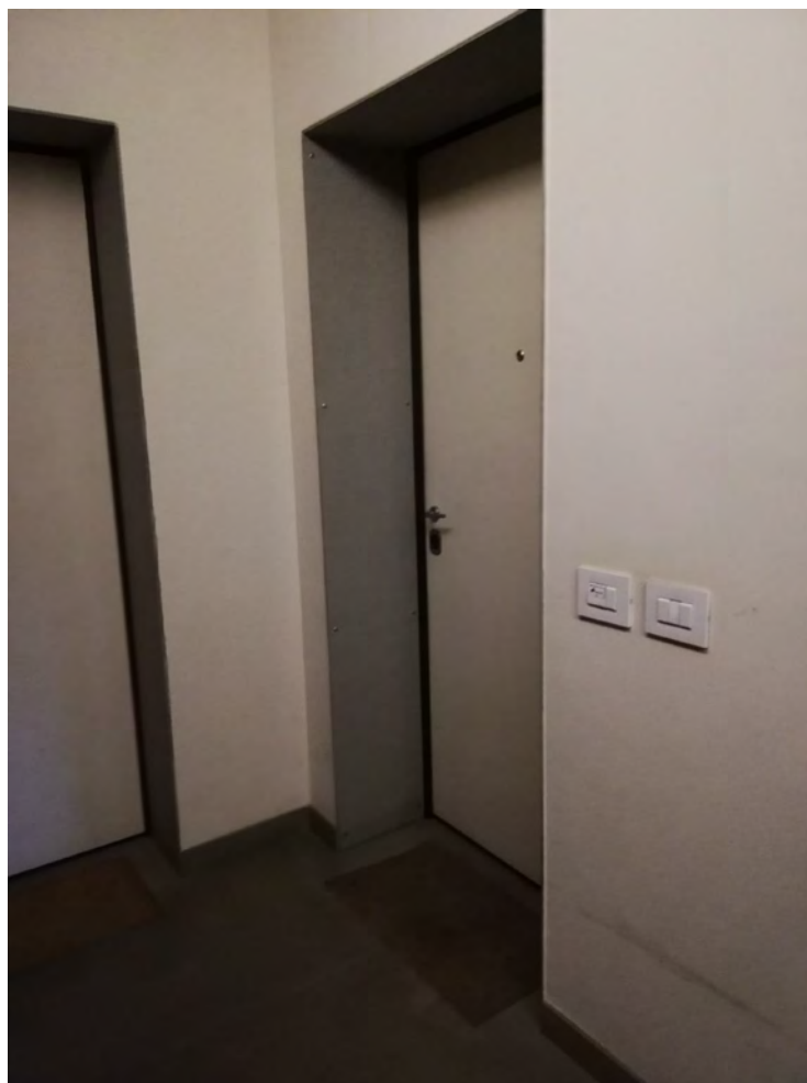
Accesso al deposito - piano terzo sottotetto