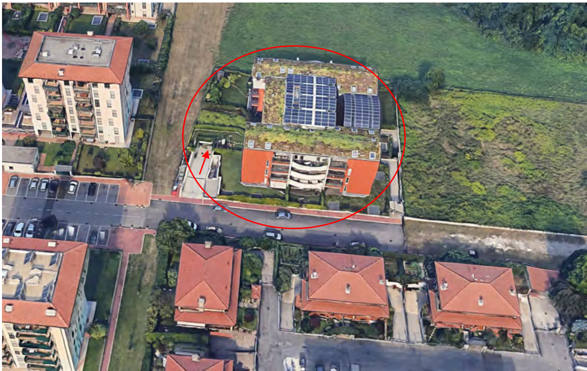
Inquadramento territoriale - vista dell'area e individuazione fabbricato e accesso carrabile