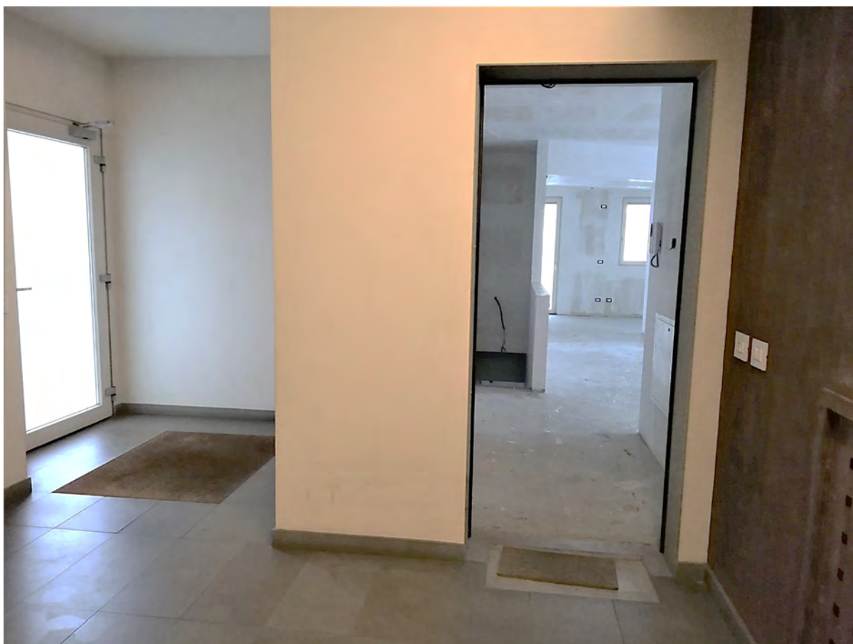
Vista ingresso sub. 45 al piano terra