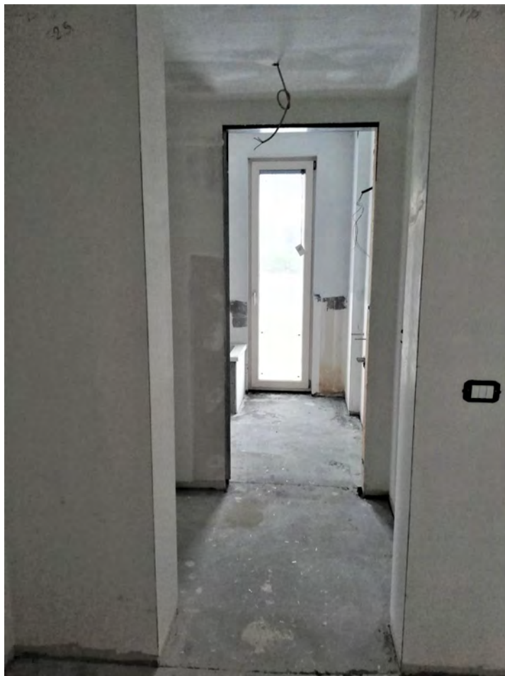
Disimpegno bagno e camera - bagno