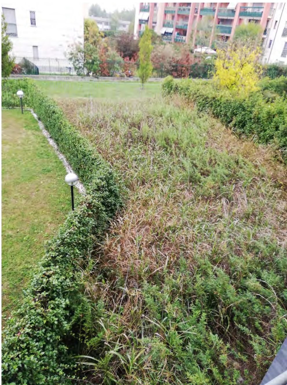
Vista del giardino di pertinenza