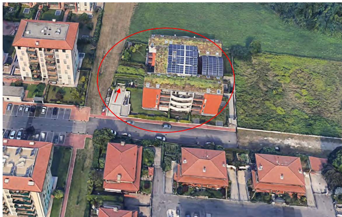
Inquadramento territoriale - vista dell'area e individuazione fabbricato e accesso carrabile