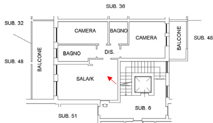
PIANO PRIMO ABITAZIONE H=2,70