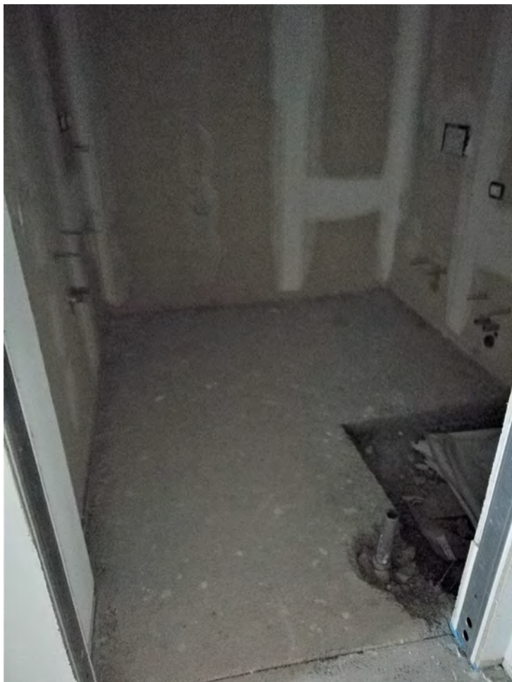
Bagno 2 e vista disimpegno zona notte