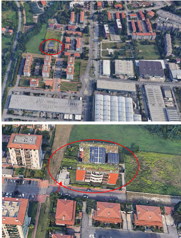
Inquadramento territoriale - vista dell'area e individuazione fabbricato e accesso carrabile

Dati Catastali: _____ foglio 24, particella 276, subalterno 52