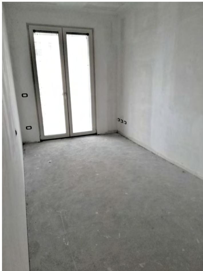
Camera e bagno 1