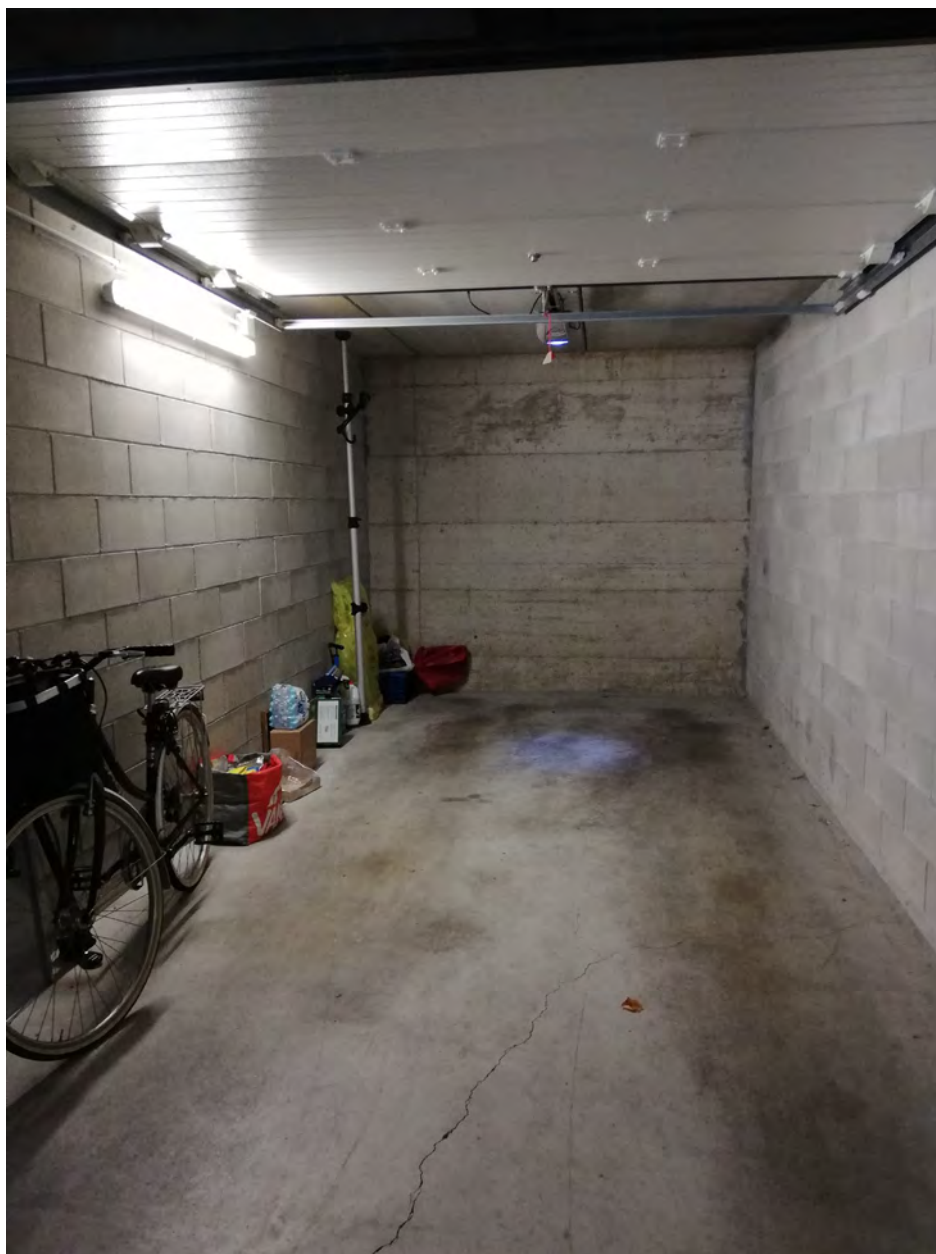
Vista box sub. 9