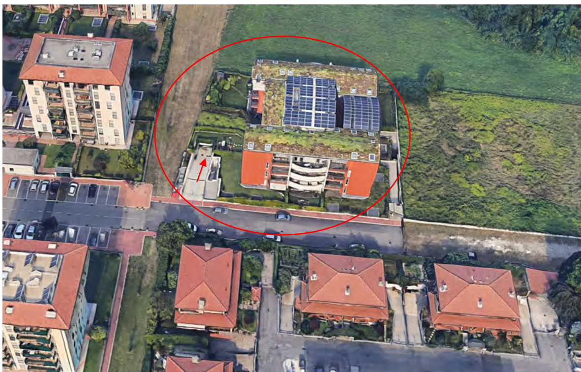
Inquadramento territoriale - vista dell'area e individuazione fabbricato e accesso carrabile