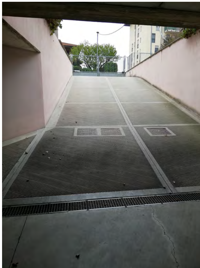
Rampa di accesso ai box