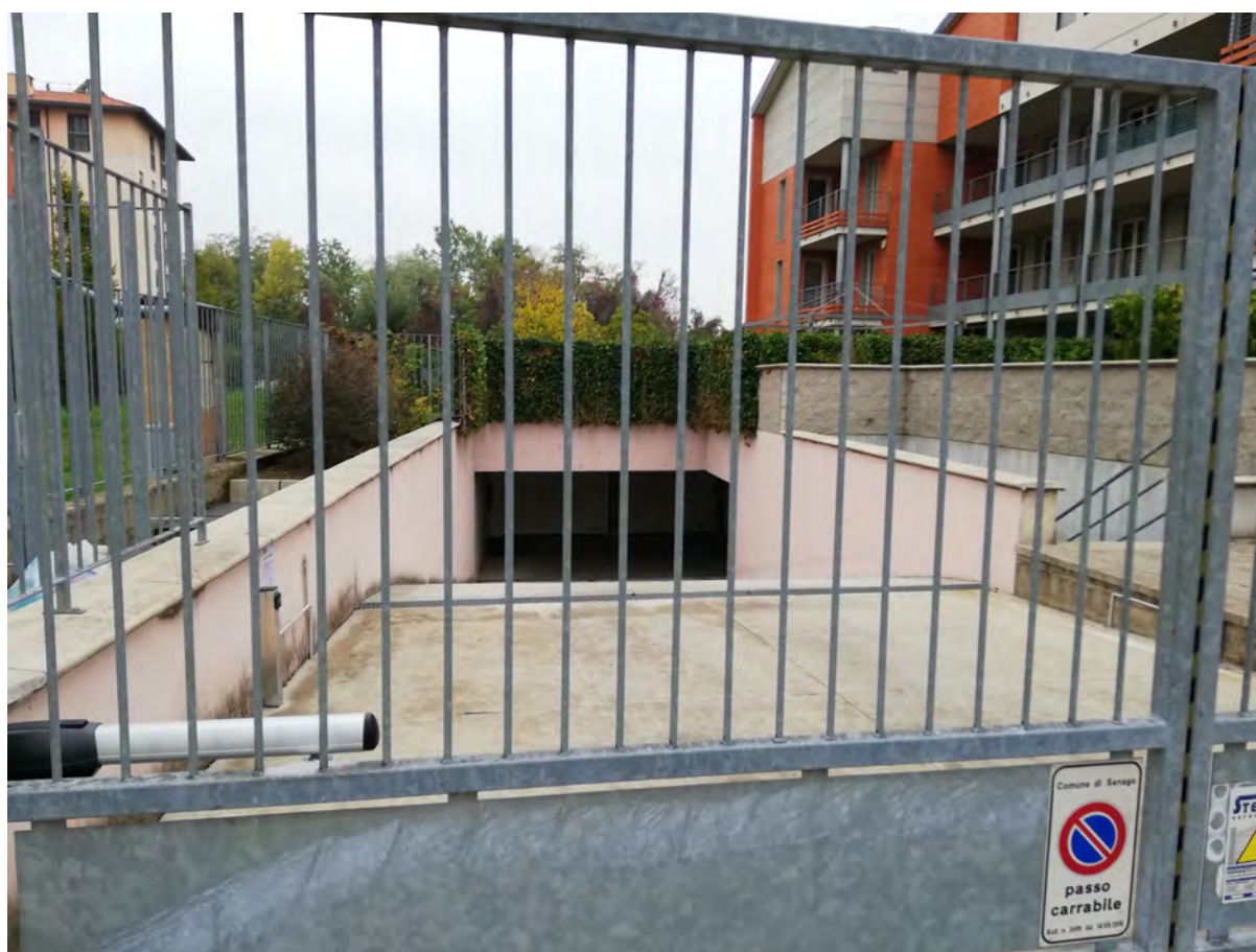
Accesso carrabile da via Londra