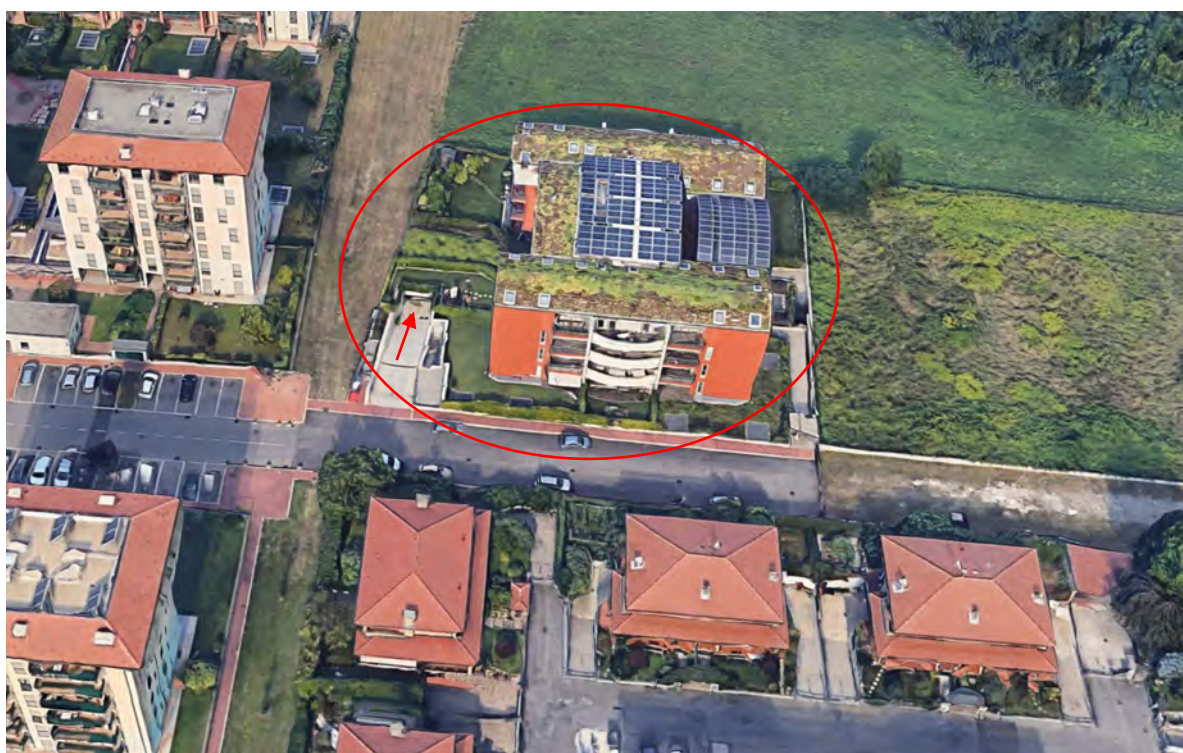
Inquadramento territoriale - vista dell'area e individuazione fabbricato e accesso carrabile