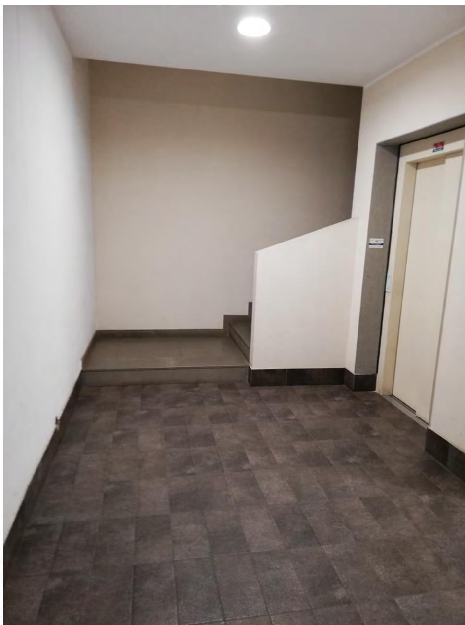
Corridoio comune accesso alle cantine (sub. 6)