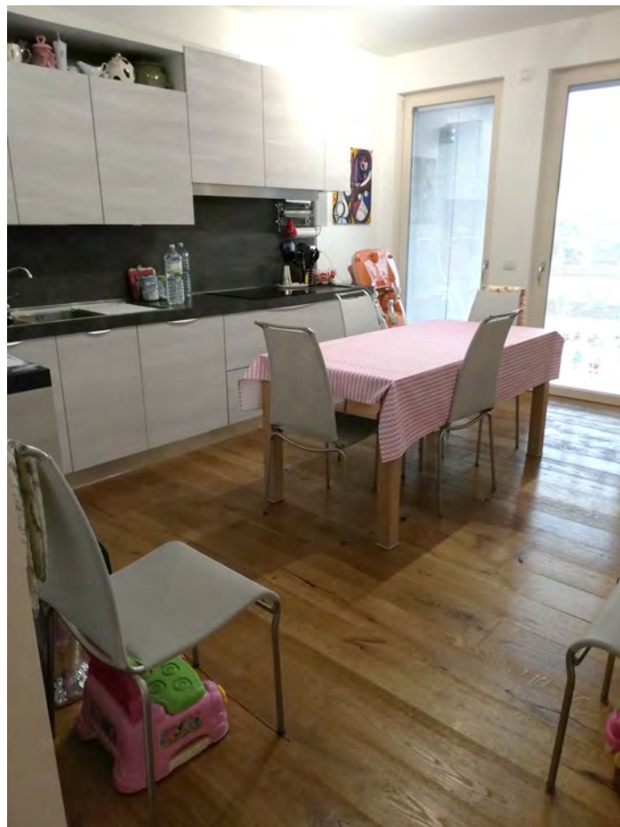
Cucina (da progetto: camera)