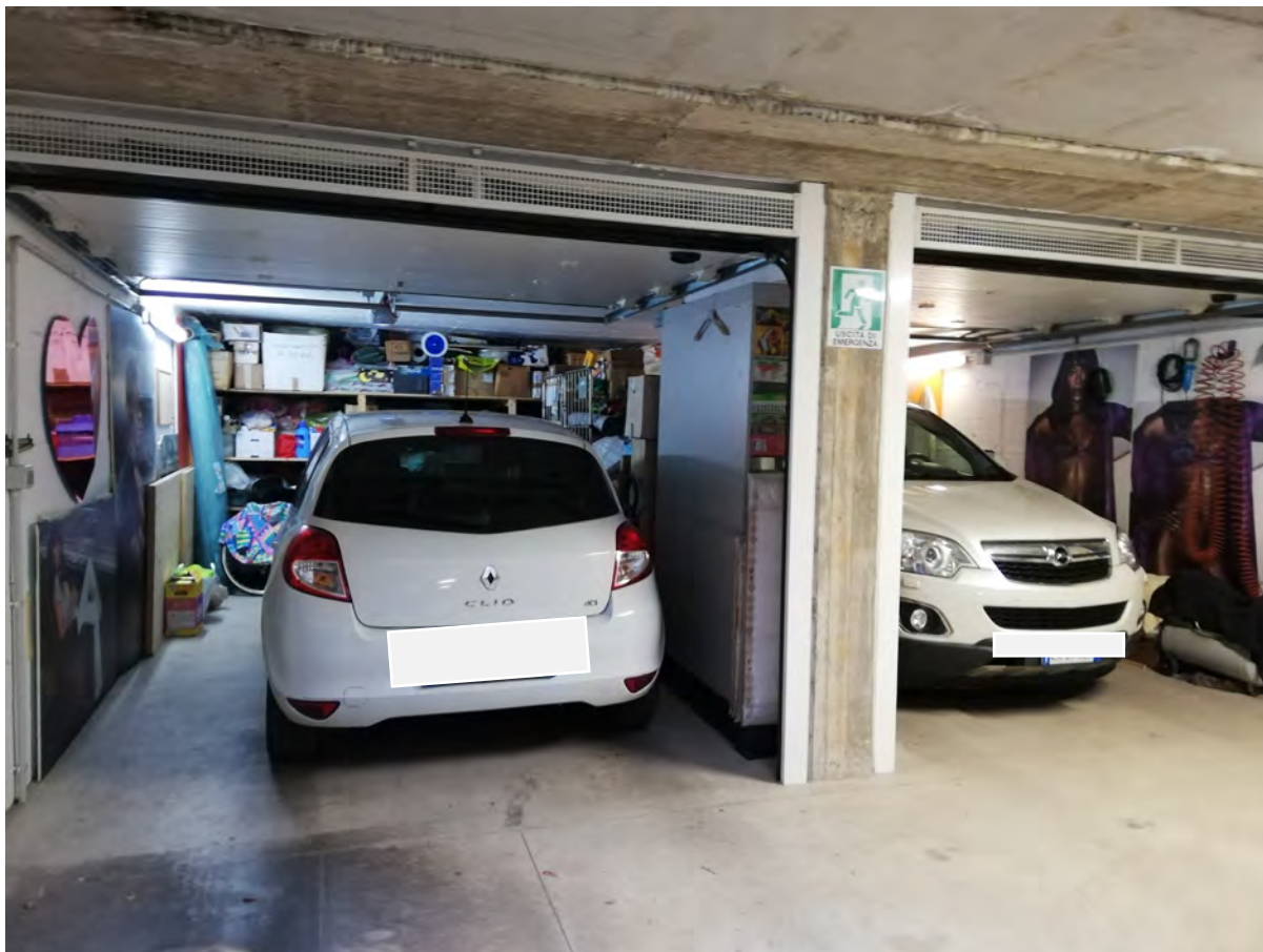
Box doppio sub. 26