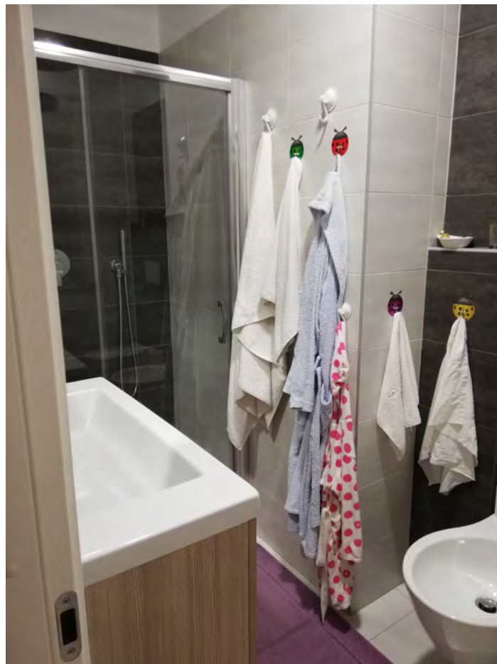
Lavanderia da progetto (bagno), piano interrato