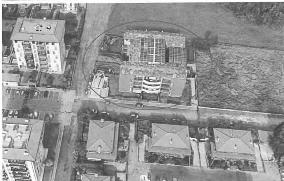
Inquadramento territoriale - vista dell'area e individuazione fabbricato e accesso carrabile