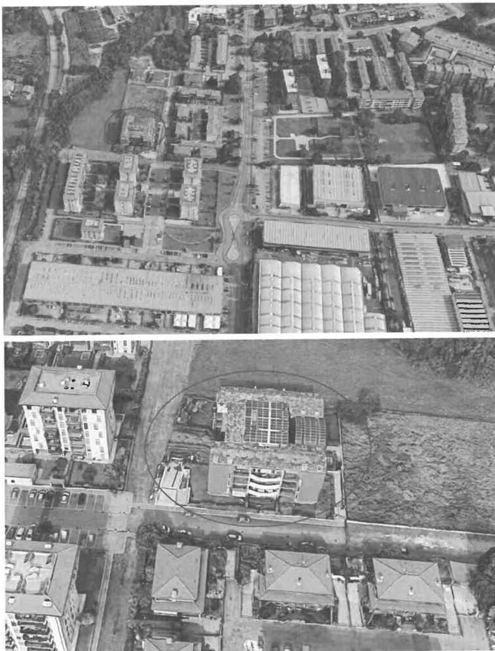
Inquadramento territoriale - vista dell'area e individuazione fabbricato e accesso carrabile

- strade: SP175 Via De Gasperi - distanza 450 m; SP119 Garbagnate/Nova Milanese - distanza 800 m.