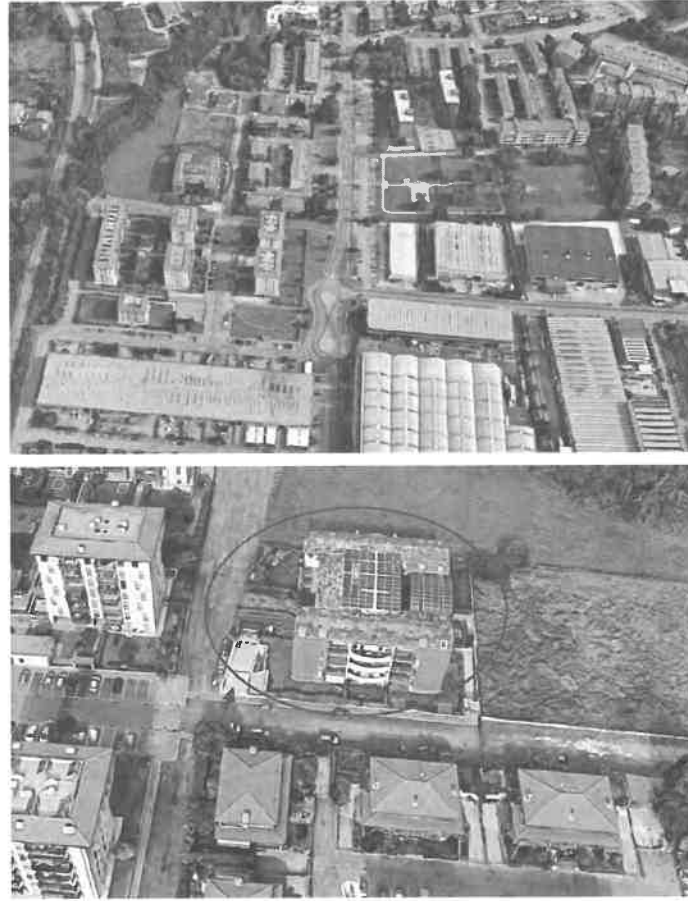
Inquadramento territoriale - vista dell'area e individuazione fabbricato e accesso carrabile