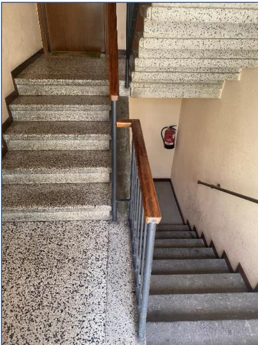
Foto 11 - vano scala comune