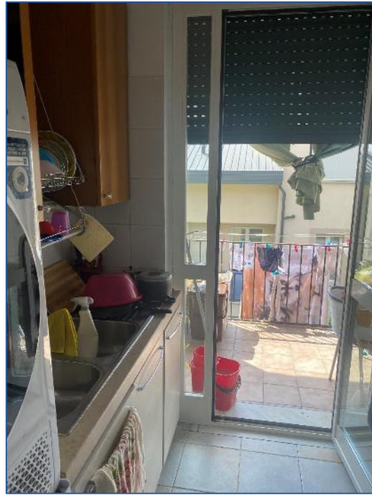
Foto 18 - cucina