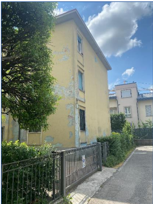
Foto 1 - immobile di via Sant'Orsola n. 5