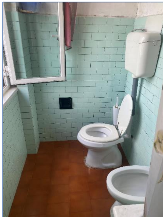
Foto 36 - bagno