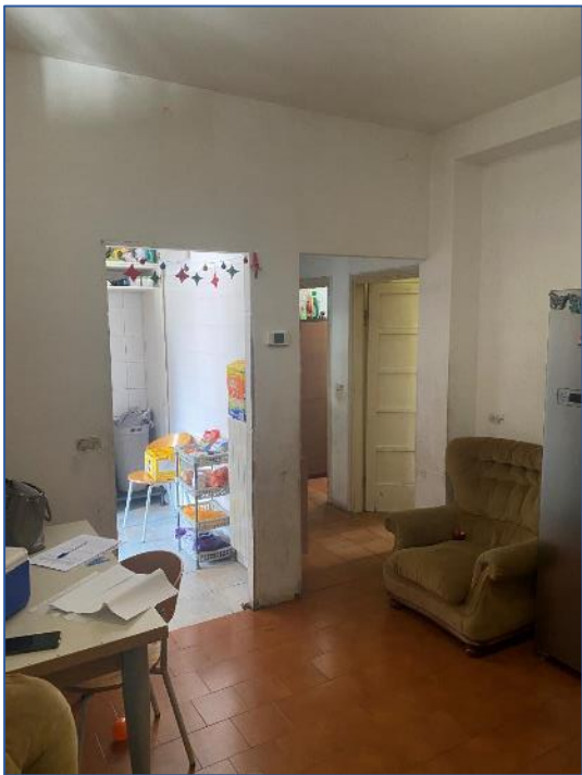
Foto 15 - zona giorno