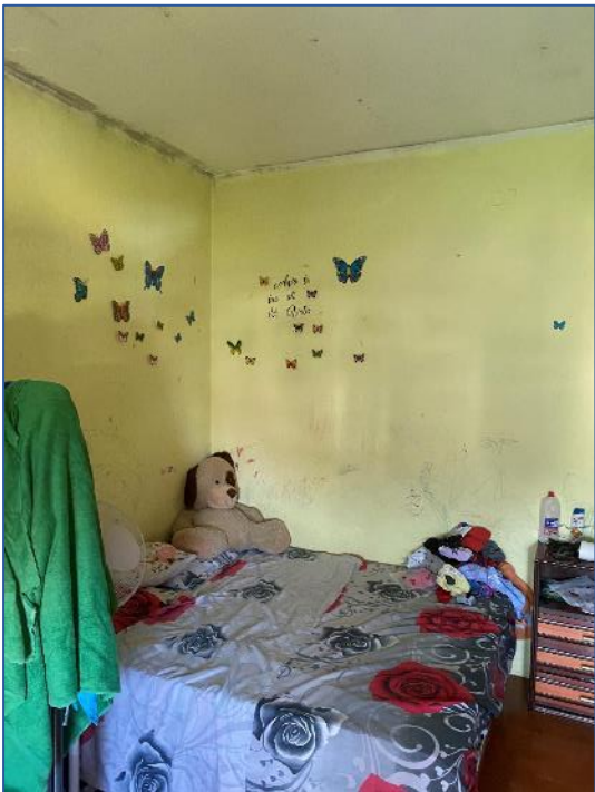
Foto 31 - camera 2