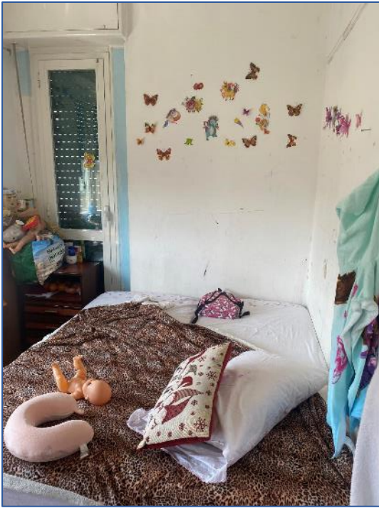
Foto 25 - camera 1