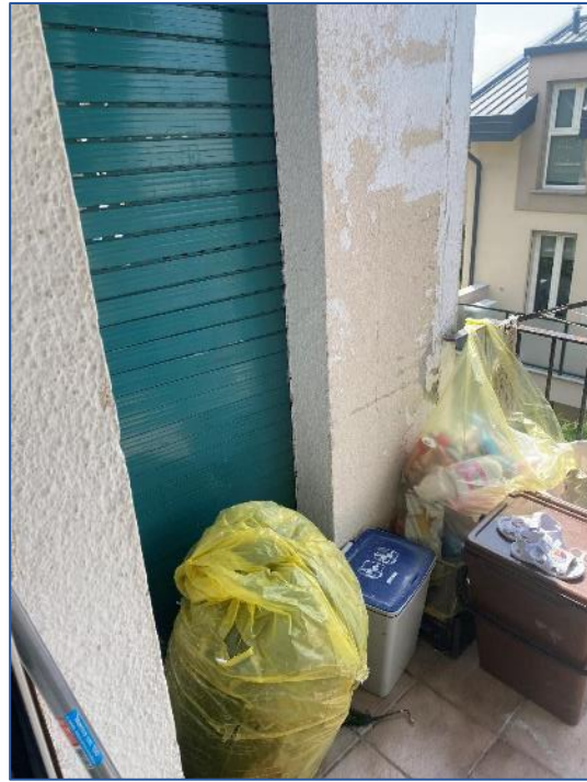
Foto 42 - balcone