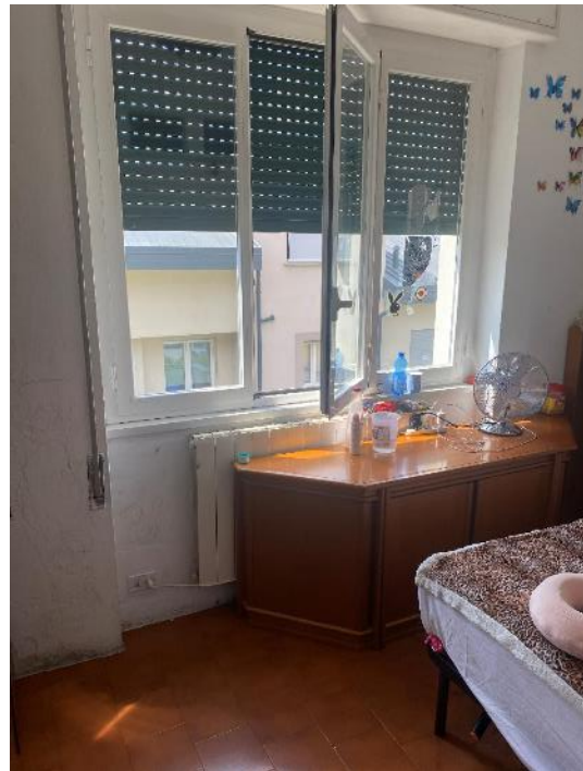
Foto 24 - camera 1