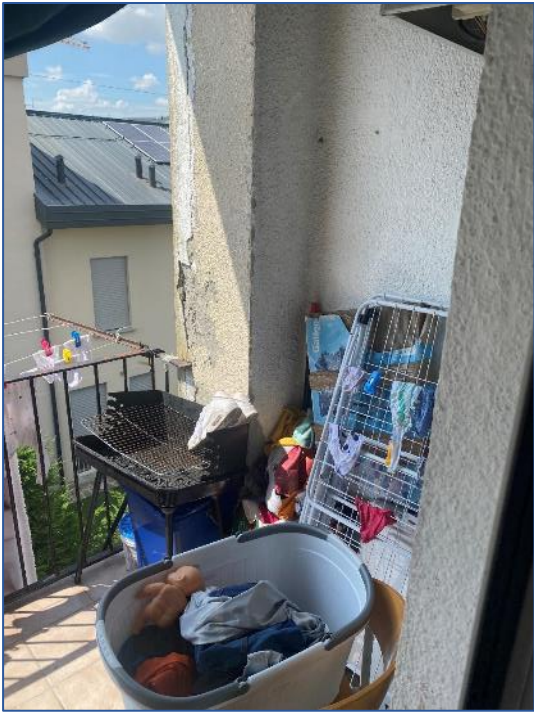
Foto 41 - balcone