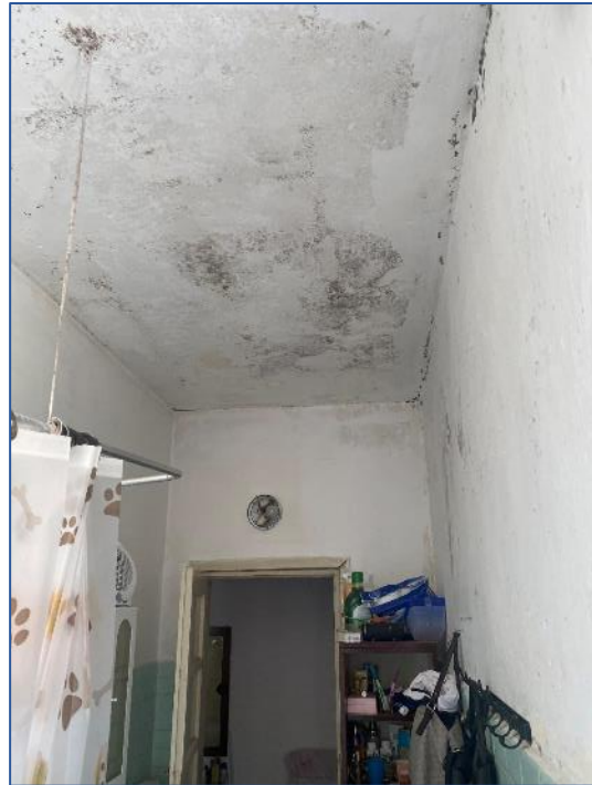
Foto 38 - dettaglio plafone bagno