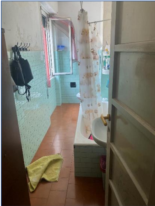
Foto 37 - bagno