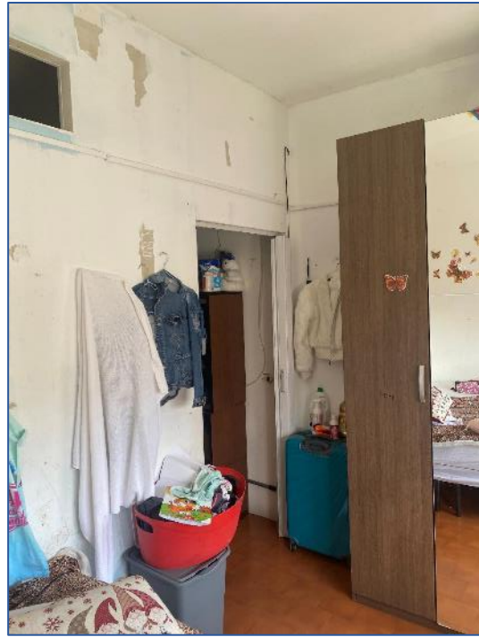
Foto 26 - camera 1