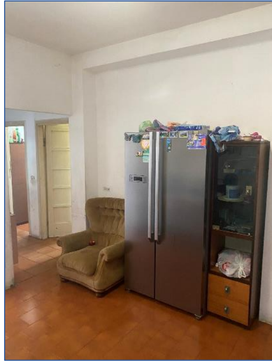
Foto 14 - zona giorno