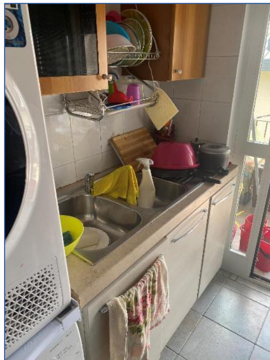
Foto 20 - cucina