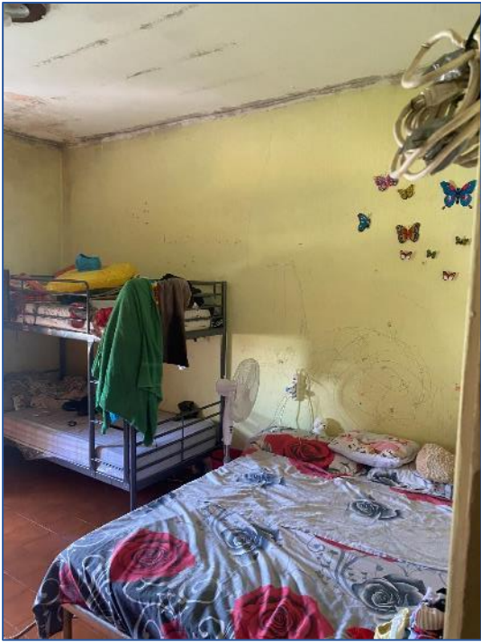
Foto 29 - camera 2