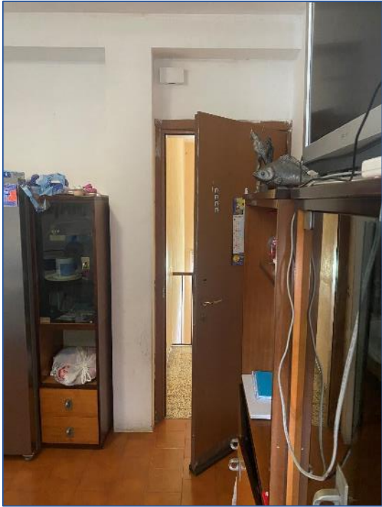
Foto 13 - ingresso appartamento