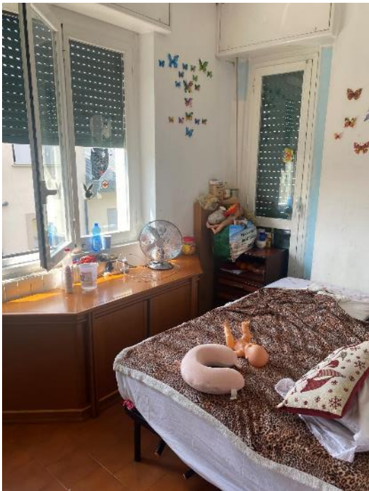
Foto 23 - camera 1