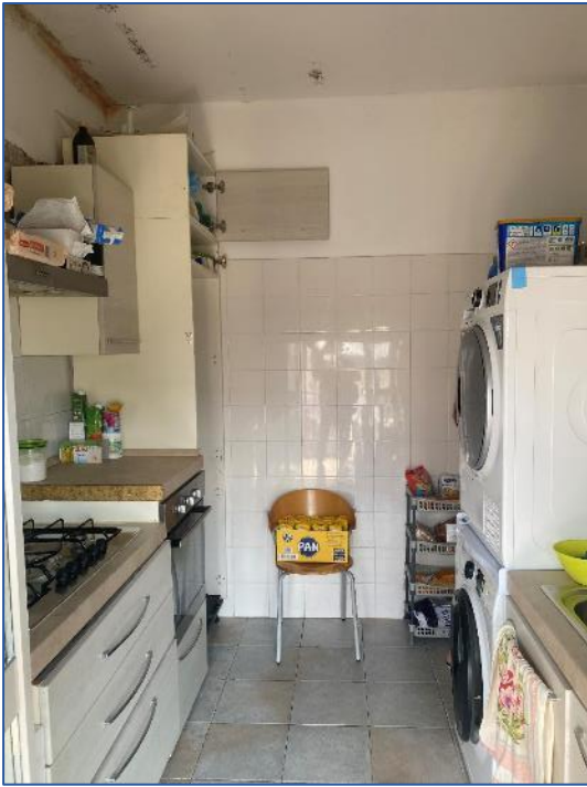
Foto 21 - cucina