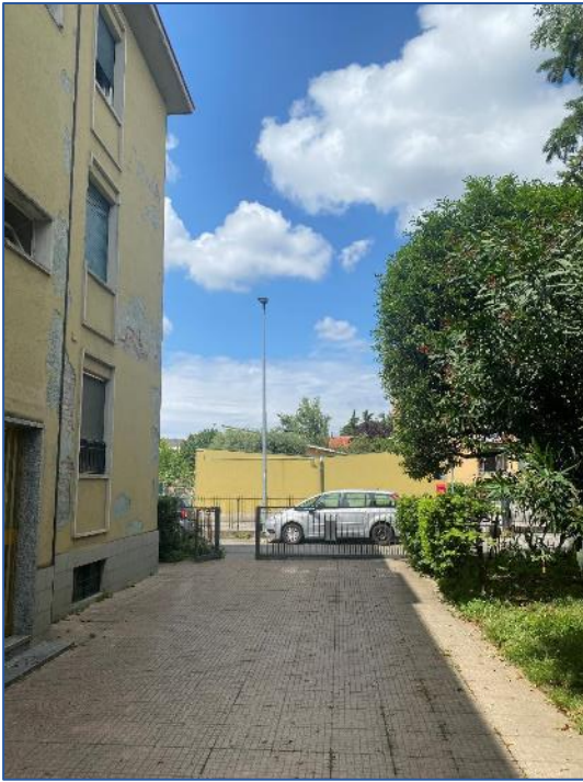
Foto 9 - corte comune