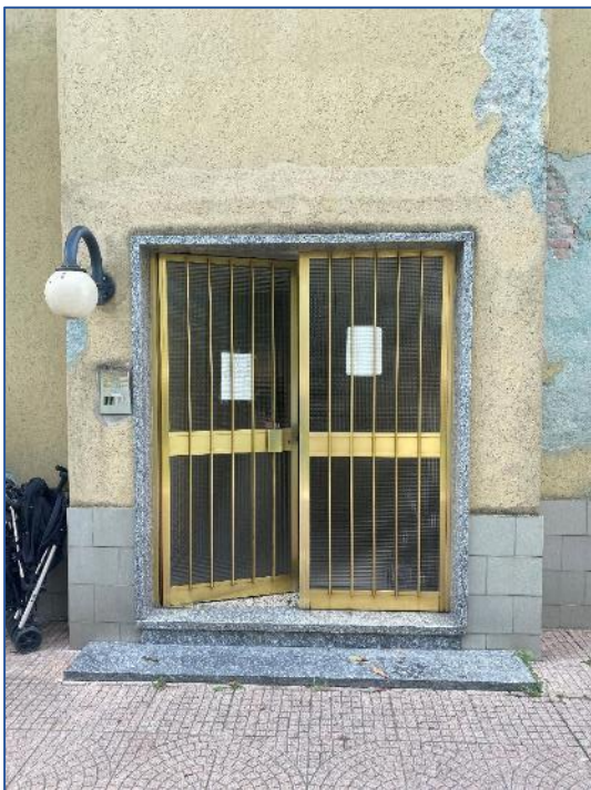
Foto 7 - ingresso comune