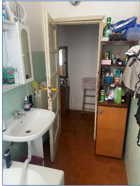
Foto 34 - bagno