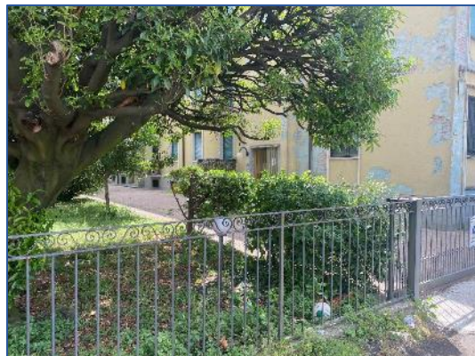
Foto 2 - immobile di via Sant'Orsola n. 5