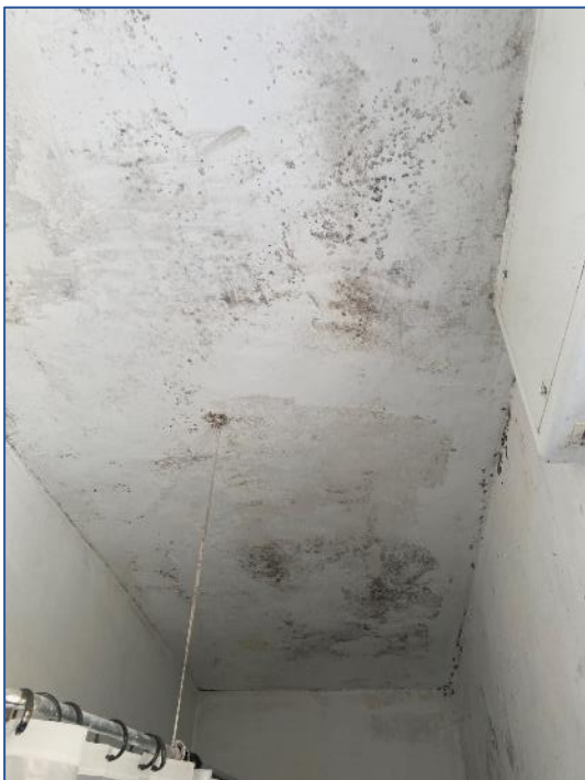
Foto 39 - dettaglio plafone bagno