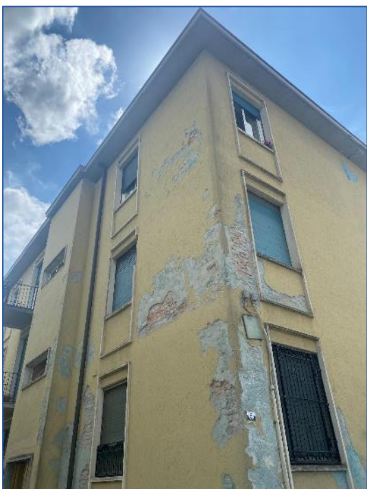
Foto 3 - immobile di via Sant'Orsola n. 5