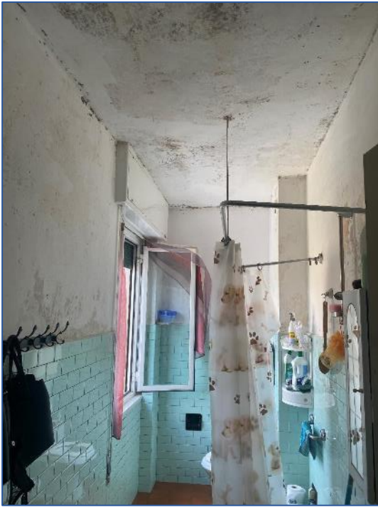
Foto 33 - bagno