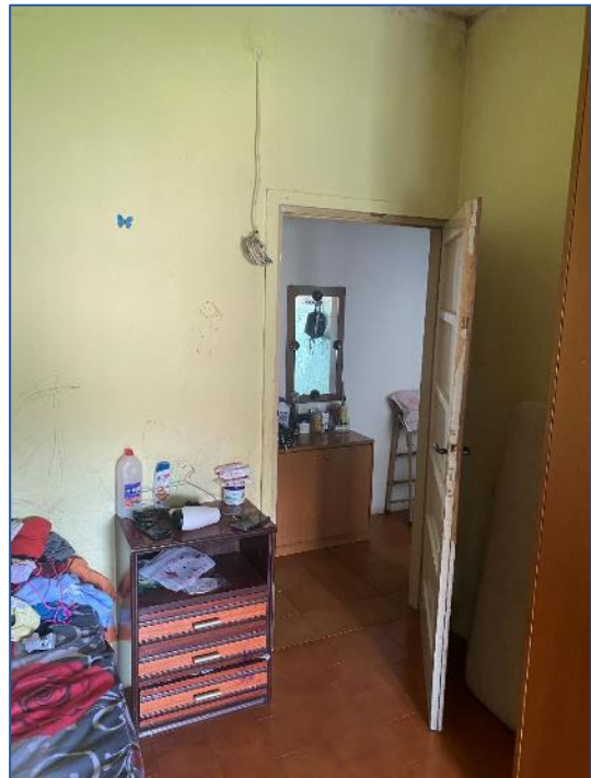
Foto 32 - camera 2