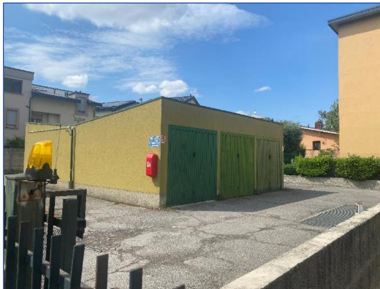
Foto 43 - Box