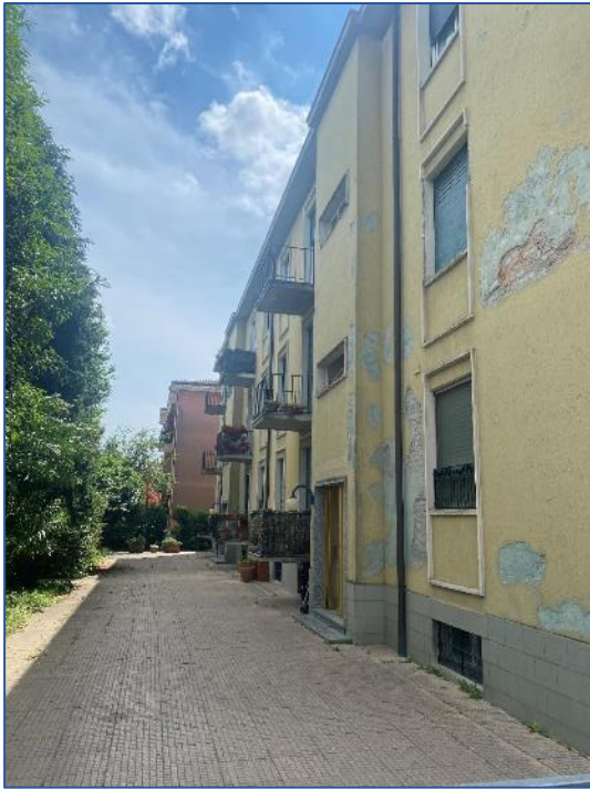
Foto 5 - corte comune