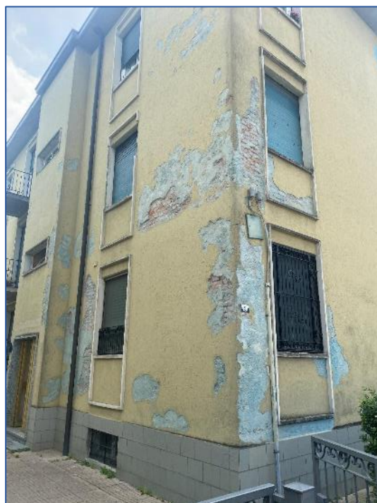
Foto 4 - immobile di via Sant'Orsola n. 5