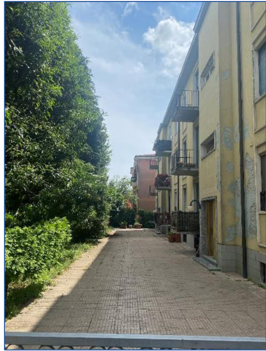
Foto 6 - corte comune