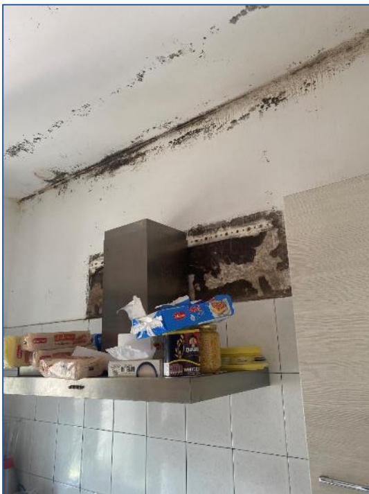
Foto 19 - cucina