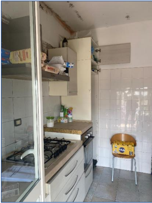
Foto 17 - cucina