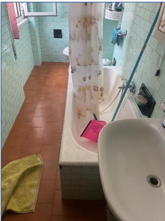
Foto 35 - bagno