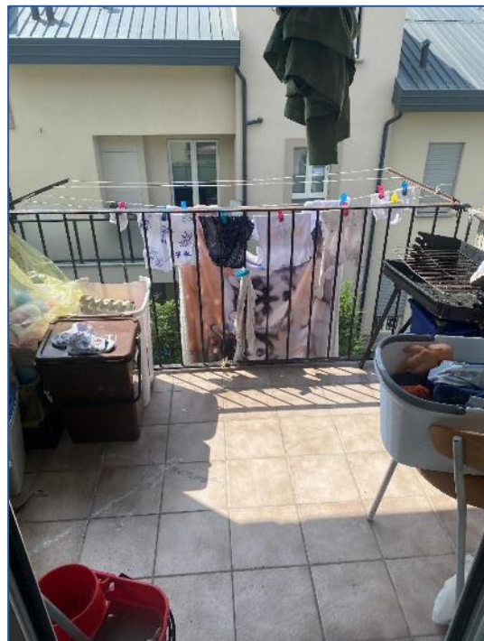
Foto 40 - balcone