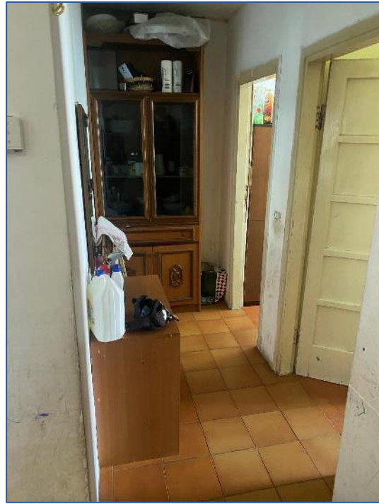
Foto 22 - disimpegno