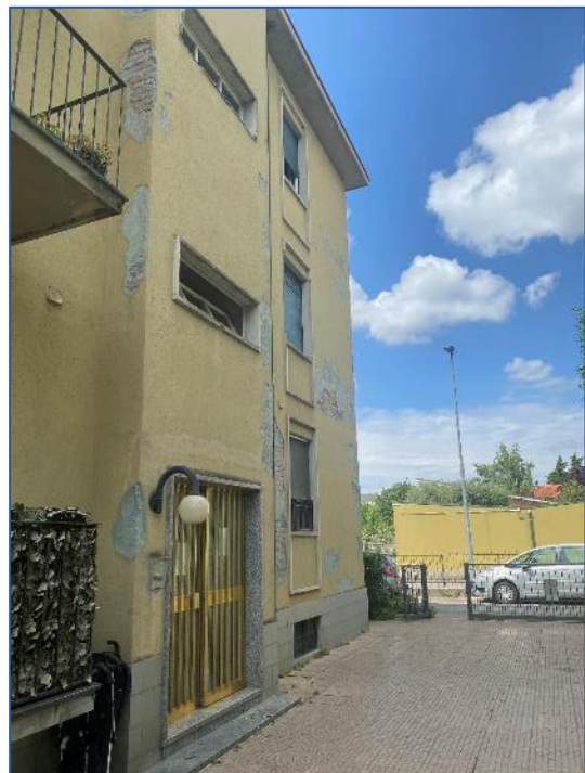
Foto 8 - ingresso comune