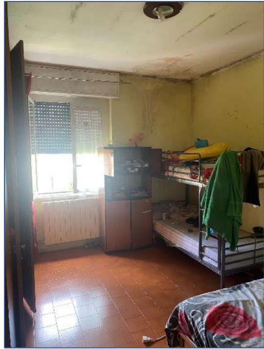
Foto 30 - camera 2