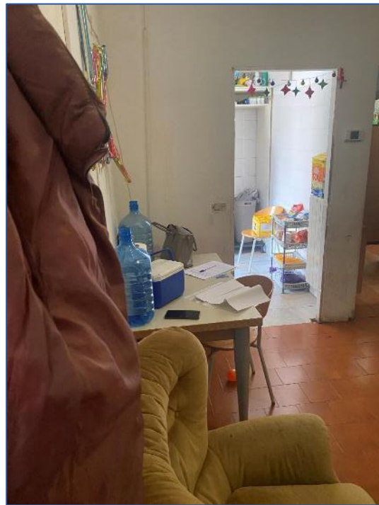
Foto 16 - zona giorno