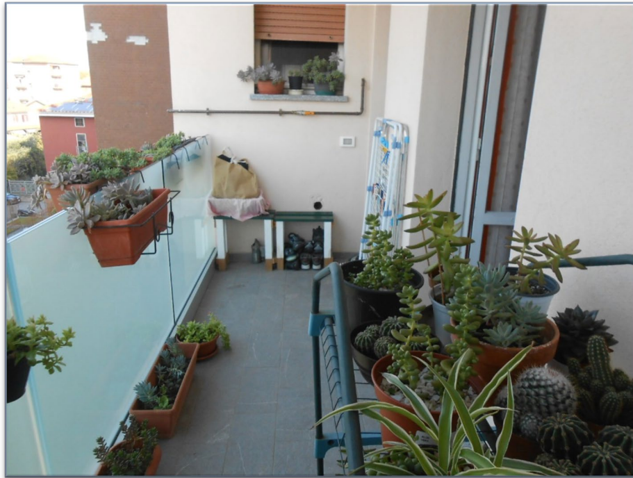
Foto 11 balcone