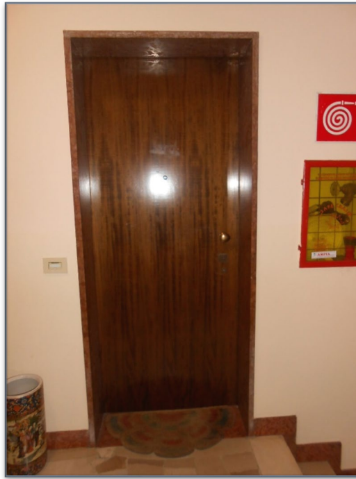
Foto 5 porta ingresso all'appartamento