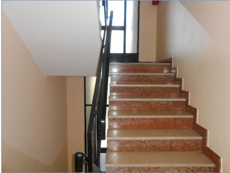
Foto 3 parti comuni