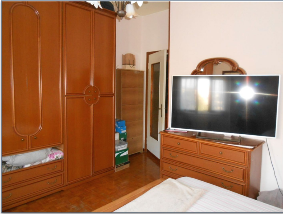
Foto 15 camera doppia