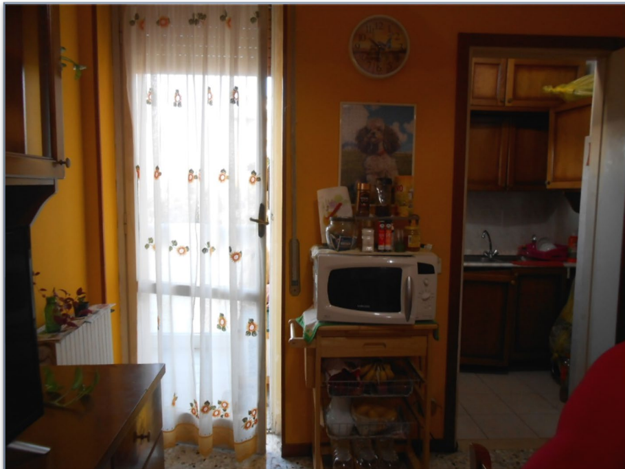
Foto 8 soggiorno