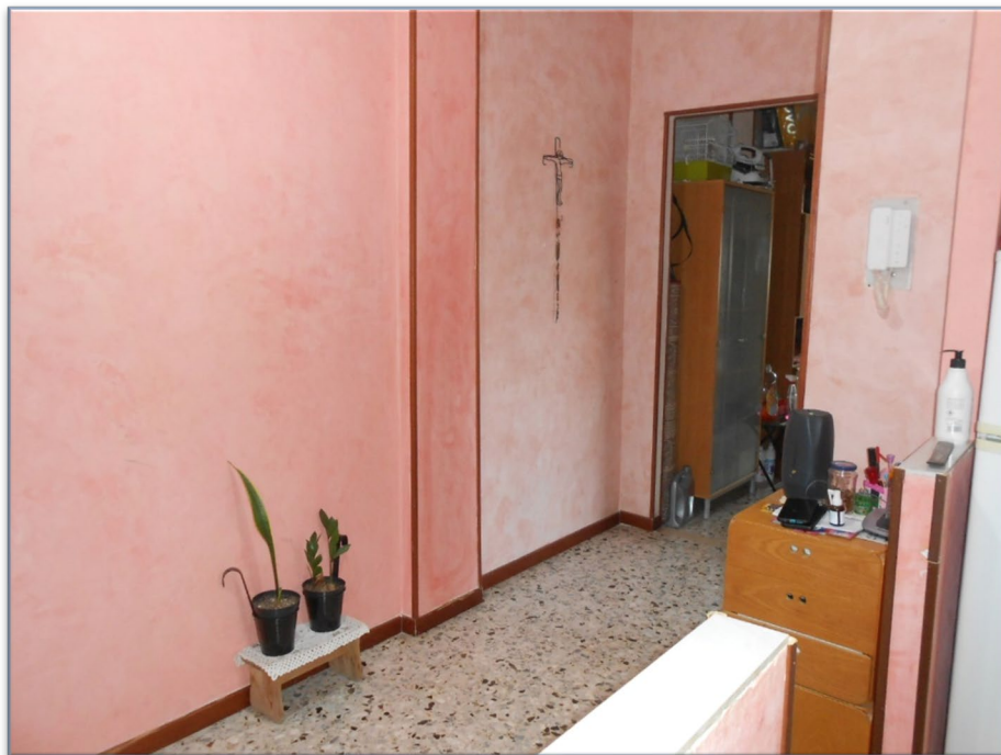
Foto 6 ingresso