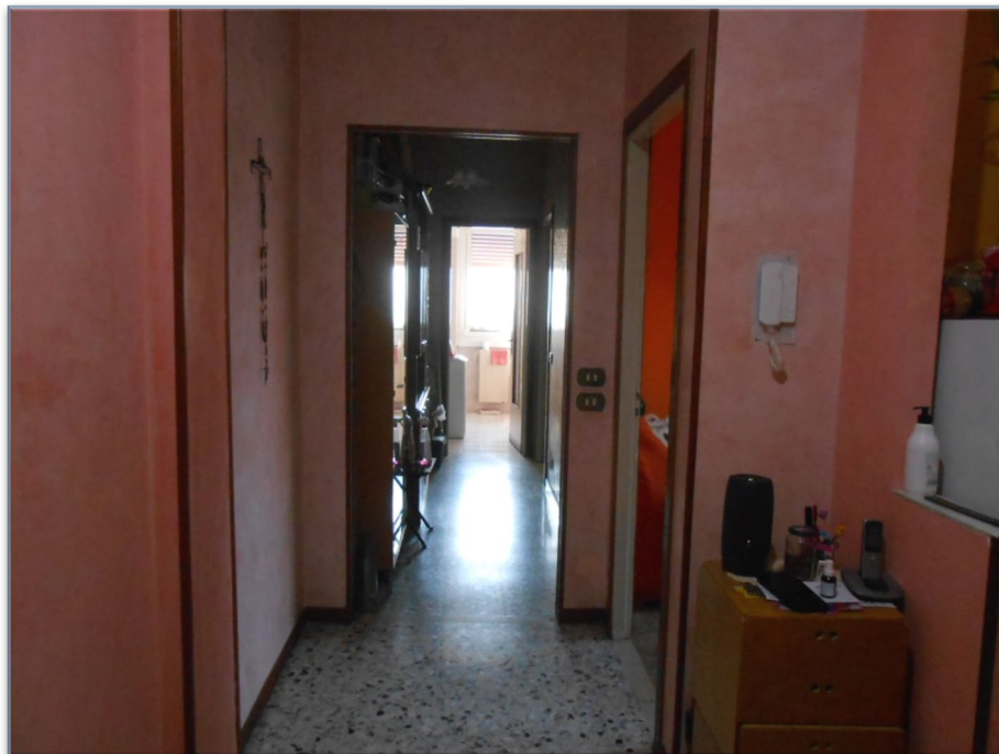
Foto 12 corridoio