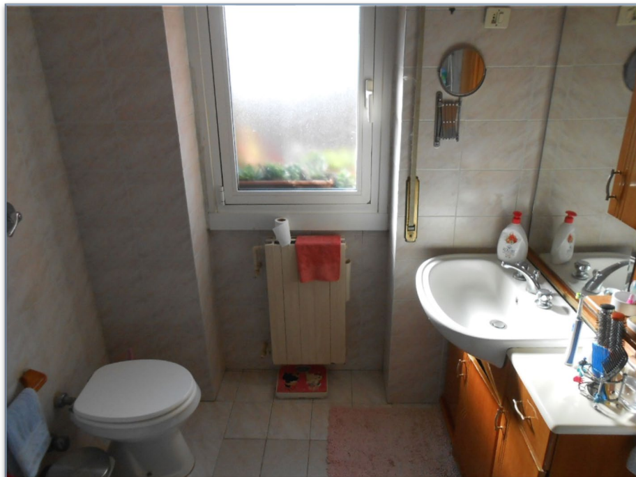
Foto 16 bagno