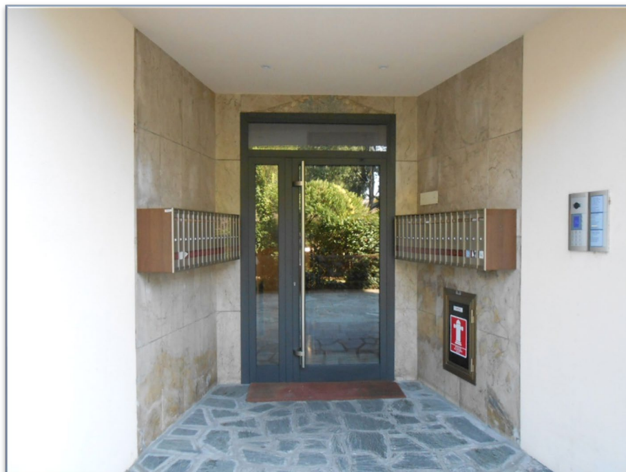
Foto 2 ingresso allo stabile