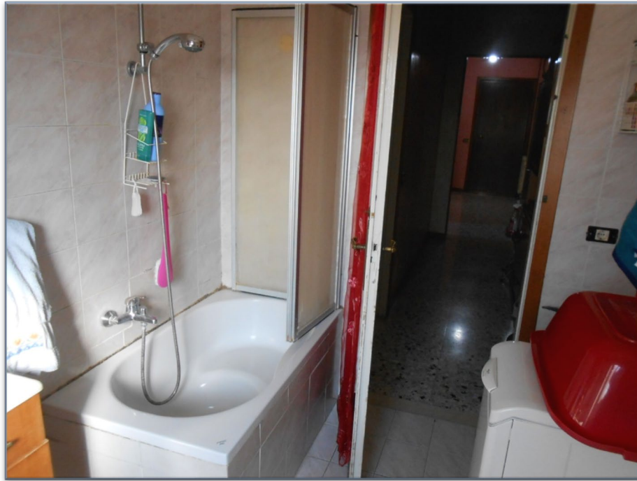
Foto 17 bagno