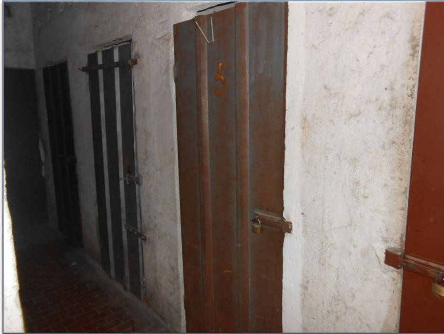
Foto 19 porta cantina