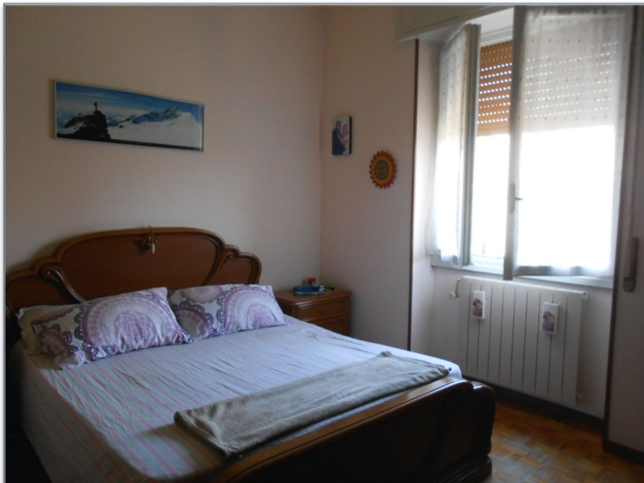
Foto 14 camera doppia