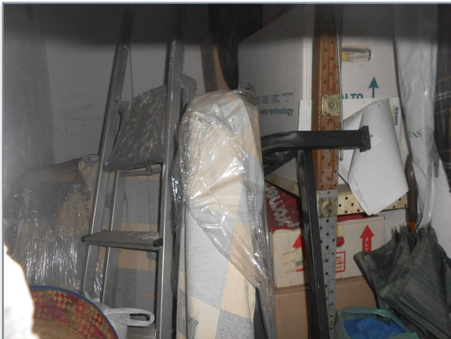
Foto 20 cantina