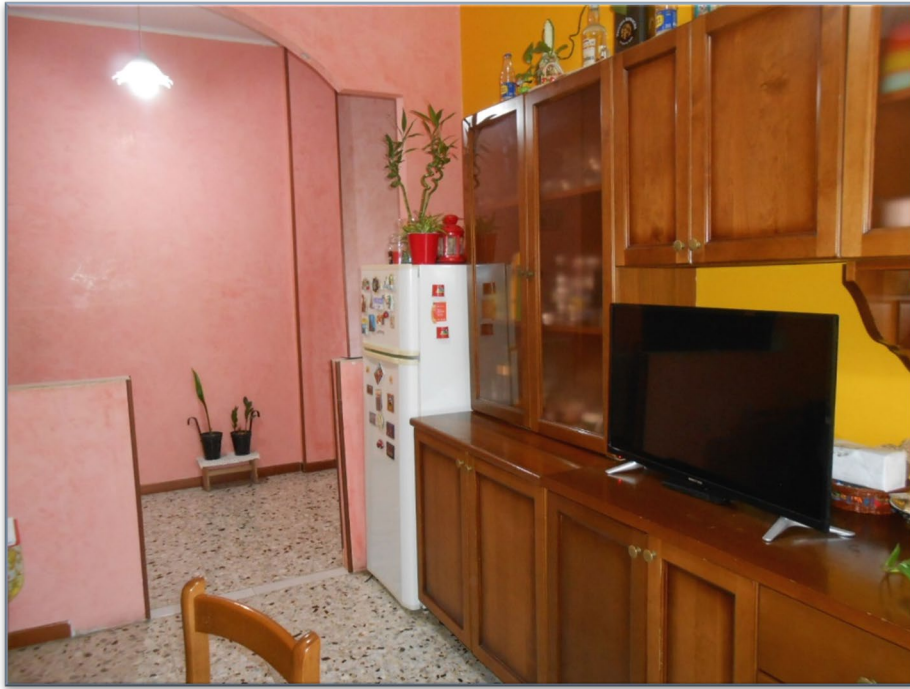
Foto 7 soggiorno