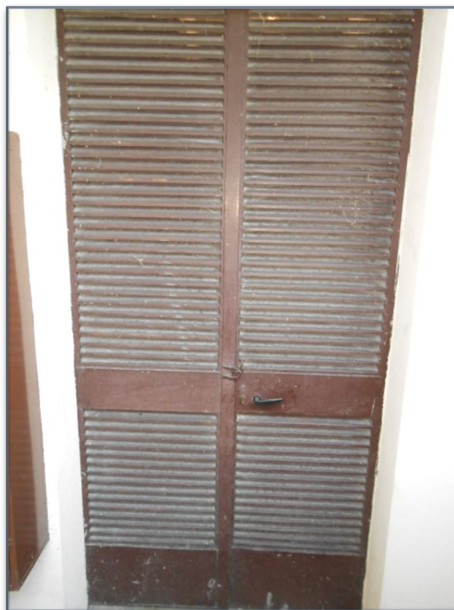
Foto 18 porta ingresso locale cantine