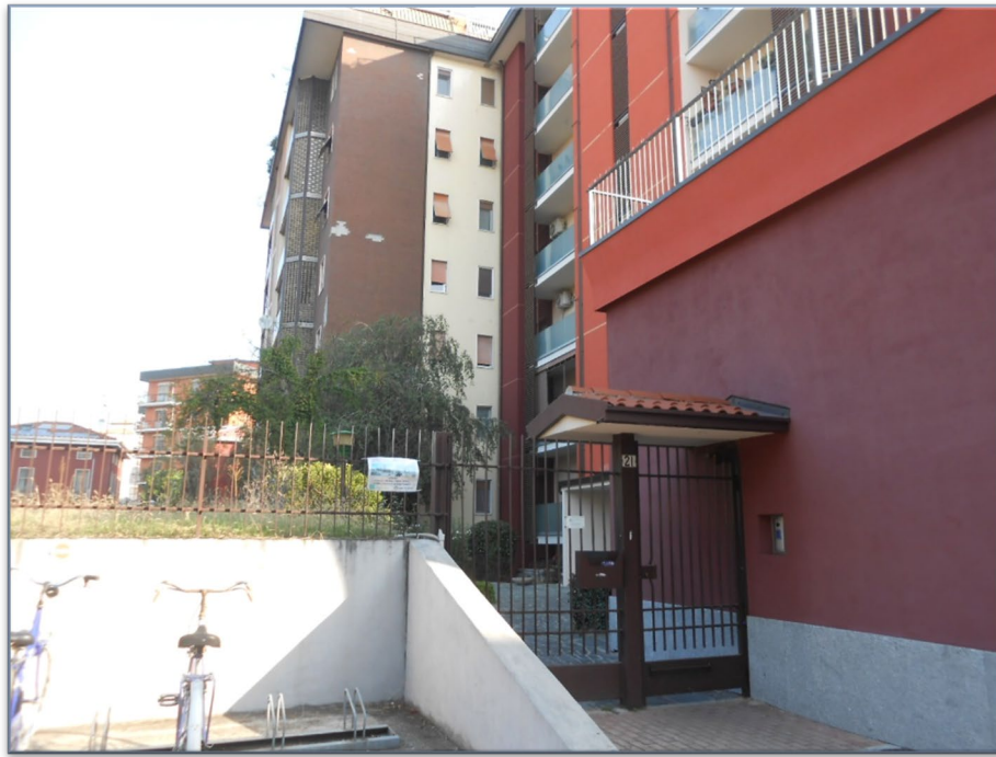
Foto 1 vista dell'edificio