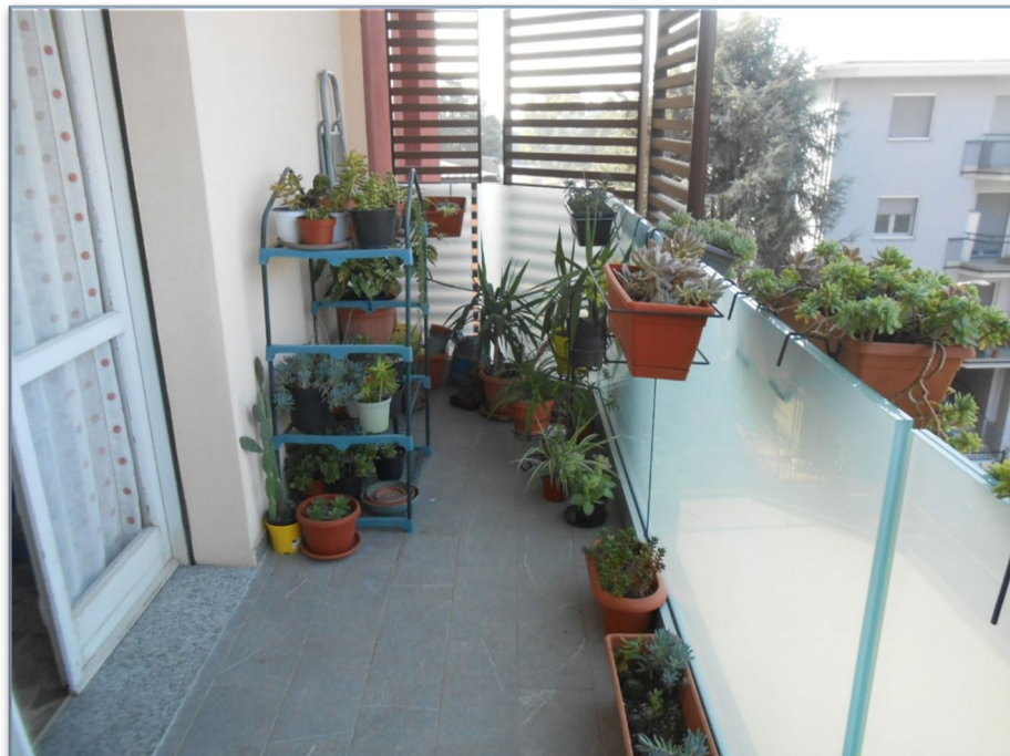
Foto 10 balcone