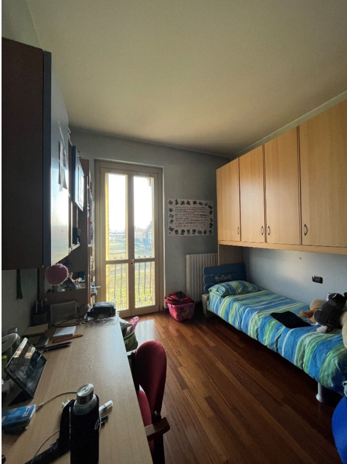
Immagine 14. La seconda camera.