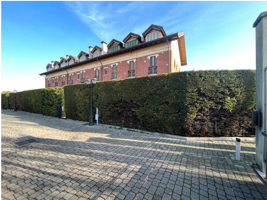
Immagine 1. Il fabbricato visto dal cortile.