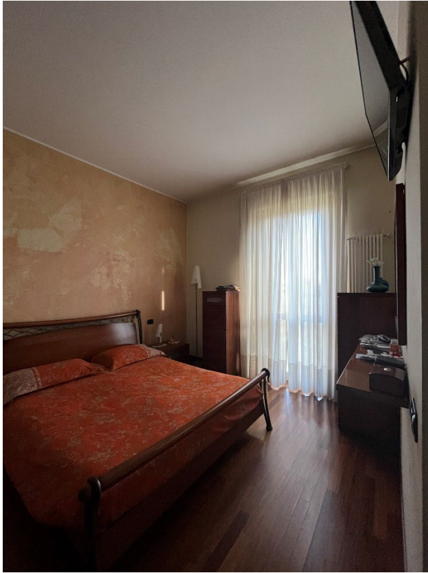
Immagine 11. La camera principale.