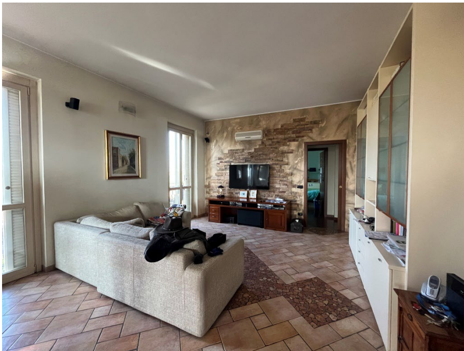
Immagine 7. Il soggiorno.