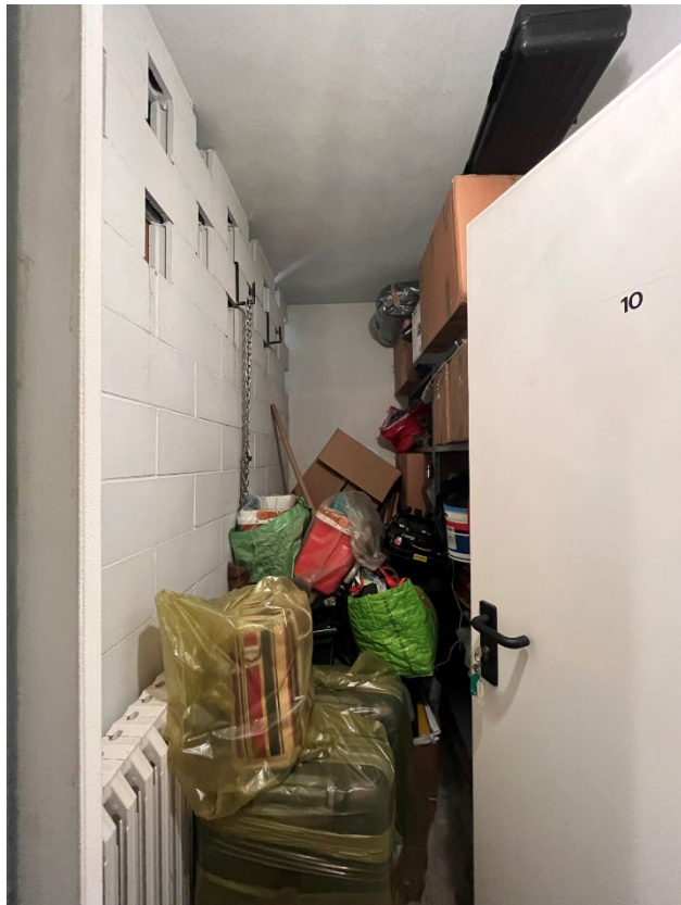
Immagini 18, 19, 20, 21. Le scale che conducono al piano cantina, la zona in cui sono posizionati i contatori elettrici e la cantina.