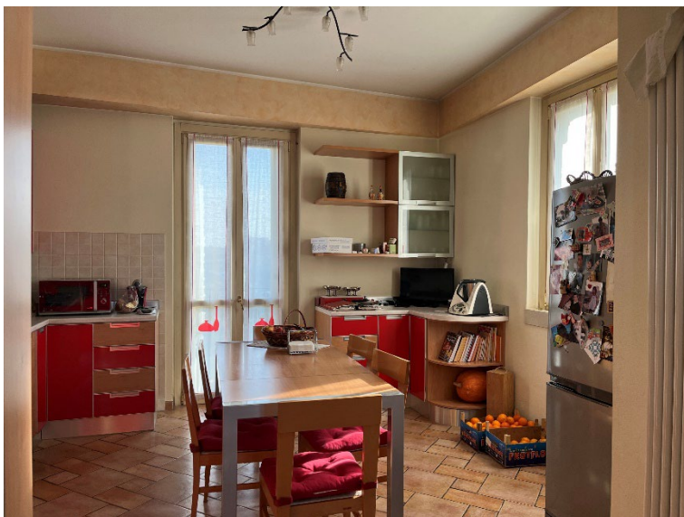
Immagini 9 e 10. La cucina abitabile.