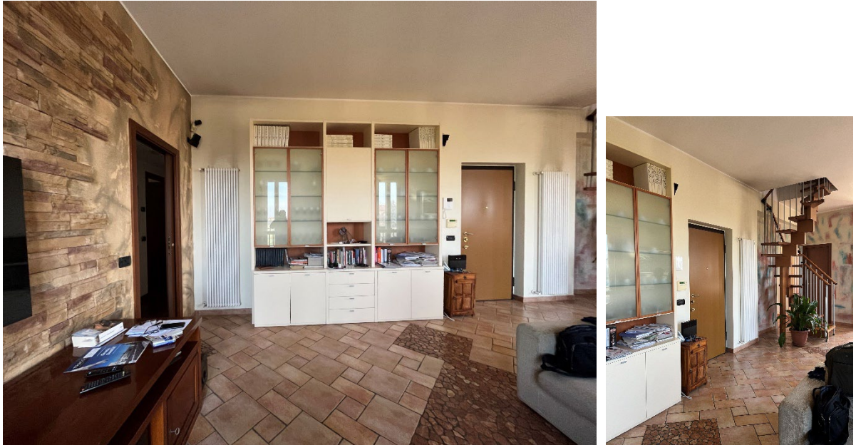
Immagini 5 e 6. L'ingresso che immette direttamente in soggiorno. La scala attualmente presente è prefabbricata e removibile così che chiudendo l'asola si possa interrompere il collegamento con l'unità soprastante non oggetto di valutazione né di pignoramento.