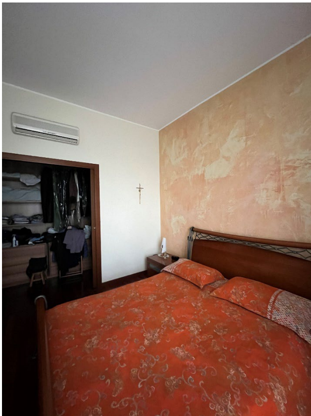
Immagine 12. La camera principale con sullo sfondo la cabina armadio annessa.