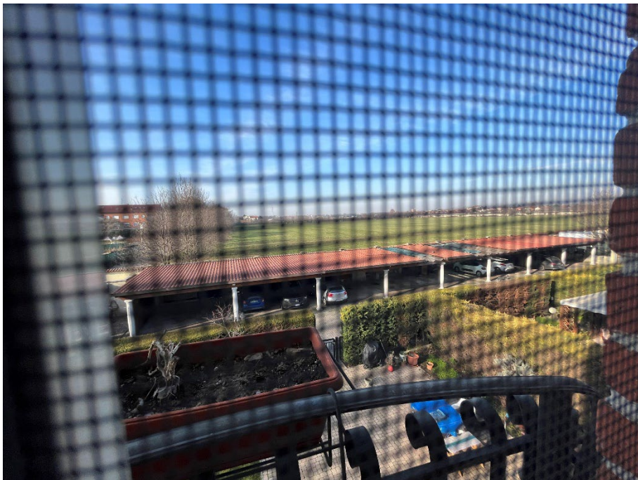
Immagini 22 e 23. Il posto auto in uso esclusivo. La copertura presente è provvisoria e removibile.