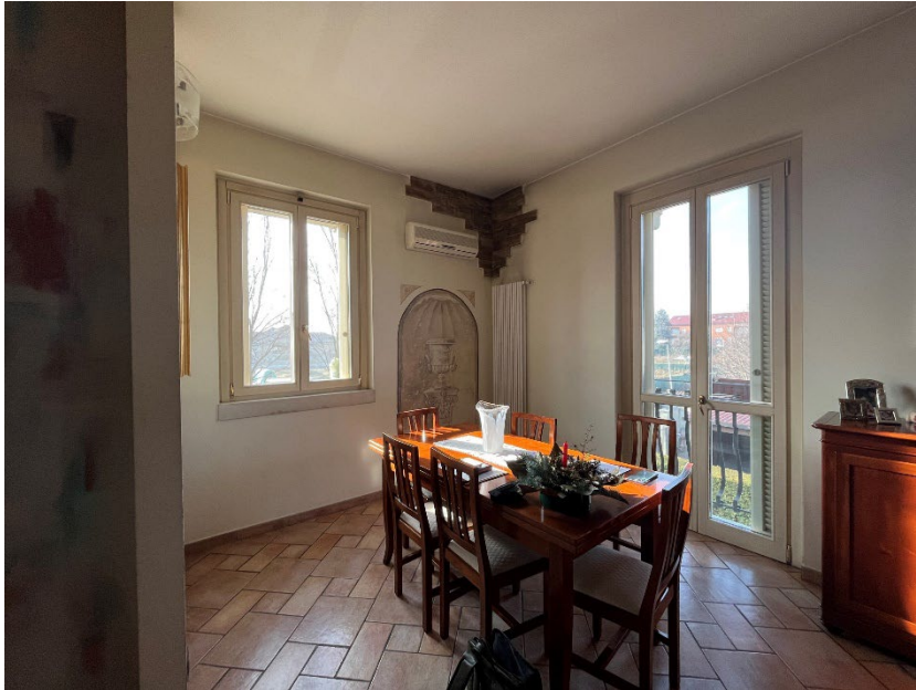
Immagine 8. La zona pranzo all'interno del soggiorno.