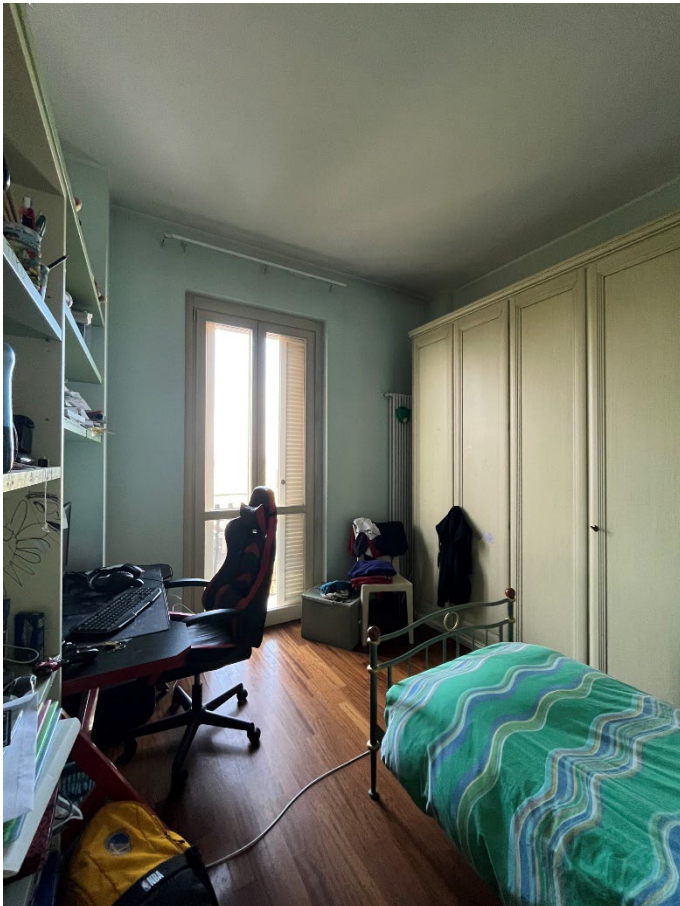
Immagine 14. La terza camera.