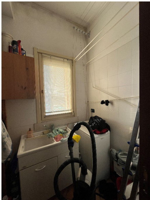
Immagine 17. La lavanderia tra cucina e zona pranzo.