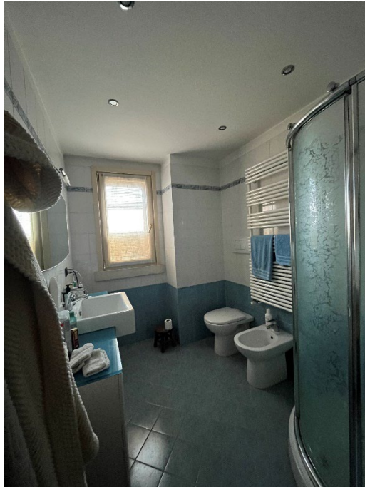
Immagini 15 e 16. I bagni, entrambi aerati e illuminati naturalmente. Il pilastro a sezione circolare è stato aggiunto recentemente per la necessità di un rinforzo strutturale.