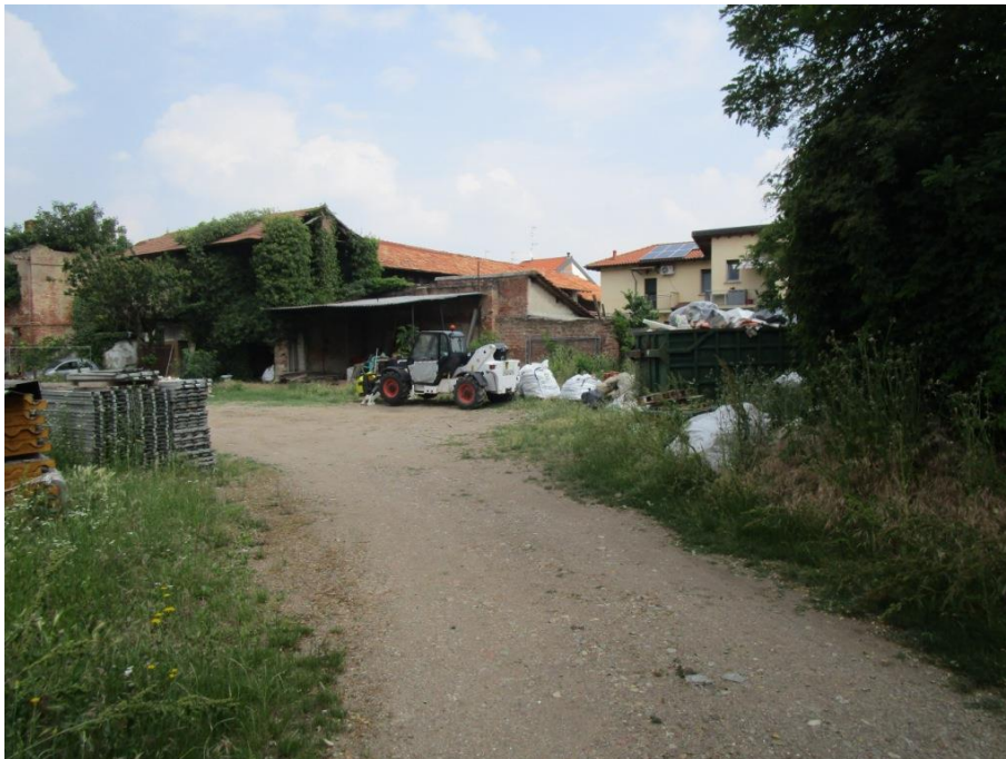
Materiale edile di risulta accatato nel cortile interno