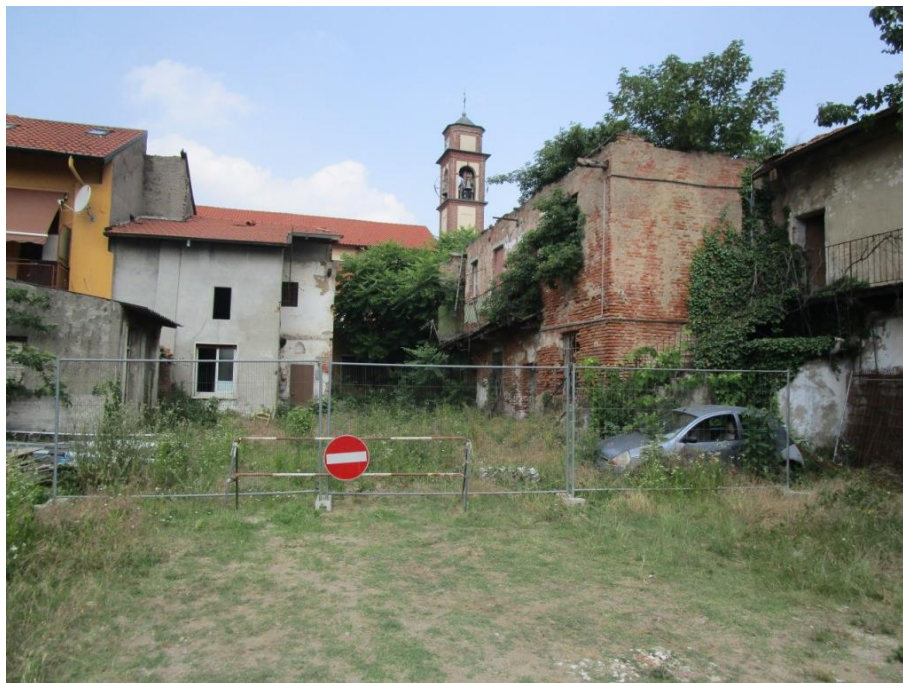
Porzioni immobiliari con affaccio sul cortile interno