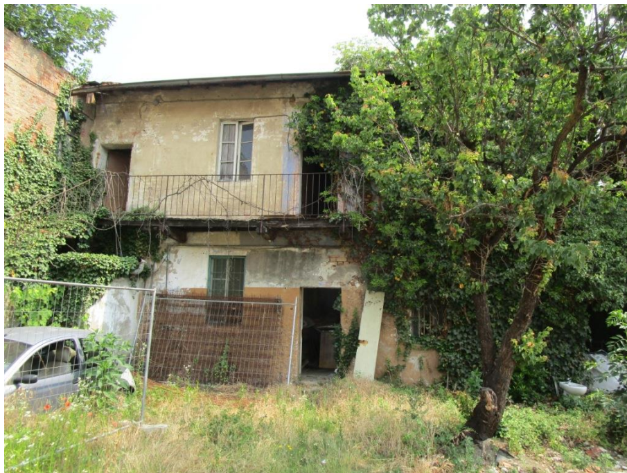
Porzione immobiliare con affaccio sul cortile interno