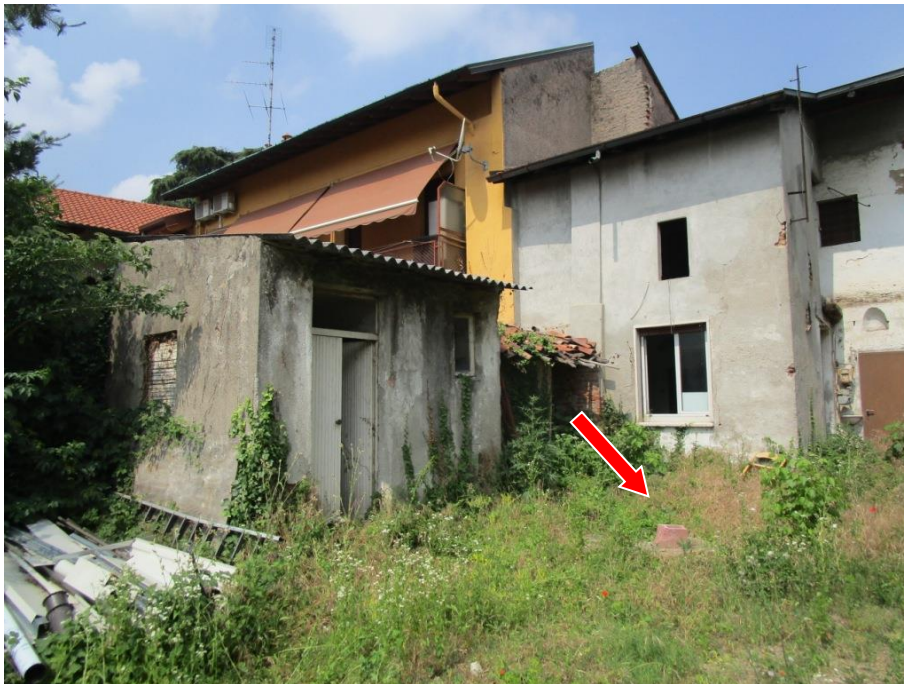
Indicazione del "pozzo"