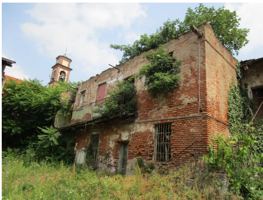
Rustico con affaccio sul cortile interno, in pericolo di crollo