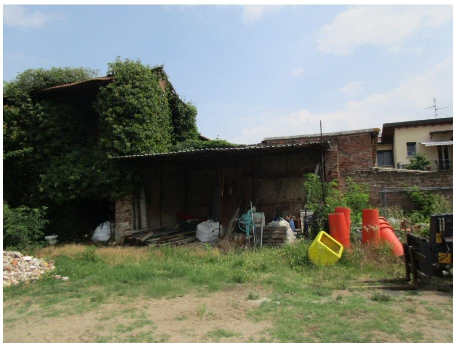
Tettoia di natura "posticcia"