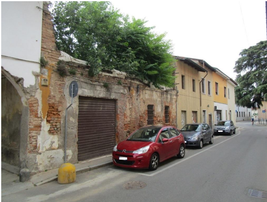
Porzione di muratura di confine, con affaccio su via Gorizia

Si dovrà inoltre tenere presente che per la realizzazione dell'opera si dovrà procedere alla nomina del Direttore dei Lavori; del Coordinatore della Sicurezza per la progettazione; del Coordinatore della Sicurezza per l'esecuzione; oltre eventuali collaudatori ecc.