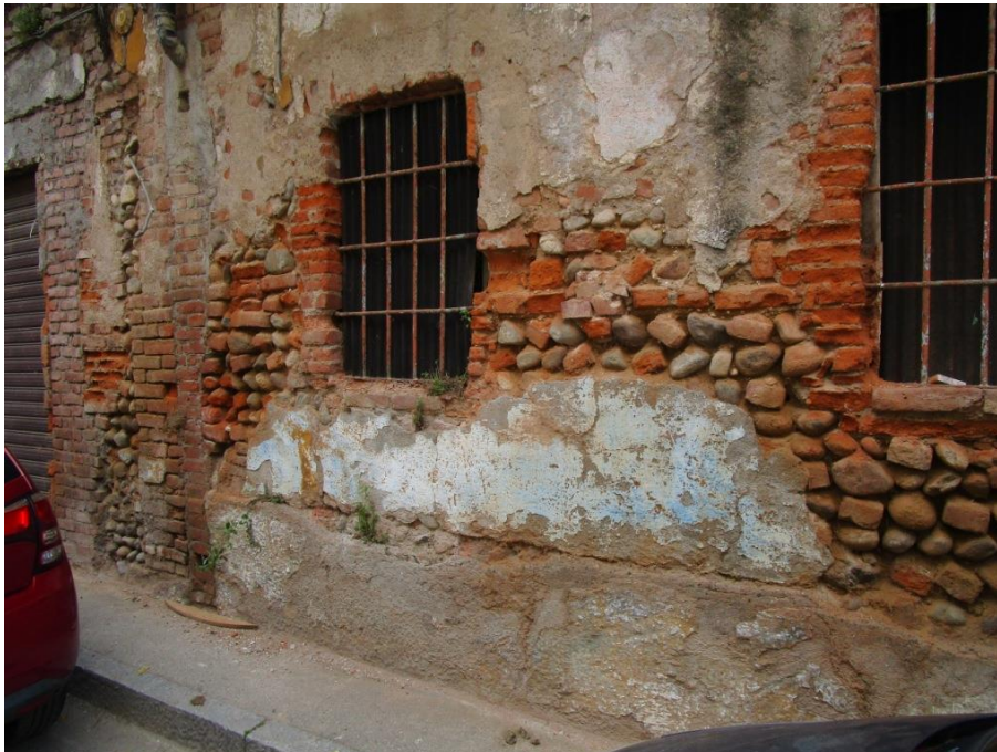
Vista di dettaglio della muratura di confine, con affaccio su via Gorizia