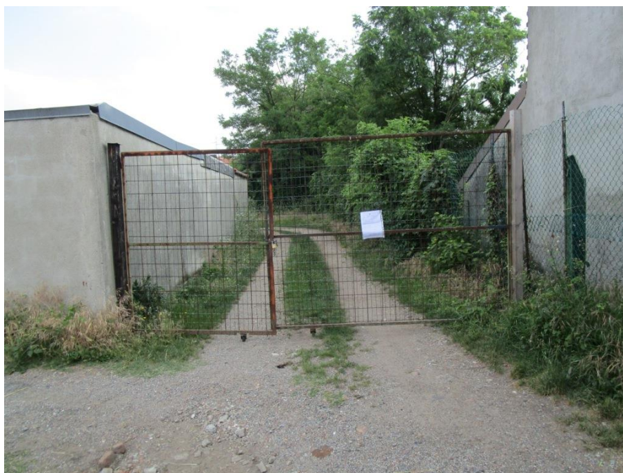
Cancello d'ingresso da via Isonzo

Si precisa che il cancello esistente è di natura posticcia pertanto lo scrivente consiglia la realizzazione di un cancello "più stabile", ad esempio tipo cesata e cancello da cantiere in tavole di legno