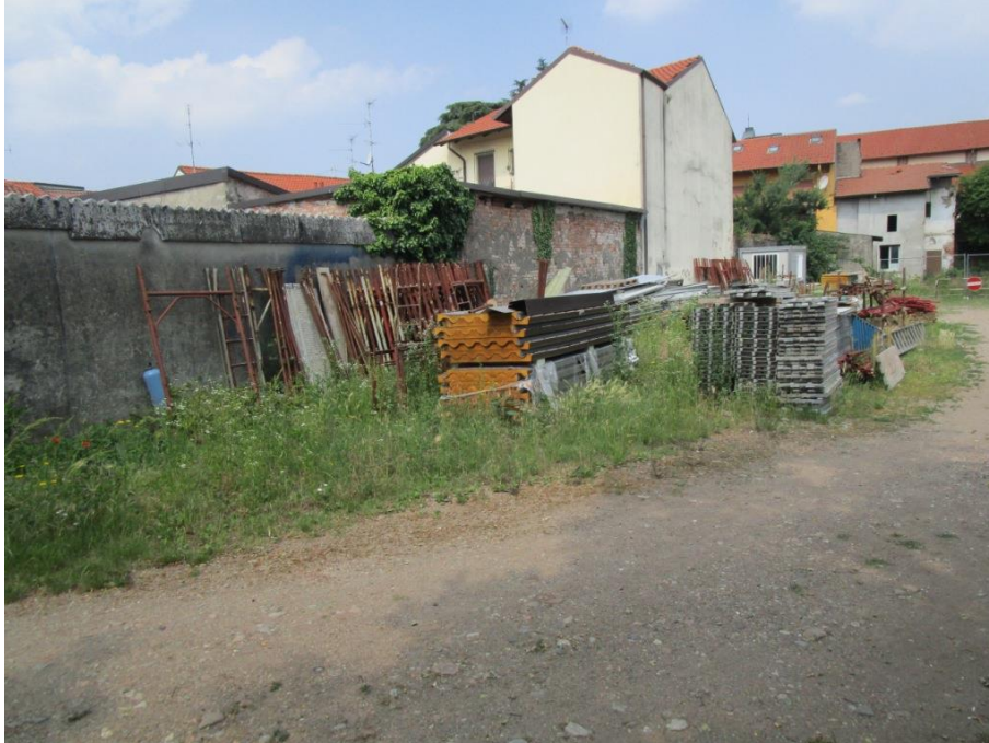
Materiale di cantiere accatato nel cortile interno