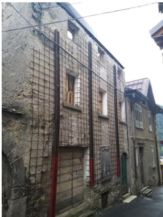
esempio di struttura di rinforzo realizzata in carpenteria metallica