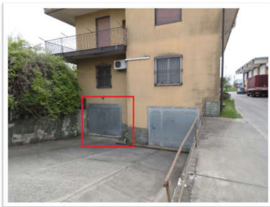
Vista dell'ingresso al deposito.