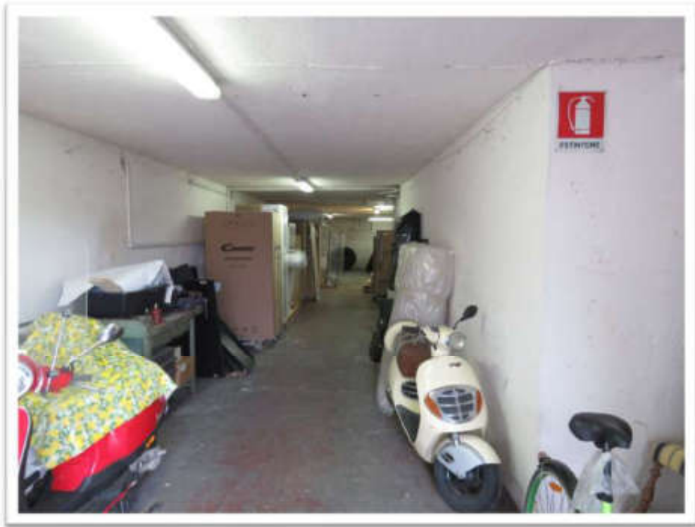
Viste della porzione d'ingresso.