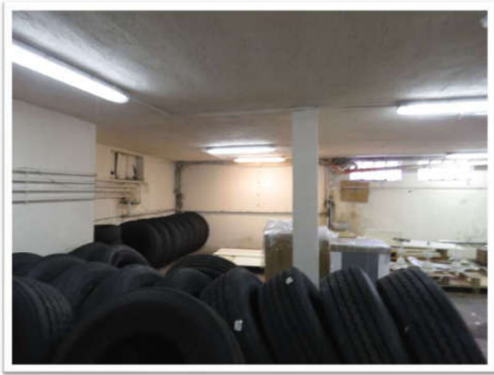
Interni del deposito.