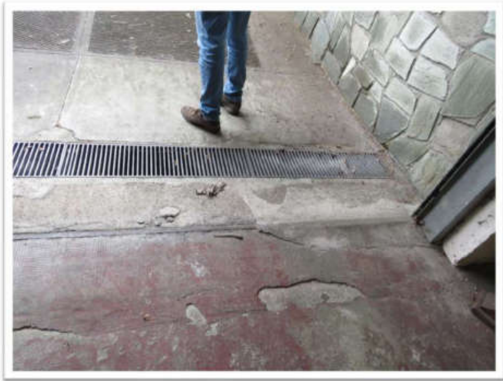
Particolari del degrado delle finiture.