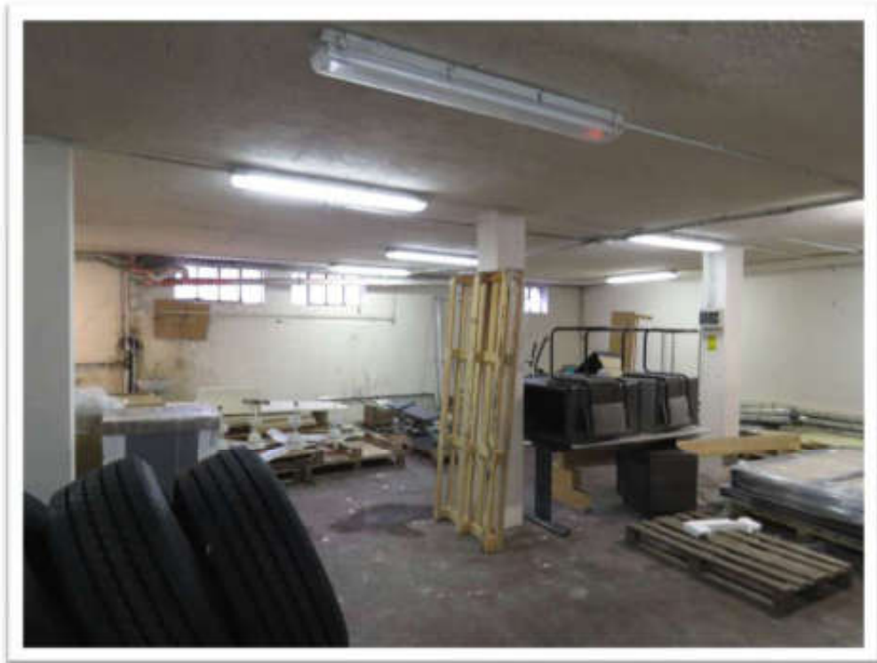
Interni del deposito.