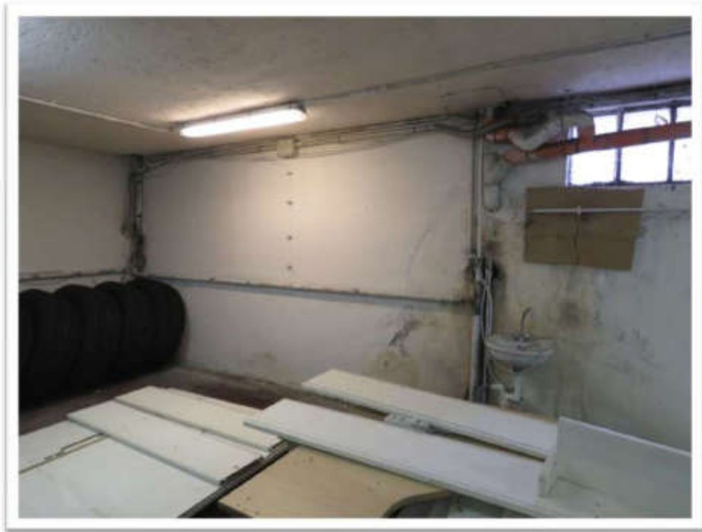
Interni del deposito e particolare dell'umidità di risalita.